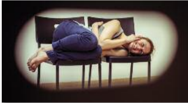
Soha senkinek, Scherer Péter rendezésében

A szakértő pszichológussal folytatott beszélgetés is megerősítette bennünk azt, hogy figyeljünk oda magunkra és környezetünkre. Ha valami-