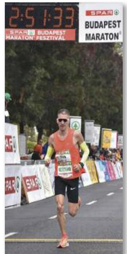
SPAR Budapest Maraton, 2021.

– Célkitűzés és motiváció. Ez visz előbbre egy-egy verseny után. Minden sporthoz, de főként a futáshoz sok idő, energia és kitartás kell.