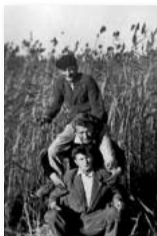
Gúlázás a nádasban

A nyár nemcsak a szünidő miatt jelentett ünneplést hó-