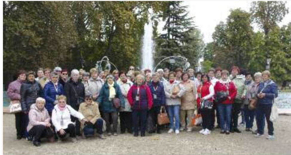
A Nyugdíjasok Egyesülete Budapest nevezetességeit fedezte fel

Tartalmas, élményekben gazdag, csodálatos napot töltöttünk együtt. A Nyugdíjas Egyesület méltón búcsúztatta az idei szezont.