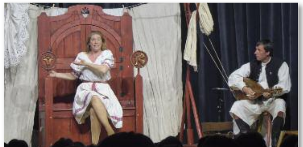
„Ádámságunk és évaságunk története”

Az ünnepségen megtudhattuk, hogy „A legszebb konyhakertek” – Magyarország legszebb konyhakertjei program folytatódik, és jövőre immár 10. alkalommal kerül meghirdetésre. Így a jászárokszállási kertművelőket és kertműveléshez kedvet érőket egyaránt biztatni tudjuk, hogy a téli pihenés után újult erővel tegyék próbára magukat ebben a nemes megmérettetésben.