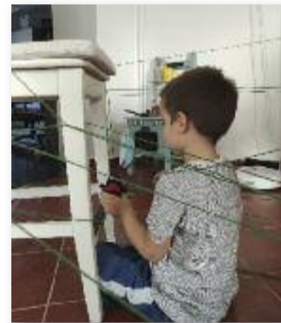
A játék segíti a térbeli tájékozódás fejlesztését

A fonalra fűzzük fel, majd a fonal végét kössük egy székhez. Kérjük meg gyermekünket, hogy segítsen elkészíteni a pók hálóját és ne feledkezzen el különböző tárgyakhoz erősíteni a fonalat. Gyermekünknek így lehetősége van tenni, fűzni, bújtatni az egész házban a gombolyagot. Ami-