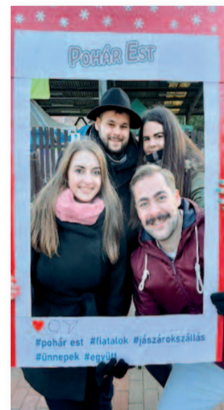
#pohár est #fiatalok #jászárokszállás #ünnepek #együtt

A Piac tér területén vártuk az érdeklődőket, akiket forralt borral és meleg teával kínáltunk, valamint nyeménnyjártékkal és szelfikerettel kedveskedtünk a vendégeknek. Kellemes hangulatú beszélgetésre invitáltuk a város lakóit, akik örömmel érdeklődtek a tanács jövőbeli terveit, munkái iránt, javaslatokkal láttak el minket és bizakodva gondoltak a jászárokszállási fiatal generációra. Köszönjük a helyi önkormányzatnak, a képviselő-testület támogató tagjainak és a Bundy Kft-nek a támogatást, hogy az est megvalósulhatott.