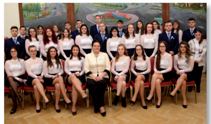
A 12. A osztály