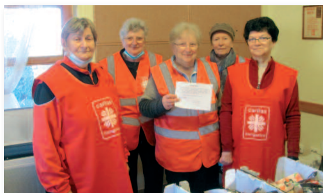
A karitász csoport 2021-ben is több alkalommal segítette a rászoruló családokat

„MI BOLDOGÍT A LEGTÉLJESEBBEN? A MÁSIK EMBERNEK HASZNÁRA LENNI.”