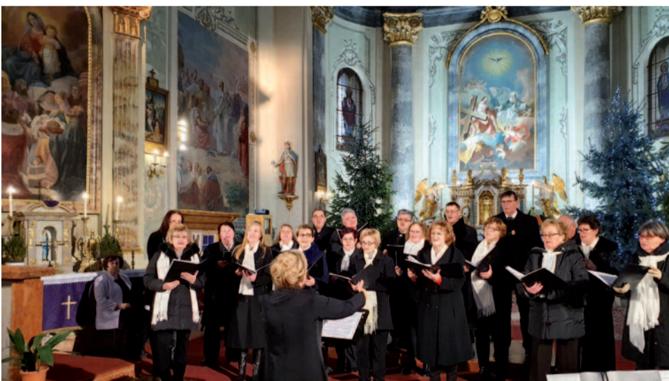
A jászberényi Déryné Vegyeskar karácsonyi koncertje