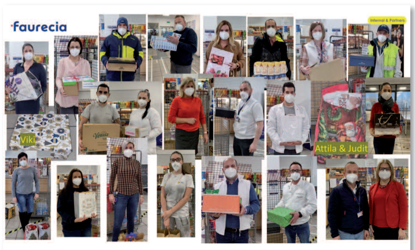
Az adománygyűjtés résztvevői

Köszönjük a jótékonyági gyűjtésben részt vevő dolgozók önzetlenségét.