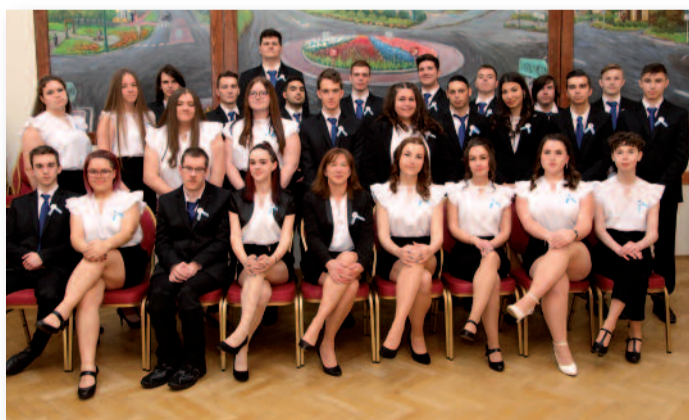
A 12. B osztály