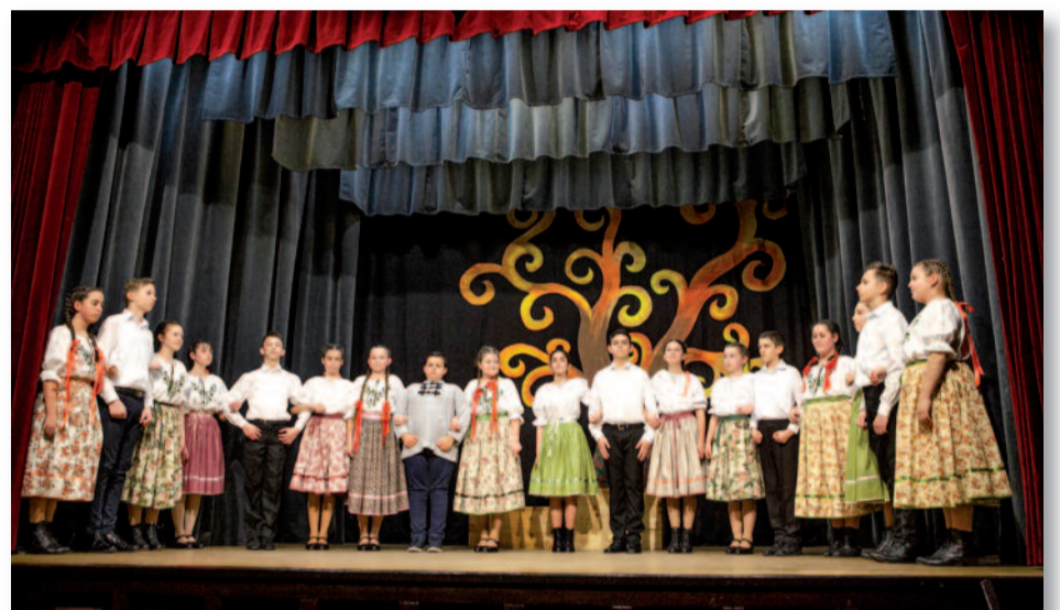
Az ünnepi műsor résztvevői

Az ünnepség első részében az általános iskola alsó- és felső tagozatos tanulói egy vi-