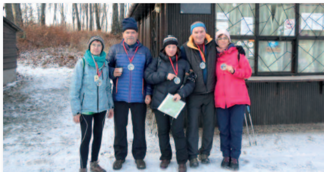
A 10 km-es túra résztvevői

idő múlása már látszik rajta. Visszafordulunk, majd leérve a nagyparkolóhoz a Sárga sávon haladunk tovább a Mátrai Gyógyintézet mellett. Átmegyünk a főúton és az erdőben folytatjuk tovább a túrát. Az elágazót elérve a Sárga négyzetet követjük, amely kissé meredeken emelkedve visszavezet bennünket Mátraházára.