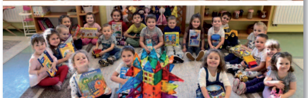
Karácsony a legkisebbekkel