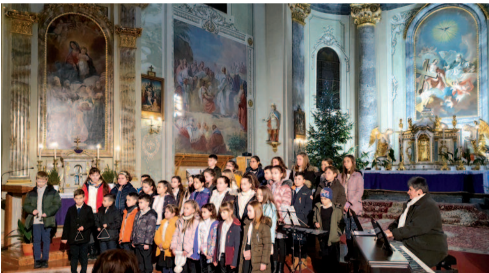
A Széchenyi István Általános Iskola és Alapfokú Művészeti Iskola tanulójának adventi hangversenye

VÁLOGATÁS A JÁSZVIDÉK DECEMBERI LAPZÁRTÁJÁT KÖVETŐ PROGRAMOKBÓL