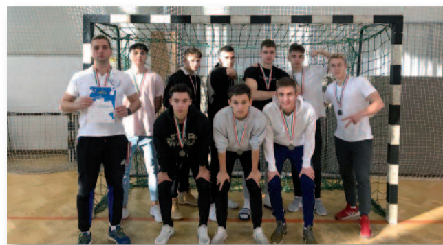
Az országos elődöntő 3. helyezett csapata