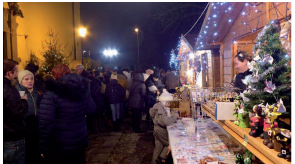
Közös éneklés, kézműves adventi vásár