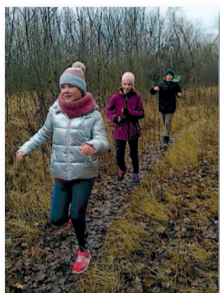
Közel 70 résztvevővel zajlott a rendezvény

Ezúton is biztatunk mindenkit arra, hogy a hideg téli időszakban is induljon el. Futni, kocogni, sétálni. Egyedül, családdal, barátokkal. Egy futás, kocogás, séta testi-lelki feltöltődés. Sok ilyet kívánunk mindenkinek 2022-re!