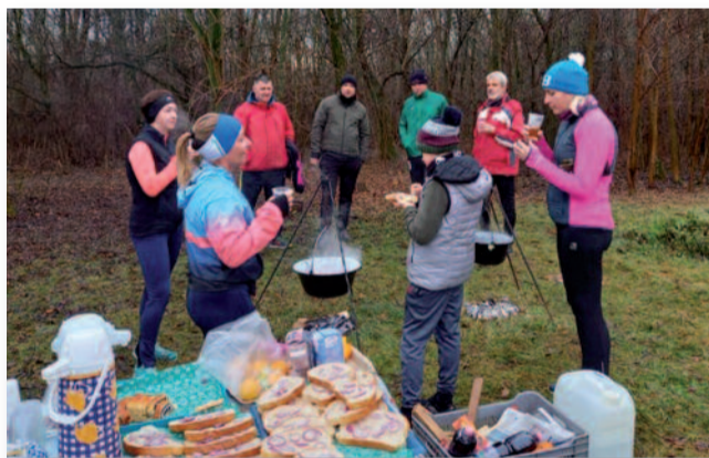
A befutókat meleg tea, forralt bor és zsíros kenyér várta

2017-ben rendeztük meg első alkalommal ezt az eseményt, ami sok érdeklődőt vonzott, így azóta minden évben ott vagyunk év végén a kápolnánál, hogy egy kö-