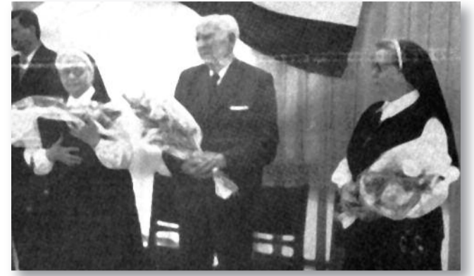
Kitüntetés átadás, 1993. május

Budapesten végezte. 2 évig dolgozott Pesten kórházban, majd hazajött szülőfalujába és megkezdte azt a munkásságát, amelynek jó néhány jászárokszállási lakó életét köszönheti. Életét ténylegesen a gyógyításnak szentelte. Kinevezték körzeti orvosnak, később pedig a szülőotthon vezetőjének. Nem törődött a kényelmével, hiszen lovaskocsival kiment azokra a tanyákra, ahol az orvosi segítség elengedhetetlen volt. Az emberek apróbb és nagyobb egészségügyi problémájukkal bátran