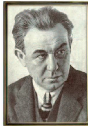
A Nemzeti Színház örökös tagja

Halálát agyvelőlob (gyulladás) okozta 1924. november 14-én. Temetése nagy pompá-