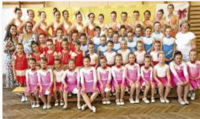
Közel 60 táncos lépett fel

A mini korcsoporttól egészen a juniorokig, minden táncos megmutatta tudását, indulót, show táncot és pompós koreográfiákat láthattunk. A gyerekek technikai fejlődése jól látszott a produkciókon, a lépések, alakzatok kialakítása pontos volt. A tánc iránti szeretet az egyéni és páros produkciókban is meg-