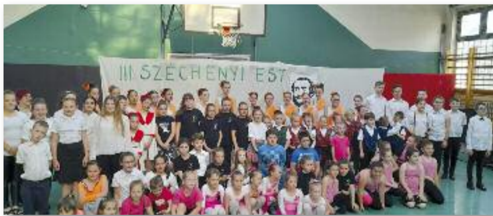
Az est résztvevői

Iskolánk névadójának, Széchenyi Istvánnak szavai valóban érvényesek voltak a Széchenyi estre: „Minél többet és minél szélesebb körben munkálkodhatik valaki, annál nagyobb az ő igazi, benső földi boldogsága.”