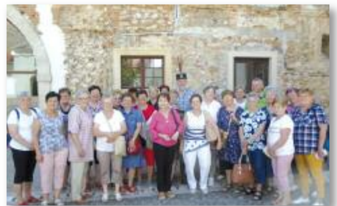
A Dunántúl felfedezése

A kastélykertben interaktív tanösvények vezetnek be a park történetébe és az azt be-