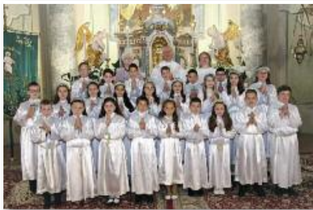
Elsőáldozó gyermekek és felkészítőik