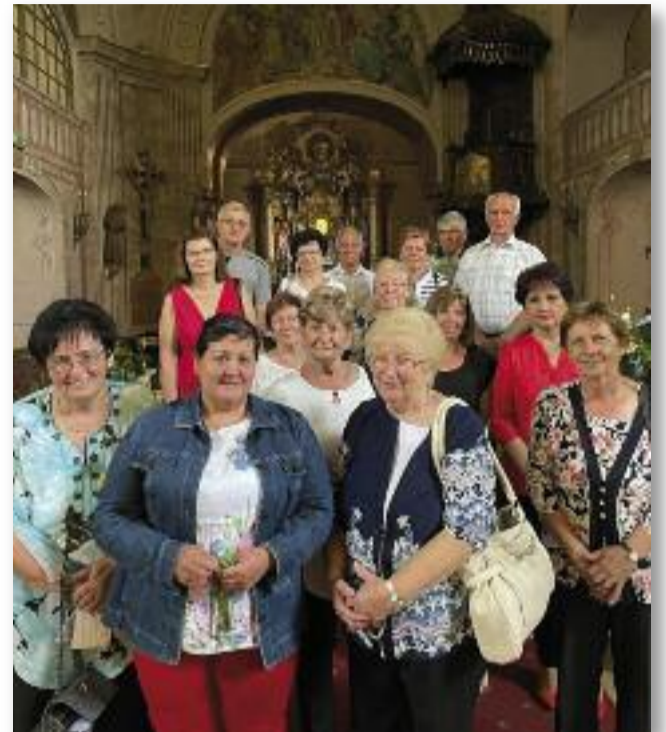
A máriabesnyői kiránduláson

Hogy karitászcsoportunk tagjainak is részesüljenek egy kis élményben, június 5-re egy kirándulást szerveztünk. Előbb Máriabesnyőn, a Mária-kegyhelyen tekintettük meg a templomot, mely ugyan zárva volt, de örömtöltötte el szívünket, amikor a kegytárgybolt eladója bevállalta és tájékoztatta a csoportot a templom történetéről és az ő segítségével a templomba is bejuthatunk.