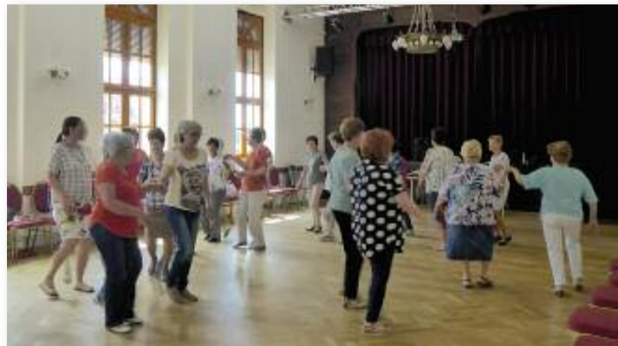
A táncok sokfélék: páros tánc, körtánc, blokk-tánc, ülőtánc, udvari táncok