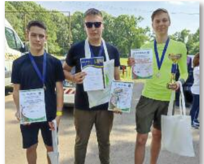
A „Legaktívabb csapat”

A vetélkedő állomásain végighaladva a tanulók gyakorlati és elméleti feladatokat oldottak meg. Voltak puzzle összerakásával, lövészettilki és elsősegélynyújtással kapcsolatos feladatok is. A drogok hatásával, az elvonási tünetekkel és az ellenanyagokkal foglalkozó kérdésekben szintén számot kellett adniuk tudásukról a diákoknak, akik játékos formában