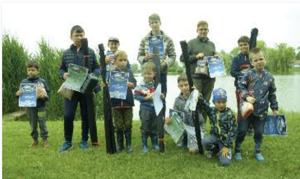
Összesen 56 db halat sikerült kifogni