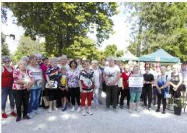
A fehérvárcsurgói szakmai kiránduláson részt vevők

Ezekben a hetekben folynak az előkészületeink a július 9-i Virág és dísznövény