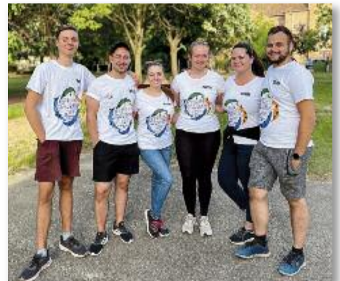
Az Ifjúsági Tanács tagjai

A Sportválasztó Nap egy közös futással zárult a gimnázium udvarán, a helyi Sprinter Spanok bemutatásával együtt, ahol öröm volt látni, hogy több kisgyermek, fiatal, anyuka, apuka, nagymama, nagypapa is megtett közösen néhány kört a futópályán. Mire célba értek, több mint 100 fő pecsétgyűjtője megtelt, vagyis egészen a nap kezdete óta együtt sportoltak velünk a legaktívabbak.