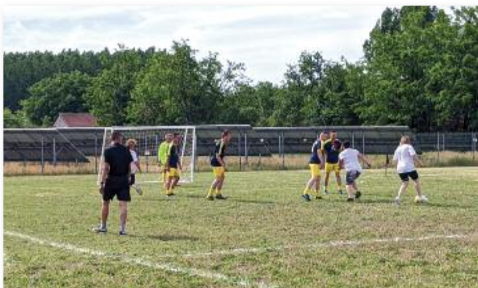
Az idei Pünkösdi kupán 5 csapat szállt versenybe

Köszönjük szépen mindazoknak, akik hozzájárultak a rendezvény sikeres megvalósításához és azoknak is, akik a nap folyamán kilátogattak és a nagy meleg ellenére is együtt szurkoltak velünk a résztvevő csapatoknak.