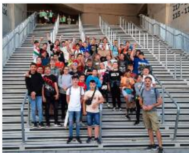
A lelkes szurkolótábor

Az interaktív játsszóház célja, hogy a megidézett kort játékos, játsszó tanulós módon ismertesse meg a gyerekekkel. A történelmi játsszó feledhetetlen szórakozást, élményt nyújtottak mindenki számára, s általa a jász identitást erősítette meg a résztvevőkben.