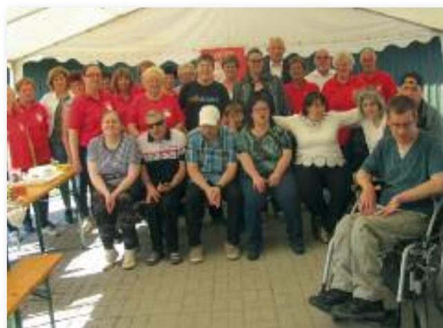
A program résztvevői és a szervezők