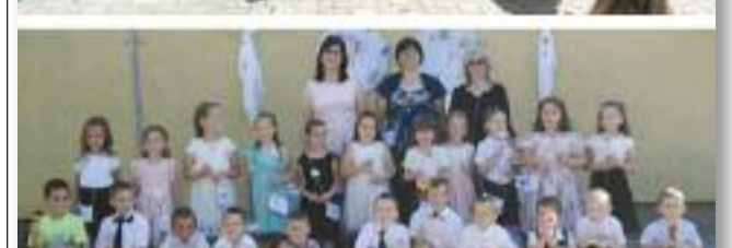
Búcsú az óvodától és a szeretett óvó néniktől

Ebben az évben öt csoportban is voltak ballagó kisgyermekek. A Lehel úti óvodából a Mókus csoport minden tagja, míg a Mackó csoportból és a Katica csoportból a nagyobbak vettek búcsút. A Dobó úti óvodában pedig a Halacska és Csicsergő csoportos nagyobb gyerekek búcsúztak kedves óvodájuktól.