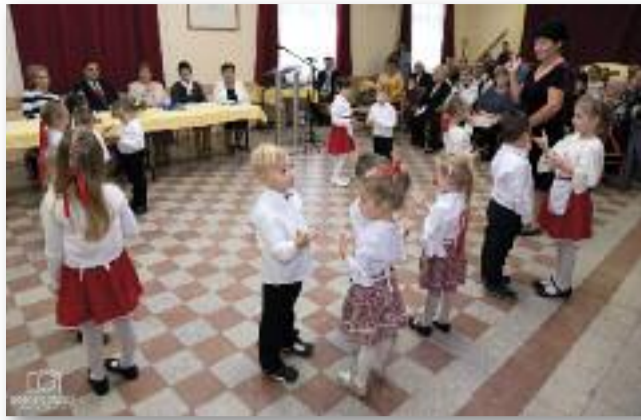
Az óvodások műsora