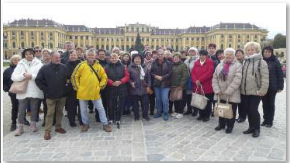
Kirándulók a császárvárosban

az egykori magyar főváros, Pozsony volt az úti cél. Helyi idegenvezető kalauzolt el minket a jelentősebb épületekhez, melyek a magyar történelem számos fordulópontjának helyszínei. Az impozáns Prímáspalota tükörméiben írta alá Haynau a szabadságharc főtisztjeinek halálos ítéletét. A Mihálykapun átvezető utat arany koronák díszítik, utalva arra, hogy Pozsony koronázó város volt. A díszes Szent Márton-dómban tizenegy