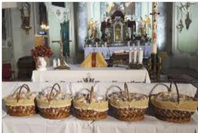
A megszentelt zsömlék

Szent Erzsébet példáját követve végzi a helyi Szent Erzsébet Karitászcsoport segítő tevékenységét a rászorultak megsegítésére. A szentmisén röviden ismer-