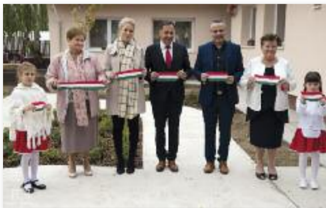
A jubileumi ünnepség meghívott vendégei