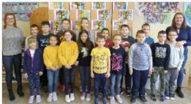
A 3. évfolyam nyertesei és felkészítőik

Október 14-én 24 csapat matematikai ismereteikből mérte össze tudását iskolánk osztálytermeiben.