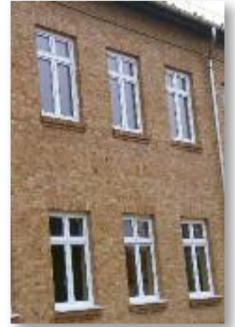
A gimnázium új ablakai

A november eleji hosszú hétvégén lezajlott az ablakcsere a gimnázium emeletén. A munkálatok öt tantermet és két egyéb helyiséget érintettek. A régi ablakok már olyan mértékben elvetemedtek, hogy kinyitásuk és becsukásuk is nehézkes volt, hőszigetelő képességük is nagymértékben lecsökkent. Az átalakítás után az épület melegebb és biztonságosabb lett, és jövőre megújult külsővel várhatja építésének századik évfordulóját. A felújítást Jászárokszállás Város Önkormányzata finanszírozta 7,4