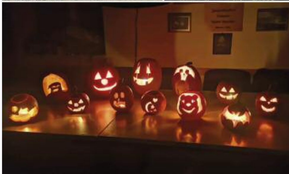
A felnőtt tűzoltóknak 6 riasztással, az ifjúság számára tökfáragással telt az október

kereszteződésében Jászárokszálláson. A kivonuló egység áramtalanította a járműveket és biztosította a helyszínt. Súlyos személyi sérülés nem történt. Ezen a napon épp ifjúsági képzésünk zajlott, aminek a végén érkezett a riasztás. Így az ifi tűzoltóink „testközelből” átélhették az éles riasztás néhány percét.