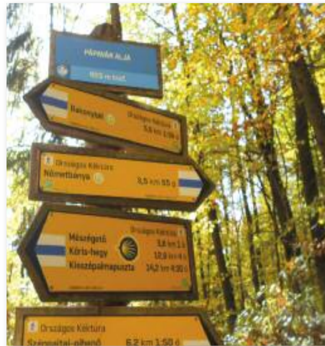
Útban Városlőd felé

közeledve, az aluljáró alatt átjutva érünk be Városlődre. Pecsételni a helyi "kulturális intézményben" (kocsma) tudunk, ahol a törzsvendégek bátorító és biztató tekintete követ bennünket.