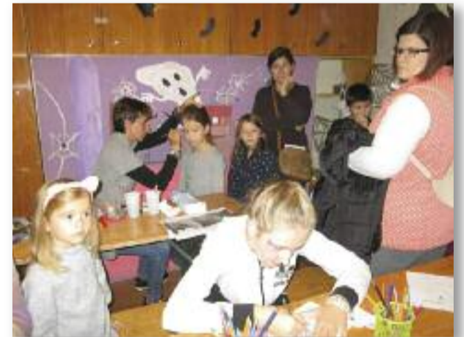
A rémségek házában kézműveskedéssel várták a gyerekeket

„Nagyon jó és vidám délutánt tölthettünk el az ÁllatbarátkoZoo jóvoltából. Volt itt minden: szelleműzés, boszorkányriogatás, zombi