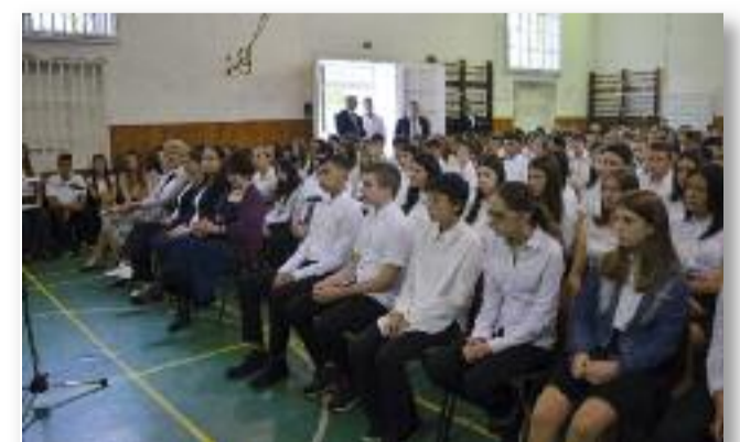
Az új tanév több változást is hoz a diákoknak

A tanévnnyitó ajándékozásal zárult: a kilencedikeseket a tizedikesek köszöntötték egy-egy tábla csokoládéval, hogy megédesítsék számukra a tanévkezdést.