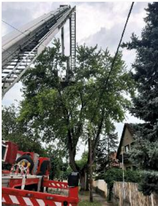
A szél és a vihar augusztusban is több munkát adott tűzoltóinknak

Térségünkben – a cikk írásakor - tűzgyújtási tilalom van érvényben. (www.katasztrofavedelem.hu vagy http://erdotuz.hu) Tájékoztatjuk továbbá a lakosságot, hogy a helyi égetési rendeletet és az országos tűzgyújtási szabályokat is figyelembe kell venni, ha valaki égetni szeretne.