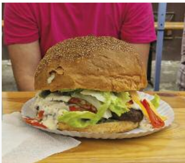
1500 grammos burgert kellett elfogyasztania a versenyzőknek

Ezt követően a szurkolókat éjfélig tartó zenés buli várta.