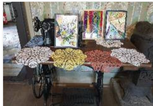
Az Ügyeskező Angyalok kézműves kiállítása színesítette a programot

kek vására várta a vendégeket. Kötött és horgolt játékgépek, gyögyteák, szappa-