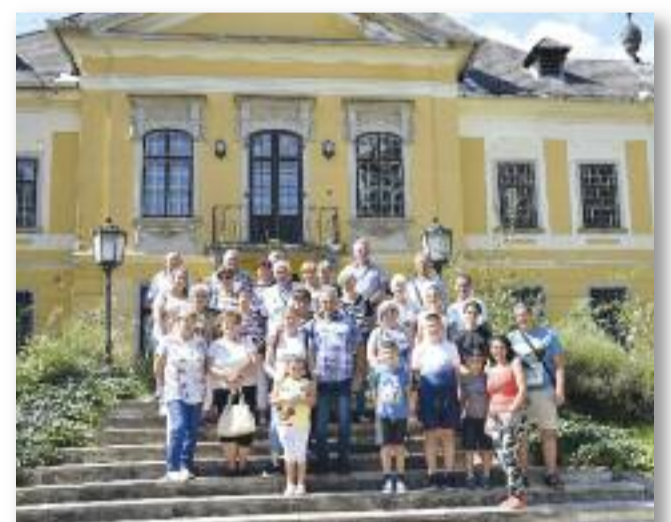
A noszvaji kastély kertjében

A noszvaji kastélyban közel egy órát töltöttünk. Örömmel hallgattuk az idegenvezető barokk stílusú dalokkal tarkított előadását. A kastély parkjában egy rövid sétára is volt lehetőségünk.