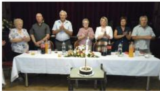
A születésnaphoz a torta is elengedhetetlen volt

Ezután a finom ebéd következett, amit a Buffalo kolléktívája szolgált fel. Guba