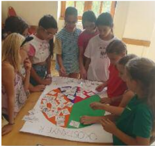
Az ötödikes tanulók az okostányér fogalmával ismerkedhettek meg

A bőrgyógyászati szűrővizsgálatra volt a legnagyobb igény, a megadott időpontok nagyon gyorsan beteltek. Megkérdeztük a doktornőt, tudna-e más alkalommal is itt Jászárokszálláson lakossági szűrést vállalni, de sajnos a leterheltsége miatt nincs lehetősége. Akiknek nem sikerült a szűrésre időpontot kapni, és