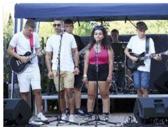
A Talking Strings együttes és vendégénekesek koncertje

Ezúton is köszönjük fáradhatatlan munkájukat! Az udvaron kézműves termé-