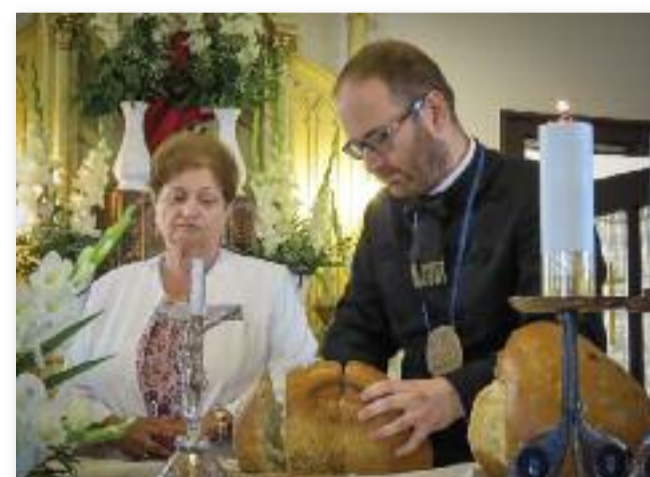
A falunap ünnepi szentmisével és kenyérszenteléssel vette kezdetét

kedvelők is megtalálhatták a kedvükre valót. Ezzel párhuzamosan pálinkamustra is megrendezésre került, ahol a Jászágó pálinkája