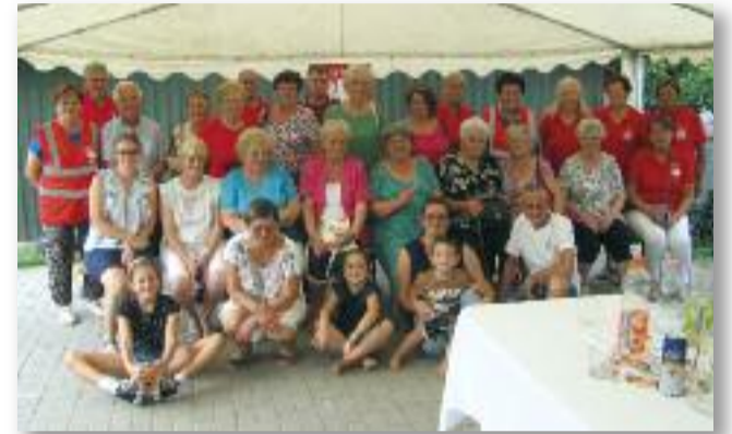
Szívélyes vendéglátás a karitászcsoport tagjaitól

mutatta ékességeit, a csodaszép festményeket, díszítéseket. A legmeghatóbb számunkra talán az volt, mikor kiemelte a jász összefogást, a dolgoz, szorgalmas jász