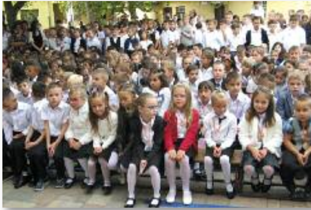
Iskolánk új reménysegei