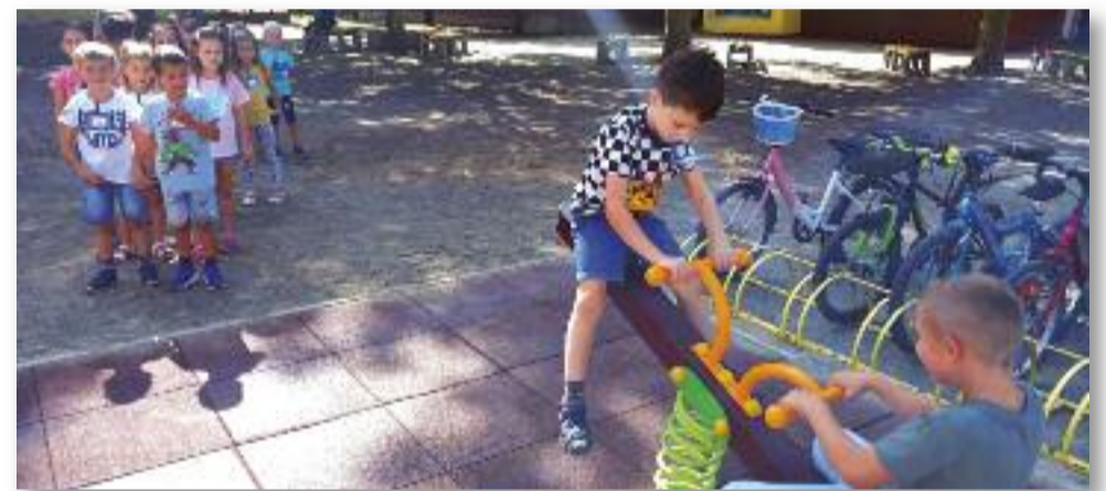
Az idei tanévben új játék fogadta a kicsiket

- A libikókák felszerelésénél is kaptunk segítséget. A tankerület intézkedett a beton-alap elkészítésében, valamint a szegélykövezés és a gumilapozás is az ő érdemük. Emellett a Dóka Tüzép felajánlott egy teherautónyi kavicsot a libikókák körüli terület kialakításához. Innen is köszönjük nekik a segítséget és a felajánlást! Fontosnak véljük, hogy városunkat segítsük az innovációban, valamint változatos programjainkkal