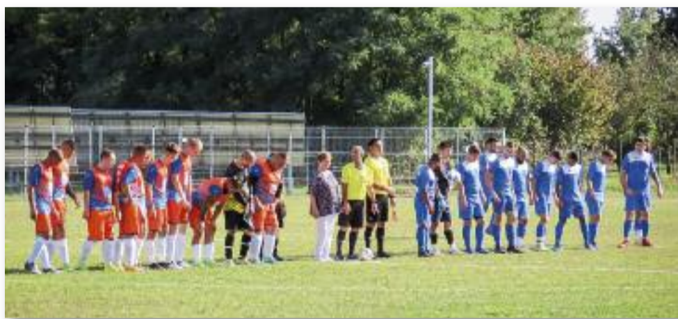
13 év után az első mérkőzés: Jászágó-Jászkisér

Továbbra is várunk mindenkit szeretettel, hogy biztassák csapatunkat a hazai