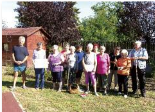
Őszi munkálatok az óvodában

Soros összejövetelünket november 8-án 15 órakor tartjuk a művelődési házban.