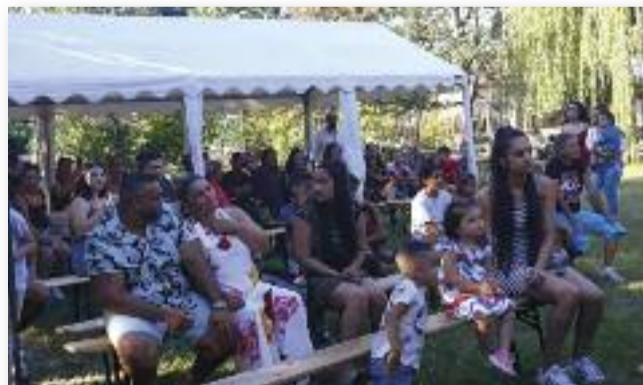
A főzőverseny mellett kulturális programok is megrendezésre kerültek

zők részvételével. Ez a nap a helyi emberek közös, békés szórakozása jegyében, a példamutatás értékével, az öszszefogás erejével telt el, amiért köszönet jár városunk ve-