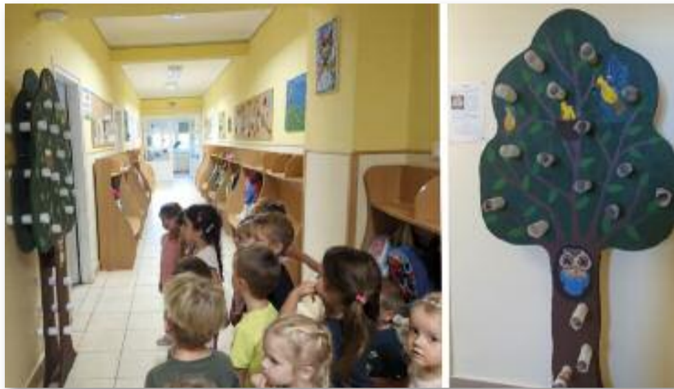
A mese az érzelmi intelligencia fejlesztésének legfontosabb eszköze