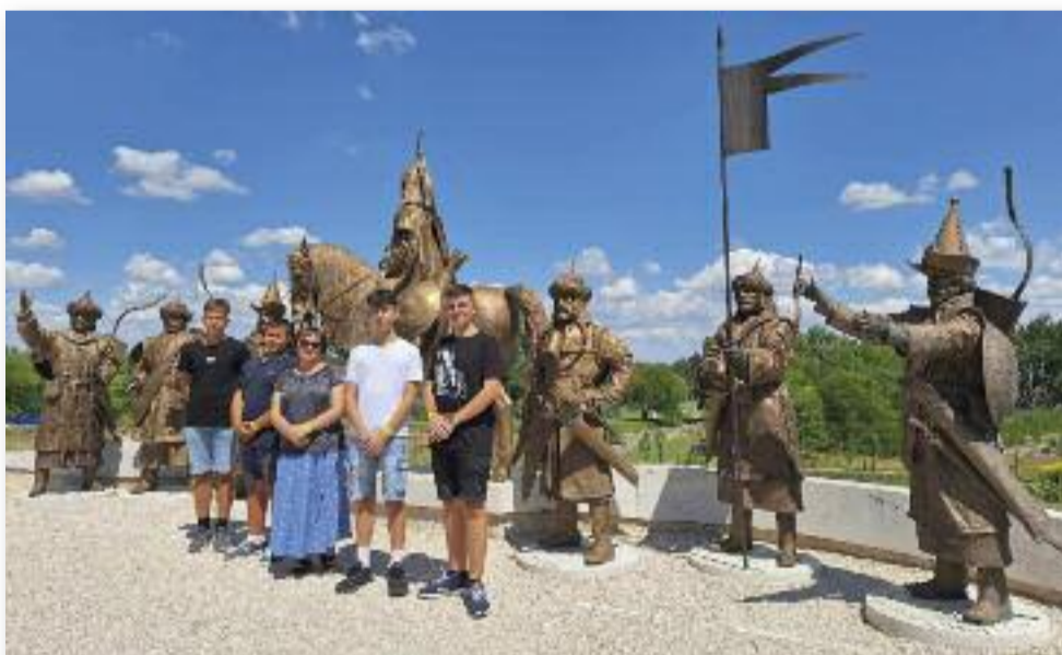
A nyertesek az ősök nyomában

Ezek az élmények több ember összefogásával váltak teljessé. Köszönjük vitéz Ba-