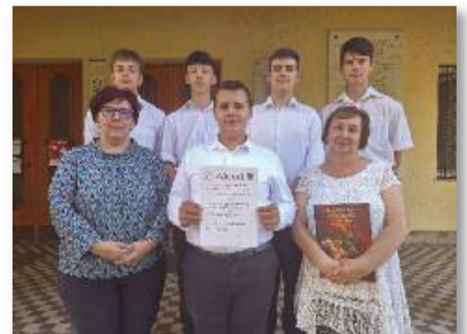
A hősök és segítő tanáraik

Itt rengeteg tartalmas programon vehettünk részt. Meg-