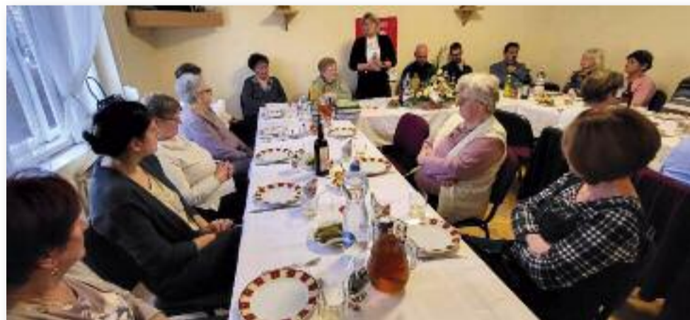
A karitászcsoport 2023-as évvégi ünnepsége

Köszönetünket fejezzük ki a helyi és visznaki iskola igazgatóságának, tantestületének, az óvónőknek, hogy a gyermekeket elhozták a két-napos betlehemi játék megtekintésére és mi megajándékoztuk kártyanaptárral és