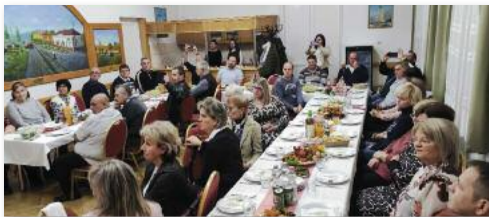
41 fő vehetett át elismerést