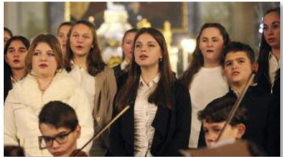
A Széchenyi István Általános Iskola és AMI karácsonyi koncertje