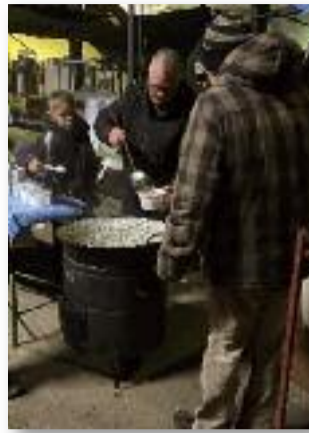
A 200 adag étel hamar elfogyott

A hangulatos beszélgetések mellett szinte mind a 200 porció étel elfogyott, a vacsora végére a két kondér alján szinte semmi sem maradt. A sok pozitív visszajelzés és kellemes hangulat megalapozta a karácsonyi ünnepekre hangolódást, és közelebb hozta városunk lakóit egymáshoz.