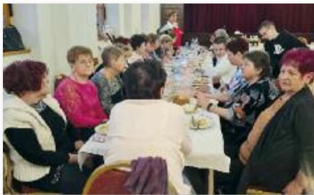
Januári tisztújító gyűlés

SZÖVEG: NÁDAS ILLÉS