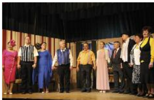
A remek szereposztás

Az előadást december 10-én, valamint január második hétfőjén is megtekinthette a nagyrémű, de aki most kapott kedvet ehhez a humoros előadáshoz, még márciusban is lehetősége lesz megnézni a színkör darabját.