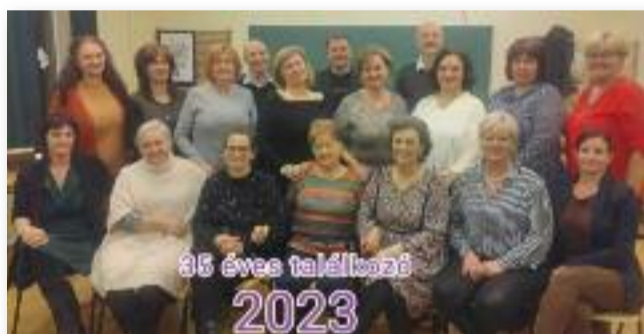
35 éve hangzott fel utoljára a csengő

Jó volt hallgatni, kivel mi történt azóta, hogyan alakult az élete. Azt megállapítottuk, hogy jó alapokat kaptunk, amire a továbbiakban építhettünk. Ennek köszönhetően mindenki megtalálta az életben a helyét. Rengeteg tudással, élmenyvel gazdagon indulunk el az életbe innen, 35 éve. A beszélgetésben előkerültek a régi szép napok emlékei: osztálykirándulá-