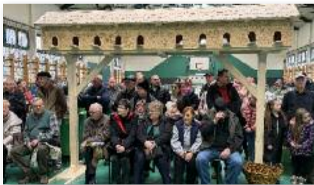
49 kiállító és sok érdeklődő vett részt a kiállításon

Január elején immár hagyomány, hogy a Csörsz Vezér Galamb és Kisállattenyésztők Egyesülete programot ajánl a kisállatok kedvelőinek. Ezúttal sem volt ez másképp.