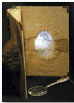
Dióba zárt gondolatok

A kiállítás február 8-ig tekinthető meg.