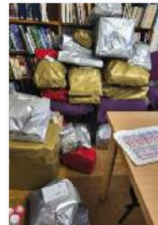
Közel 150 gyermek kapott ajándékot az angyaloktól

gyalok tudták, hová kell menni. A Városi Könyvtárban csomagoló angyalok