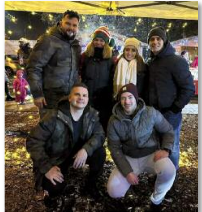
Az Ifjúsági Tanács tagjai a lelkes segítőikkel

#pohárest #fiatalok #együtt #jászárokszállás #ünnepek