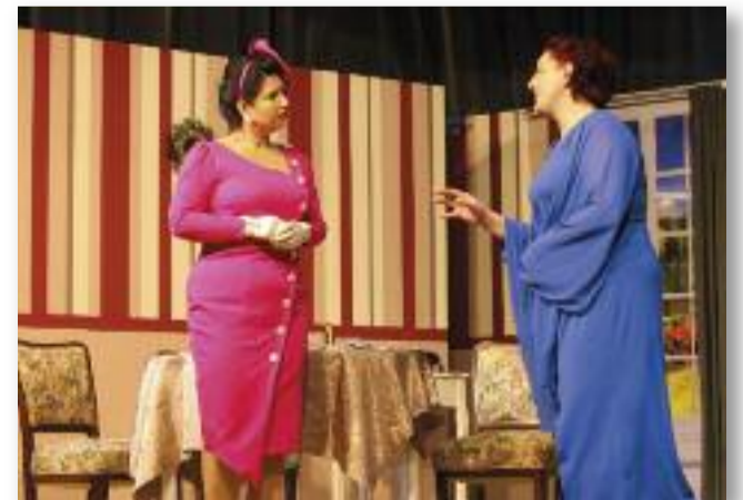
A feleség bármit megtenne, hogy férje hű maradjon hozzá