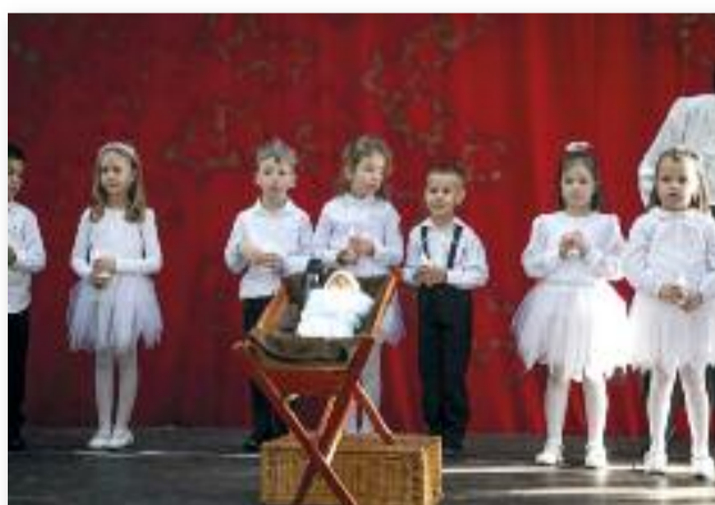
A Dobó úti óvodások műsora

Városunk önkormányzata és képviselő-testülete 2023-ban is megrendezte az Idősek karácsonyát, mellyel az ünnepre való várakozást tette hangulatosabbá.