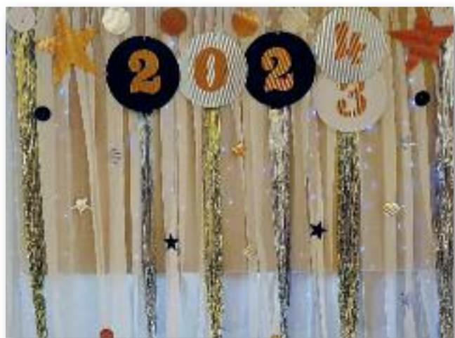
130 fő ünnepelte együtt az új év kezdetét

A Penny Markettel szemben található parkolóban lehetőség volt megsodálni a meglepetés tűzijátékot is. A mulatság hajnali négyig tartott, a visszajelzések alapján mindenki remekül érezte magát az este folyamán.