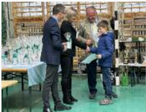
A legjobb madáretető készítőket díjjal jutalmazták

Szintén hagyomány, hogy a gyerekeket is próbáljuk „megfertőzni” a kisállatok szeretetével, hisz kell az utánpótlás, mert valljuk be, itt is korosodik a társaság. Ezúttal 2. alkalommal madáretető készítését, majd azok kiállítását