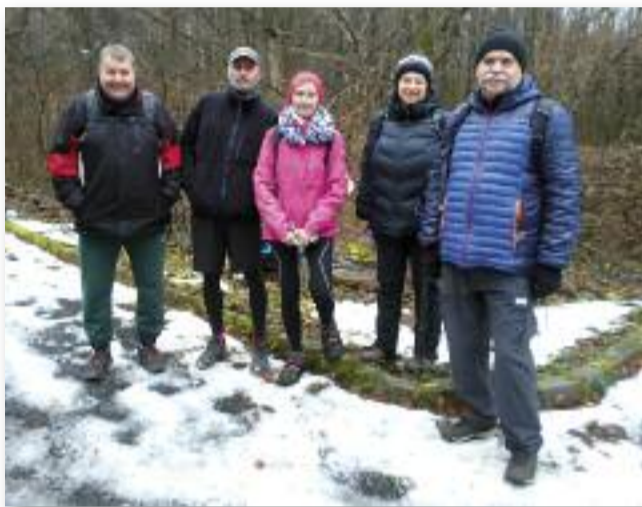
A szilveszteri túra résztvevői

Összegezve a tavalyi évet: közel 800 km-t tettem meg gyalog, az ország különböző tájegységein át. Ebből több mint 300 km-t a Kéktúrán barangoltam.