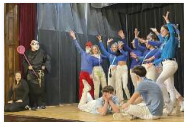
A 11. B műsora