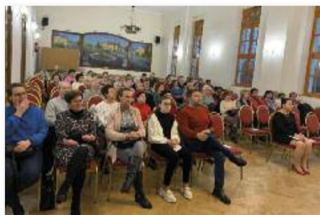
Egy fontos témát érintő, interaktív előadás

boldogabb, az mennyire pozitív hatással van a pszichés állapotunkra. Közben pedig a világ talán egyik „legcsú-