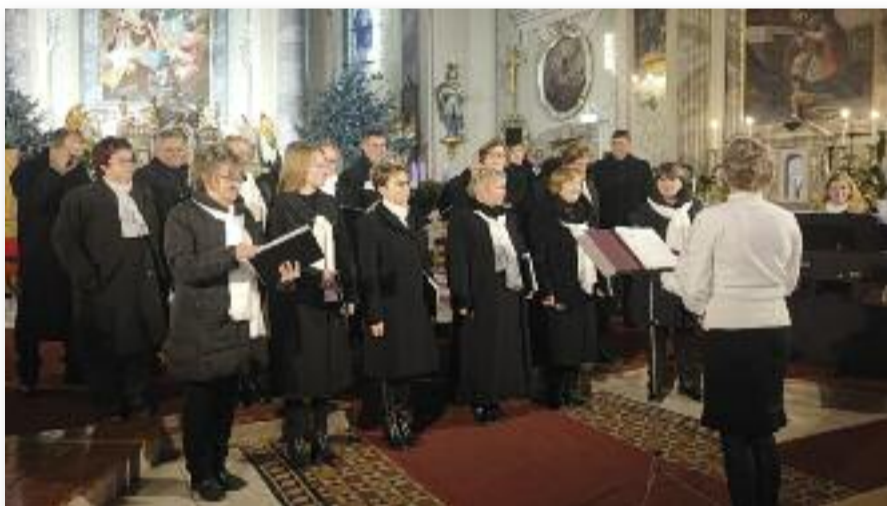
Déryné Vegyeskar karácsonyi koncertje