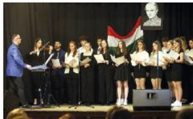
A gimnázium tanulóinak műsora

Több évtizede pedagógusként ő maga is részt vesz különböző kulturális műsorok készítésében, így saját tapasztalatból tudja, hogy a di-