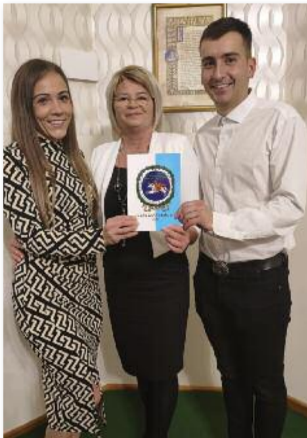
Szerző Dorina és Lengyel Ármin publikációja is megjelent a kiadványban

SZÖVEG: NAGY KINGA