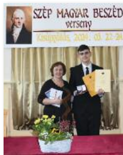
A Kazinczy-jelvény birtokában

Ezután a verseny első része következett, a szabadon választott szöveg felolvasása. Ez a versenyrész abból állt, hogy a versenyzők az otthonról hozott, begyakorolt szövegeiket olvasták fel a