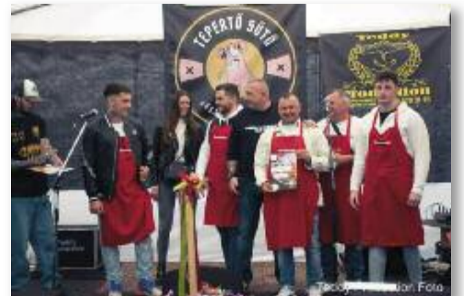
Tepertősütés, pálinkamustra, jó hangulat

maradtak éhesek. Kézműves vásárral és felejthetetlen hangulattal fogadtunk mindenkit. A gyerekek is találtak maguknak szórakozást,