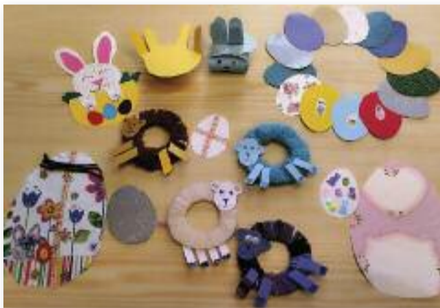
Sok szép alkotás készült a gyerekek keze által

A közelgő húsvét adta a március havi kreatív foglalkozás témáját.