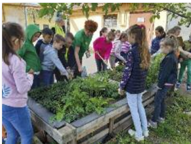
Növényismertetés és -ültetés az alsó tagozatos diákokkal

Soron következő összejövetelünk május 8-án, délután 4 órakor lesz.