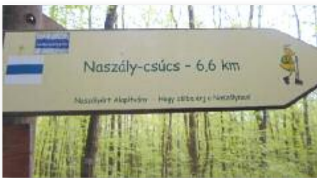
Amikor ilyen messze van a csúcs

Már ezekért a csodákért is érdemes egy-egy kirándulást szervezni, hogy részesei lehessünk a felfedezés élményének. Bakancsot fel, zsákokat a hátra és induljunk el új utakra!