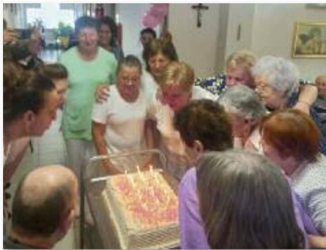
A 20. születésnapról a torta sem hiányozhatott

A Bentlakásos Idősek Otthona Apartmanház 2004. április 1-jén nyitotta meg kapuit a lakók előtt. Az intézményről elmondható, hogy emelt-szintű szakosított ellátást nyújt, mely magában foglalja az ápolást, gondozást, fizikai ellátást, egészségügyi ellátást, mentálhigiénés ellátást és foglalkoztatást. Az intézményben