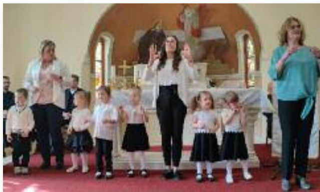
Az egyházi óvoda gyermekeinek műsora