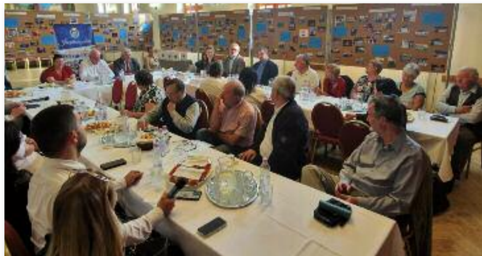
Konzultáció a civil közösségi tevékenységeket érintő aktualitásokról

désekkel fordulhattak a meghívott vendégekhez, hiszen a fórum célja, hogy személyes találkozókon konzultálhassanak egymással a civil közösségi tevékenységeket érintő aktualitásokról, a civil szféra fejlesztésének lehetőségeiről.