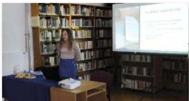
Egy helytörténeti érdekességről hallhattunk érdekes előadást

A rendkívül érdekes és tartalmas előadás beszélgetéssel és megvendégeléssel zárult, de lehetőség volt a Jászsági Évkönyv megvásárlására is. Köszönjük mindenkinek, aki velünk töltötte a péntek délutánt, minden kedves érdeklődőt szeretettel várunk további rendezvényeinkre is!