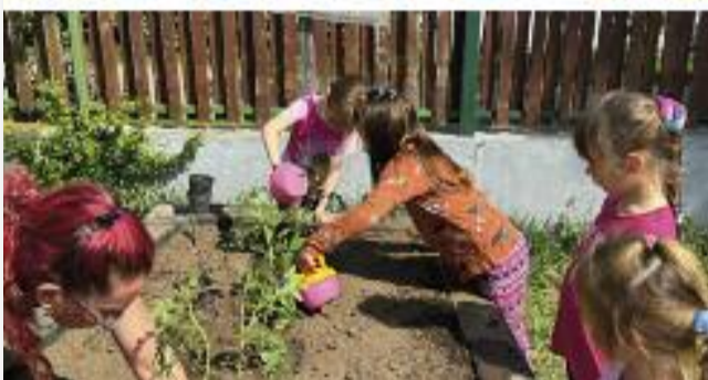
A kertészkedés örömei

vidám előadást láthattunk, hallhattunk a művelődési házban. A gyerekek már ismerősként köszöntötték a zeneiskolai pedagógusokat és a nem is olyan régen még óvodás gyerekeket. Örülünk, hogy az óvodai zenei