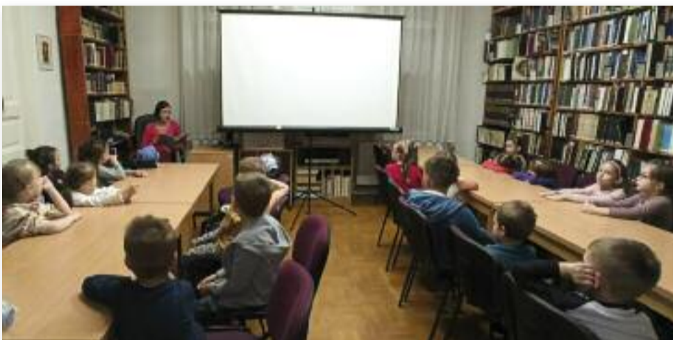
A Cica csoport látogatása a Városi Könyvtárban

alkalommal rendeztük meg a beiratkozás előtti kétnapos programunkat, ahol a leendő óvodásainkat és kedves szüleiket, családjukat vártuk. Az első napon szülői értekezletre hívtuk az óvodába készülő kisgyermek szüleit, majd másnap játékos délelőttre nyitottuk ki az óvodák kapuit, hogy szülők és gyerekek együtt láto-gathassanak el hozzánk.