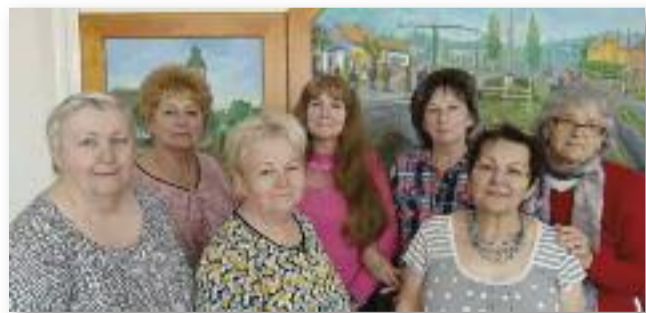
Az Ügyeskező Angyalok Klub állandó tagjai

Sokat olvashattunk, hallhattunk már a szabadidős tevékenységek fontosságáról, hiszen egy fizikailag vagy szellemileg fárasztó munkanap után, jóleső érzés önmagunkra és az általunk választott hobbira koncentrálni, főleg, ha közben egy jó társaságban lehetünk és szinte a semmiből, csodálatos alkotásokat készíthetünk.