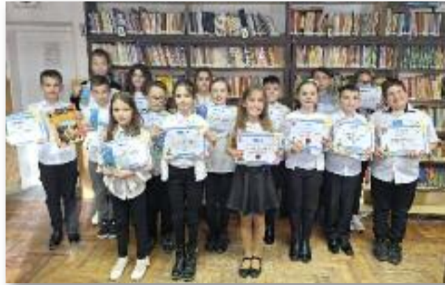
Aranyszáj verseny résztvevői