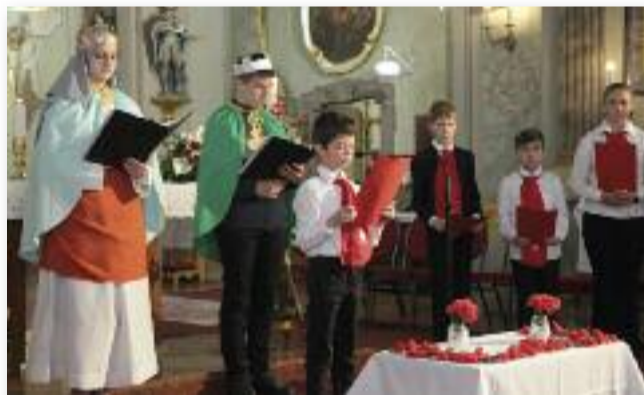
Szent Erzsébet példaeértékű életének bemutatása