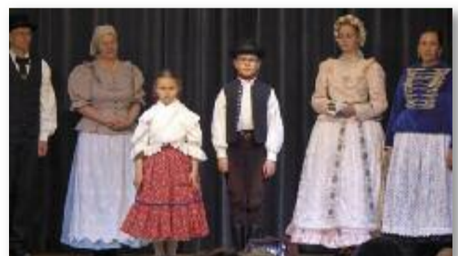
Mit viseltek őseink? Jászszági viseletbemutató