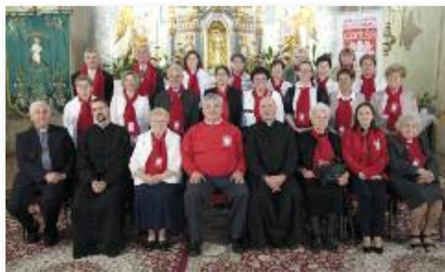
A csoporttagok és lelki vezetőik

rászorulóknak életszínvonalát, többek között ruhagyűjtéssel és -osztással, tartósélelmiszer-osztással, ANGYALBA-