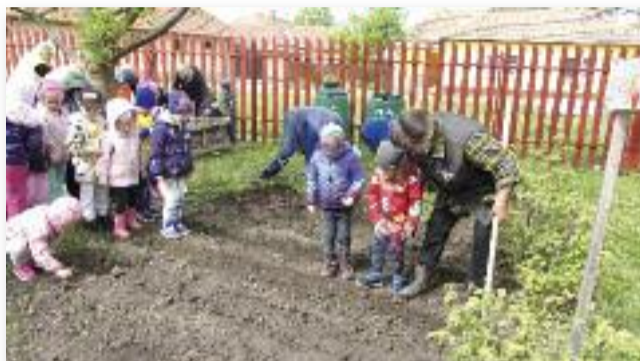
Az óvodások a borsóültetést élvezték a legjobban

Készülünk „A legszebb konyhakertek” - Magyarország legszebb konyhakertjei