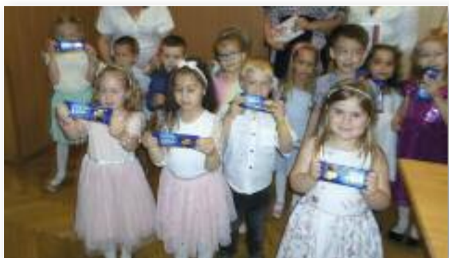
A Lehet úti óvoda gyermekei adták anyák napi műsort

1-ig lehet 500,-Ft hozzájárulás befizetésével a kapcsolattartóknál. Mindenki hozzon magával tányérral, evőeszközzel és poharral.