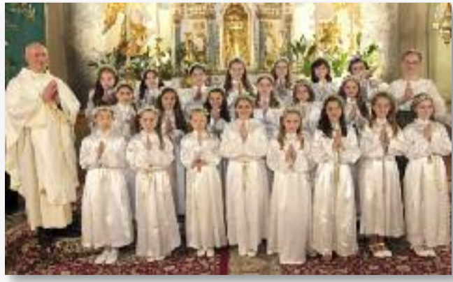
Az első szentáldozásra felkészült gyermekek