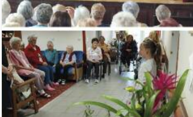
A gyerekek szeretettel adták elő anyák napi műsorukat az időseknek

dogan ölelték magukhoz kisgyermeküket, unokáikat.