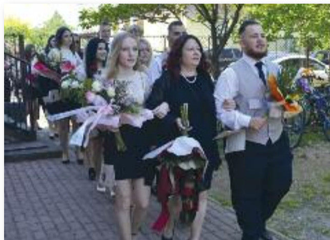
12. A osztály