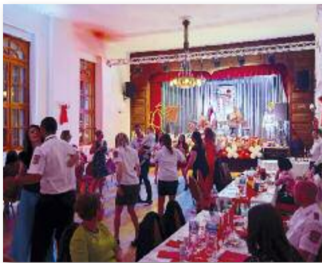
Közel 100 fő mulatott az első jótékony-sági tűzoltó bálon

Számos helyi és környékbeli magánszemélyt, illetve vállalkozást hívtunk meg a bálunkra, valamint kerestünk meg, hogy egyéni felajánlásával támogasson bennünket. Örömmel mondhatjuk, hogy ez sikerült, hiszen rengeteg tombolafelajánlást és anyagi támogatást kaptunk. A bál végén a támoga-