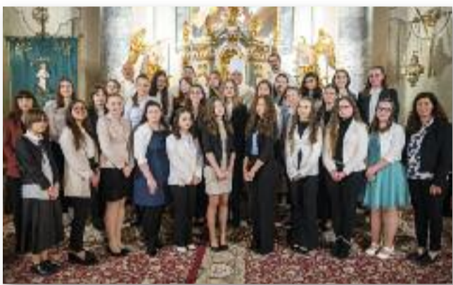
55 fő kérte a bérmálkozás szentségét

A mise végén megköszöntük az ünnepi szertartást és hálánkat fejeztük ki, hogy részesülhettünk a bérmálás szentségében. Minden bérmálkozó bérmálási emléklapot, szentképet és egy könyvet kapott ajándékba, amiben arról az életről olvashatunk, amit a kereszténység és a bérmálás kegyelmében élhetünk. Hálásan köszönjük!