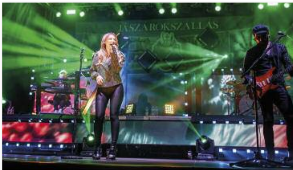
„Egyszer majd úgyis hazatalálsz...”

tánc- és sportcsoportok műsora. Színpadra léptek a Csillag Mazsorett Csoport, a Fortuna TSE, a Judit Zumba, valamint a Dance Lit Hip-