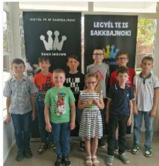
A verseny résztvevői

Ez a verseny több volt, mint csak verseny, játék. Itt barátságok kötődtek, ismereteket, ötleteket gyűjthettek egymástól a verseny résztvevői. A verseny elején és a szünetekben is megfigyelhető volt, hogy a gyerekek örömmel üdvözölték ismerőseiket, beszélgettek egymással. A szünetekben megvitatták a jó és kevésbé eredményes döntéseiket, ki mivel nyert, kinek milyen fortélyai voltak. Ötleteket kaphattak Mészáros Ádám könyveiből is, melyet a szerzőtől lehetett megvásárolni és a legeredményesebb versenyzőknek saját