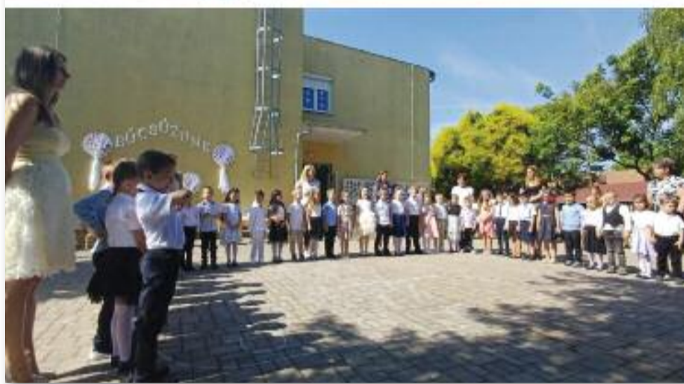
95 gyermek vett búcsút az óvodától