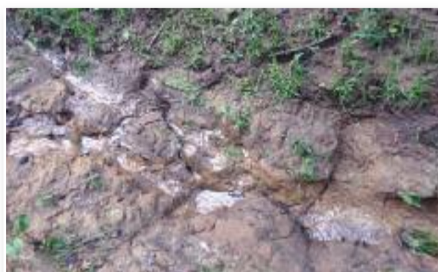
Közel 19 km teljesen saras útszakasz

A legutóbbi kéktúránk igen emlékezetes marad. A közel 20 km alatt a sár minden formáját kipróbáltuk. Azt tudtuk, hogy az előző napok esőzése nyomot hagy a természetben, de azért erre nem készülünk fel.