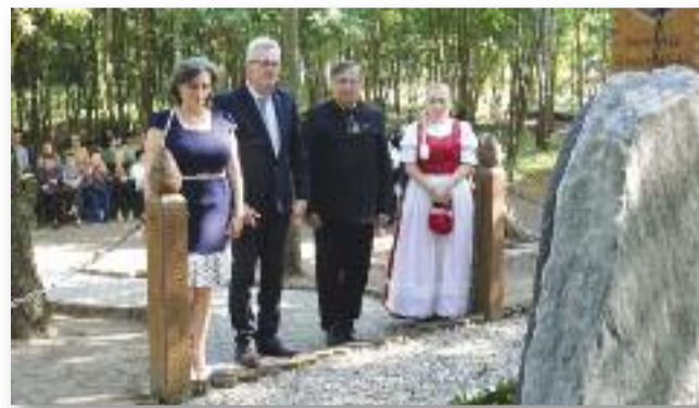
A településünket képviselő delegáció koszorúzése

követően termelészövetkezethez került, ma magánkézben van. A kúria körüli erdőt kivágták, akácvadócok verték fel a földet. A rendszerváltást és termelészövetkezetek feloszlását követően a terület önkor-