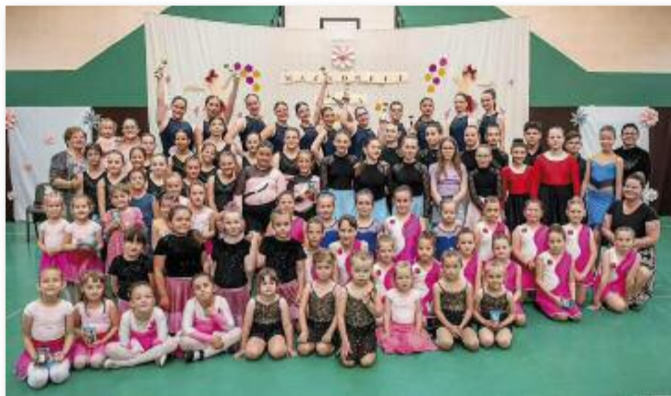
119 táncos mutatta meg tudását az este folyamán

A fináléban minden táncos felvonult és sor került az év végi jutalmak kiosztására, melyet a gyerekek boldogan vettek át az edzőiktől.