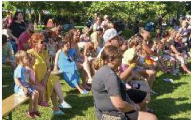
A gyermekek mellett felnőttek is örömmel vettek részt a programokon

rikába is beléphetek, mely napjainkra már egy közkedvelt játékká szelődött – ennek ellenére csak a legbátrabbaknak ajánlott. A sok mozgás után jólesett a gyermekek számára, hogy szuperhőssé válhattak vagy épp kedvenc állatukat viselhették magukon, kö-