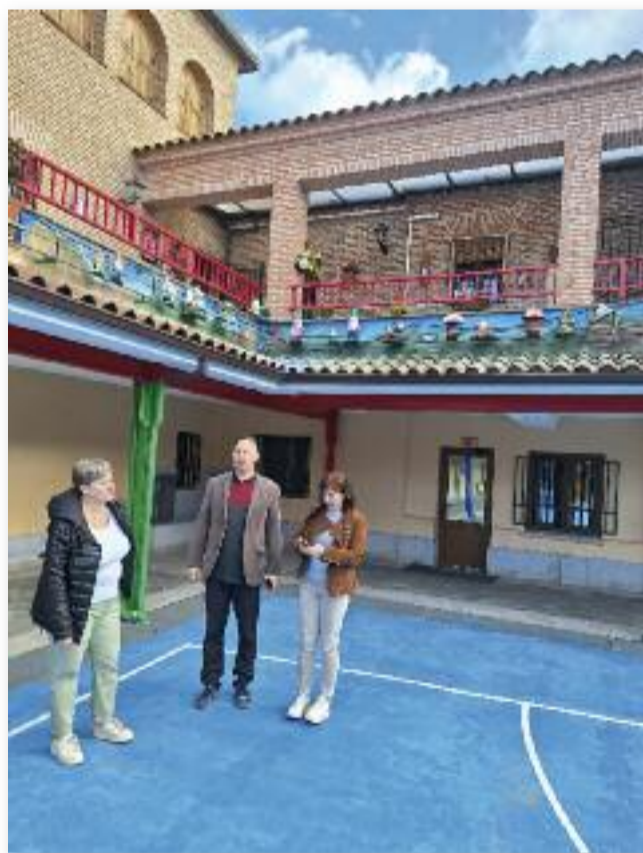
A Colegio San José iskolaudvarán

Az itt töltött hét számtalan tanulságot, élményt nyújtott számunkra. Az intézmény vezetésének diákokhoz, családokhoz való támogató hozzáállása, a pedagógusok mentalitása, az iskola felszereltsége mind iránymutató lehet számunkra.