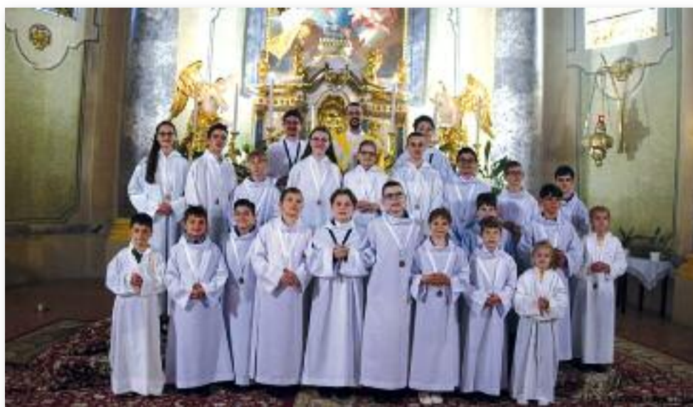
Immár 23 fő látja el szívesen a ministránsi teendőket a szentmiséken