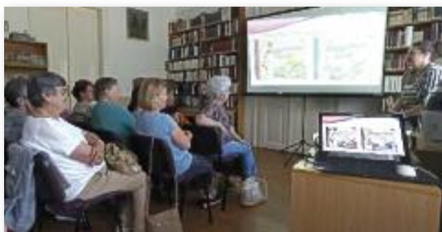
Könyvtárunkban az előadást nagy érdeklődés övezte

élők. Örökölt sorsunk lehet pozitív is (hitek, értékek). A mentálhigiénikus a gyermekkorunkból ismert kelj-feljancsi játékot hozta fel példaként, tehát aki ismeri családtörténetét, azzal gyökereit ápolja, tiszteli és egyúttal reziliensebbé (ön-