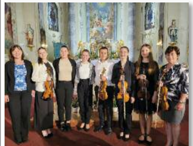
Alapvizsgázó tanulóink és tanáraik

Újdonságot jelentett az utolsó nap, amelyet egy 12 fős óvodás csoportban kezdtünk, ahol a 3 éves gyerekek játékos formában,