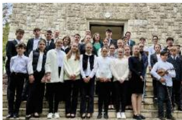
A zenei tábor résztvevői

Köszönjük tanárainknak a tábor megszervezését és ezt a csodálatos három napot.