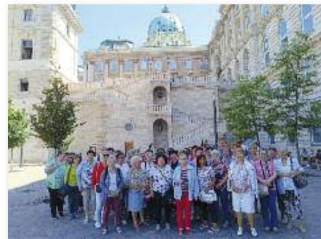
Kirándulók a Csikós-udvarban

A derűs tavaszi nap jó hangulatban telt el és mindenki új élményekkel gazdagodva tért haza. A program Magyarország Kormányának támogatásával és a Nemzeti Művelődési Intézet koordinálásában valósult meg.