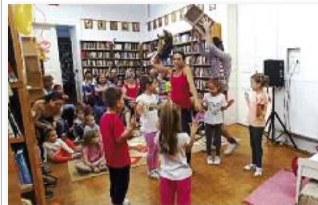
A rendezvényen garantált volt a jókedv