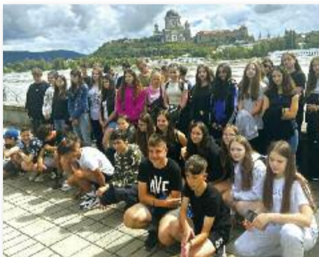
A kirándulás résztvevői

Az utolsó napon megtekintettük a gombaszögi cseppkőbarlangot és az ifjúsági tábor helyszínét, ahol a felvidéki magyar fiatalság találkozik minden évben. A kirándulásunk címét adó Völgylila című dal is elhangzott a pajtában, mely a 2022-es év rendezvényének himnusza. Lehetőségünk adódott a folkpajtában énekelni és táncolni, majd elsétáltunk a monostormaradványok mellett, az idegenvezetőnk pedig