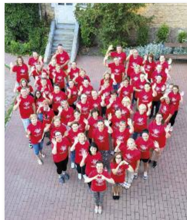
Mozgás, aktivitás, jókedv a Kihívás Napján már 2013 óta

Május utolsó szerdáját idén is a kihívásoknak szenteltük. A 28-a éjfél a gimnázium udvarában várták a résztvevők és közös futással, sétálással nyitották a rendezvényt. A nap folyamán minden korosztály megmozdult. A babakocsisok anyukájuk segítségével utaztak, a bölcsisiek már tornával indították a napot, az óvodások sétával színesítették a délelőttöt és még haltelepítésen is részt vettek. Az általános iskolások minden szünetben testnevelés negyedórát tartottak. Az idősebbek meridián tornával, örömtáncokkal színesítették a napjukat. Az Apart-