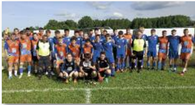
Jászágó Newergies SE Ifi és Jászárokszallás VSE U19 csapatai