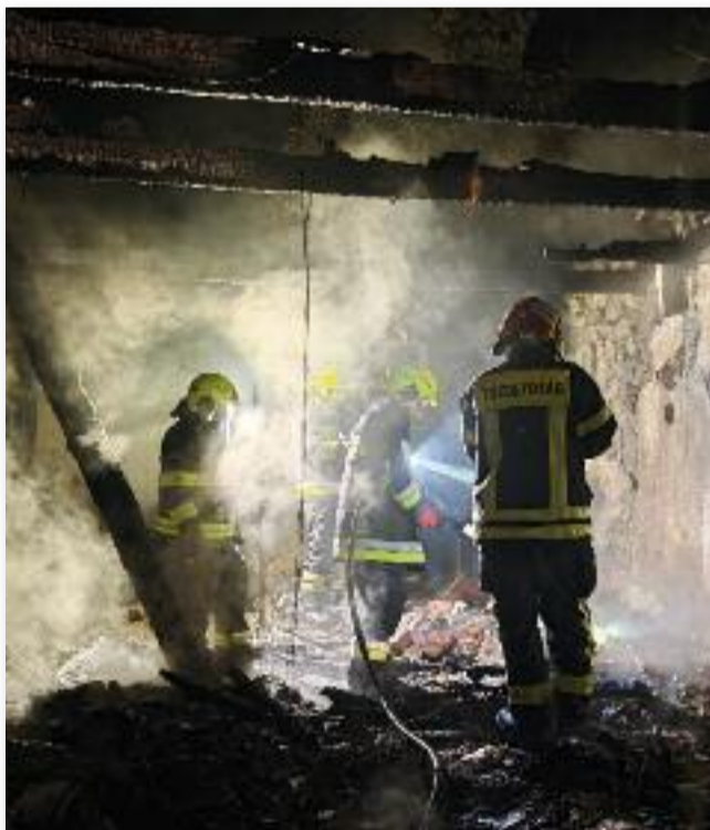
Tűzoltóink három lakóháztűz miatt vonultak Tarnaörsre

2024 májusában tűzoltó bálunk megszervezése mellett szolgáltatásunk is folyamatos volt. Összesen 13 riasztást kaptunk, amiből 3 téves jelzés volt, egyet pedig a kiérkezés előtt felszámolt a tulajdonos.