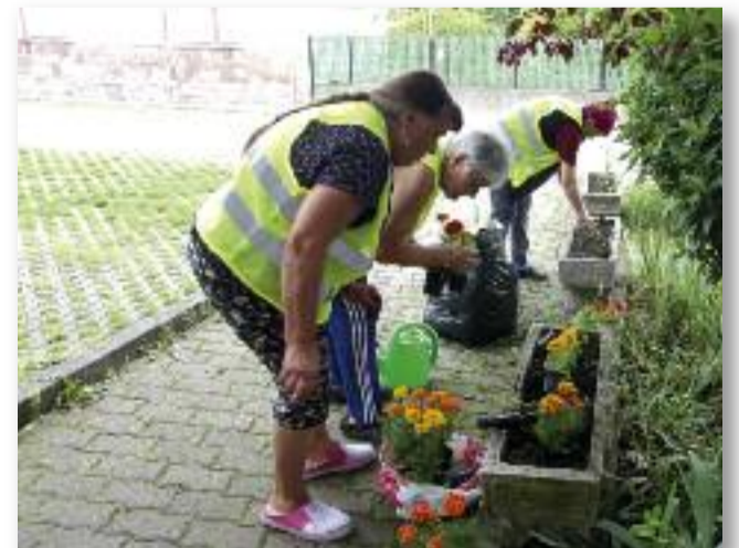
A mentőállomás előtti terület rendbetétele

Soron következő összejövetelünk július 3-án, délután 5 órakor lesz.