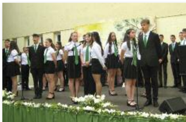
A műsor szereplői

Kicsit rekedtes volt a hangja, olykor meg-megszakadt a csengetés, ez is jelezte, búcsúznak a nyolcadikos diákjainktól. Az égen gyülekező felhők, az esőcseppek a búcsúzóknak könnycseppei voltak, melyek egy kicsit megijesztettek, de a