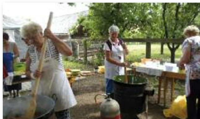
Készül az ízletes bográcsgulyás