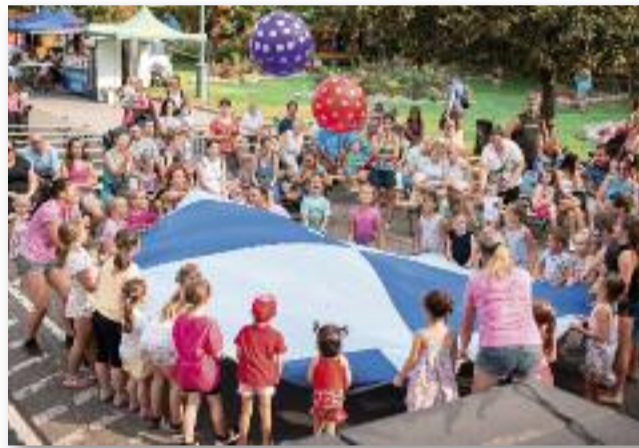
Répa Retek Mogyoró interaktív gyermekműsor