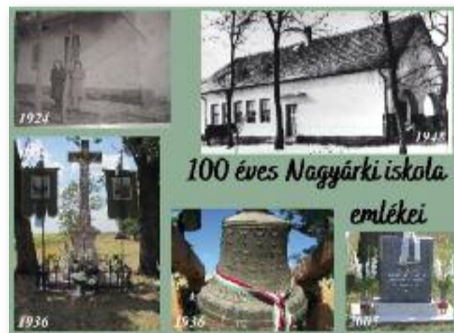
Fotóba zárt emlékek

Mindezek, beleértve a tanítást, a szentmiséket, a TSZ-be tömörítés után, 1967-ben megszűntek.