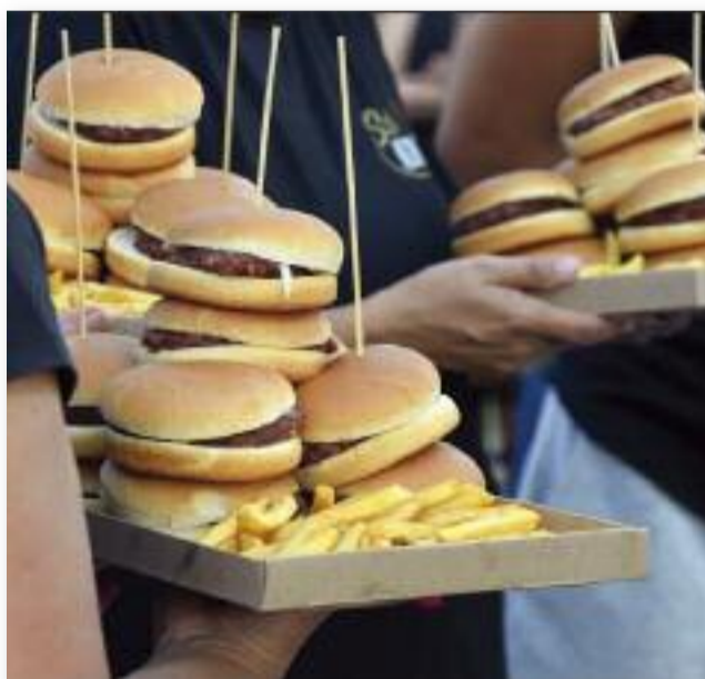
10 db hamburger és egy nagy adag sült krumpli elfogyasztása volt a feladat

tekkkel, mi a specialitásuk. A rövid technikai átállást követően, a tavalyi évhez hasonlóan településünk legfi-