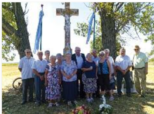
Csoportkép azokról, akik Nagyárkon jártak iskolába és részt vettek az ünnepen

A sűrűn lakottság eredménye volt, hogy a Nagyboldogasszony-napi búcsúkor hajnalig tartó mulatságot is tartottak hosszú éveken át, télen színdarabot adtak elő a fel-