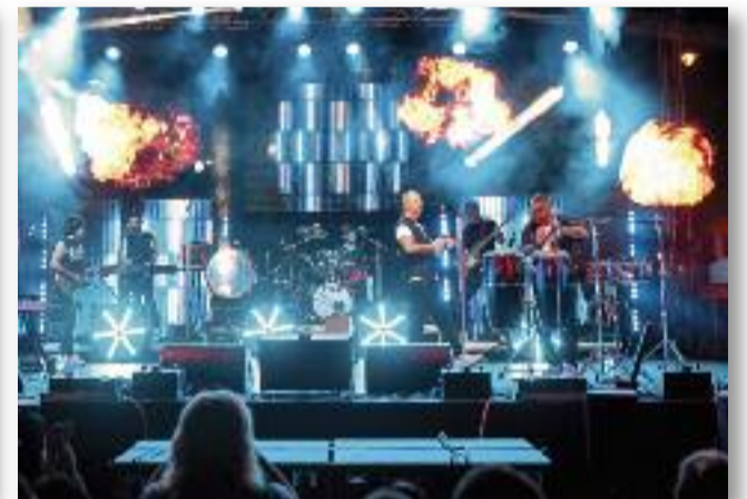
Kicsi gesztenye - TNT koncert