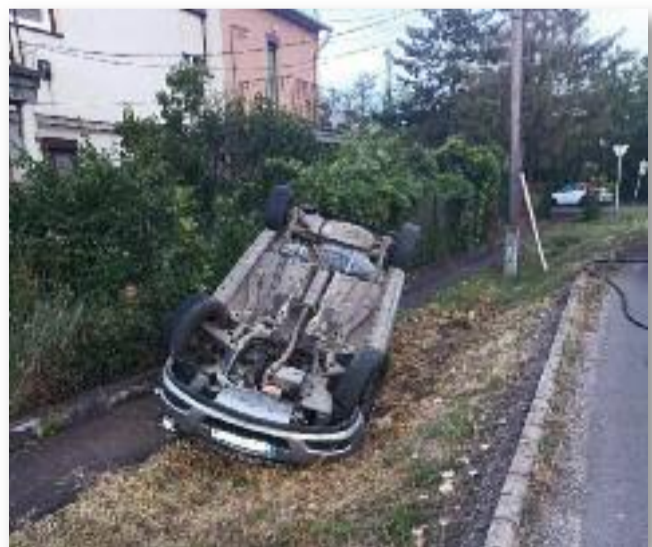
Baleset Vámosgyörk belterületén, 2024. 07. 01.

Térségünkben – a cikk írásakor – tűzgyújtási tilalom van érvényben (www.katasztrofavedelem.hu vagy http://erdotuz.hu). Azonban tájékoztatjuk a lakosságot, hogy a helyi égetési rendelet és az országos tűzgyújtási szabályokat is figyelembe kell venni, ha valaki tüzet gyújt.