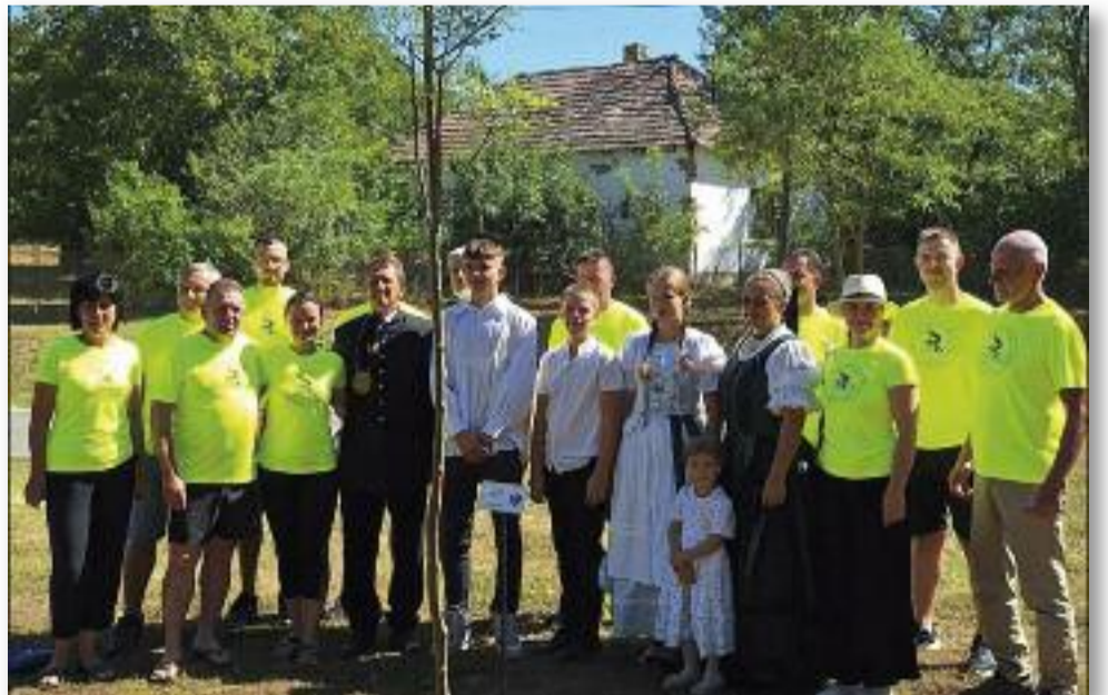
„Mert messzi út az: hazuirői – hazáig.”

A hétvége végül vasárnap hajnalban ért véget, amikor a kerékpárosok visszaindultak Jászárokszállásra, ezzel