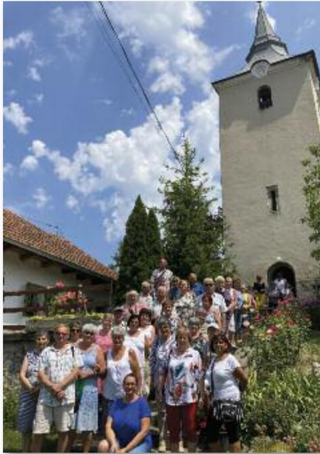
A kirándulás egyik megállója Kelemér települése volt

Mai nyelvünkön folytatva a krónikát az egykor mély árok töltésének tetejére fákat ültettek. A kapuknál örök álltak. Nem csak egy, hanem több ága is van az árokrendszernek a Duna és Tisza között. Gvadányi József hőse, a peleskei nótárius a Tiszán át-