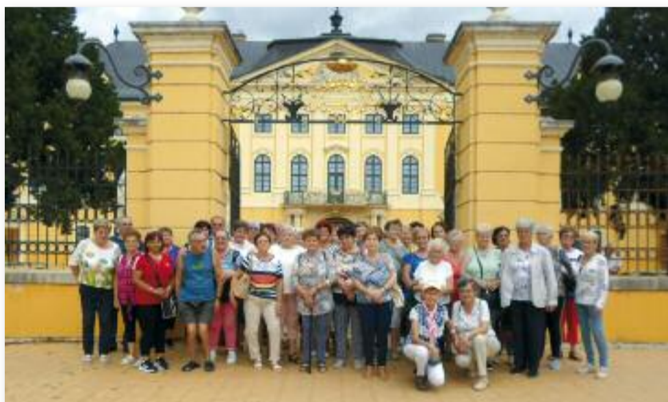
Az Érseki Palota előtt

A kalocsai asszonyok díszítőművészete legendás. Ennek hű összefoglalója a Népművészeti Tájház. Természetesen a Paprika Múzeumot sem hagyhattuk ki. Itt megismerkedtünk a paprikatermesztés fortélyaiival, a szedés, szárítás és