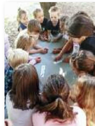
„Kincskereső” délelőtt a parkban

A foglalkozás végén minden napközisnek egy kiszínezhető könyvjelzőt ajándékoztunk, melyen a vers szereplői láthatóak. Köszönjük az élményt!