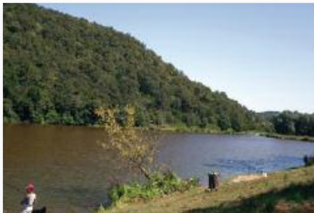
A meleg időben jólesik a víz hűsítő közelsége

Folytatva a Kéktúrát a Bánkút-Mályinka-Uppony szakasz közel 20 km-ét jártuk végig.