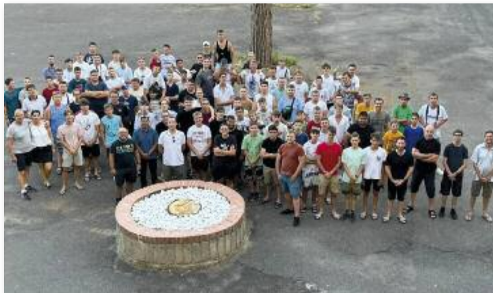
Az Egri Főegyházmegyből közel 80 ministráns vett részt a zarándoklaton

nap alatt láthattuk a Szent Péter-, a Lateráni- és a falakon kívüli Szent Pál-bazilikát, imádkozhattunk a Szent Lép-