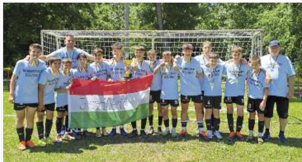
A bajnok csapat

Nagy gratuláció az elért eredményekhez a csapatnak és a gólkirálynak! Hajrá Árok!