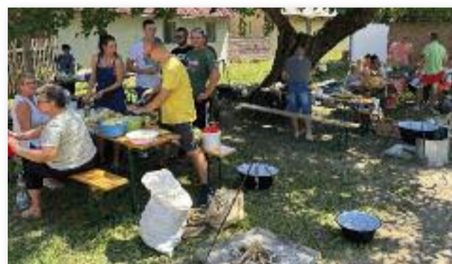
A készülődő csapatok

Idén is megrendezésre ke- rült a tavaly nagy sikert ara- tott szabadtéri rendezvény a Jász-Ház udvarán. Tíz csapat ragadott fakanalat, hogy megmutathassa e remek éték iránti elhivatottságát. Családi és baráti társaságok gyűltek össze, hogy egy jó hangulatú délutánon vegyenek részt.