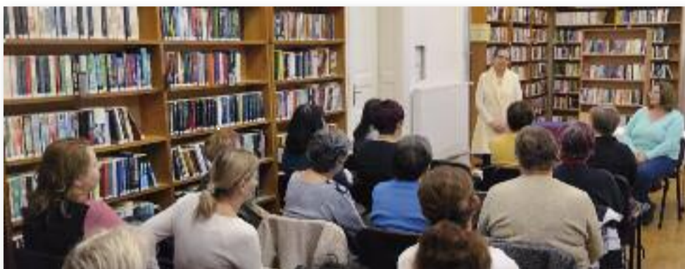
Előadás a belső békéről

helyi általános iskolánk második évfolyamát április 8-án, 9-én és 10-én. A gyerekeknek egy fordulatot magyar népmesét olvastunk fel, majd ezt kö-