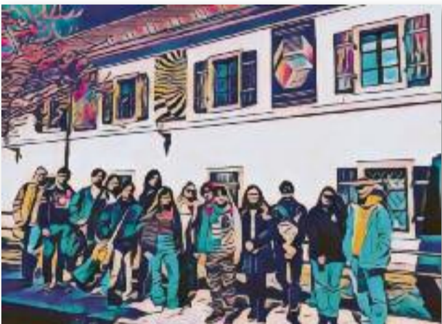
Csoportkép a kirándulóról