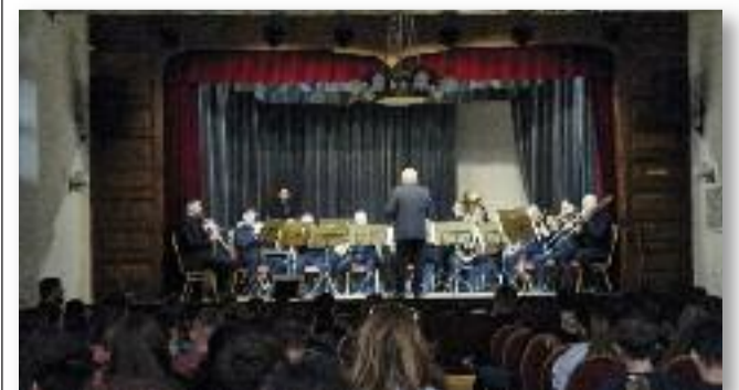
A Jászság 9 településéről összesen 520 tanuló vett részt a programon

Számtalan klasszikus mellett filmzenék és humoros átkötő szövegek játszva neveltek ezen a délelőttön, ahol a Jász-Nagykun-Szolnok Vármegyei Rendőrkapitányság közlekedésbiztonsági, rövid „tavaszi” intelmekkel és fényvisszaverő ajándékokkal látta el a gyermekeket.