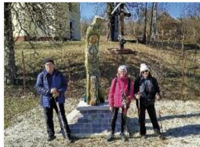
A KÉK túra idején első szakaszán

sok évtizedes hangját, illatát. Ezután már szinte sík a terep, így gyorsabb a haladás is. Így érkezünk meg túránk végpontjához, Bódvaszilásra. Sajnos már nincs arra időnk, hogy a környéken is szétnézzünk, pedig itt található az Alsó-hegy