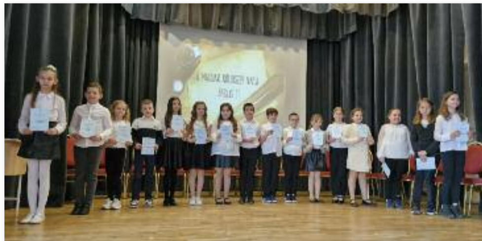
A 3-4. osztály versmondói

„A VERS CSAK SZÜLETIK, MINT AHOGY SZÜLETIK A SZÉL. VAGY A VIRÁG. VAGY A FALEVÉL. SZELLŐ A VERS, S ÉN AZT HISZEM, A VÉGTELEN KÜLDI VELE NEKÜNK VILÁG-VIRÁGOK BŰVÖS ILLATÁT, S AMINT SZÍVÜNKÖN LOPVA ILLAN ÁT LEPERGETI AZ ÉRZÉS-SZIRMOKAT.” /WASS ALBERT/