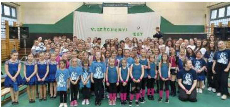
Az est résztvevői