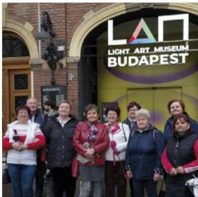
Lenyűgöző színekavalkád a Light Art Museum-ban

Az Örömködők csapata ismét egy eseménydús hónapot tudhat maga mögött. Beszámolóim elején örömmel tudatom, hogy 1 évesek lettünk.