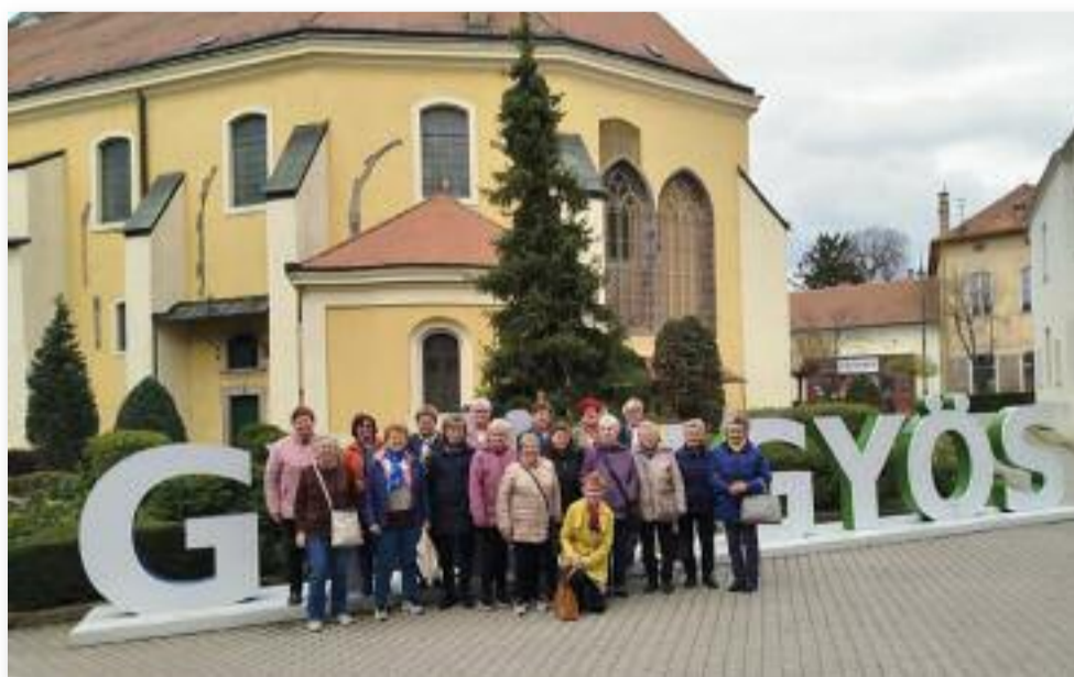
Az áprilisi kirándulás úti célja Gyöngyös volt

Remélem, hogy ilyen kirándulásunk az idei évben még lesz. Májusi előzetes: anyák napja, melyre mindenkit várunk szeretettel.