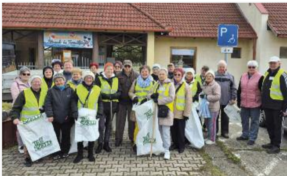
A TeSzedd akcióhoz a Kertbarátok egyesülete is csatlakozott

sabb eseménye a Kertbarát Kör fennállásának 50 éves évfordulójának méltó megünneplése lesz. Jó csapattal,