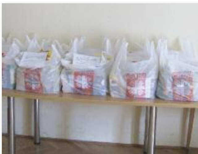
A templomban gyűjtött csomagok

Mint sok év óta, 2025-ben is a Magyar Katolikus Püspöki Kar meghirdette a templomokban március 23-30. között a