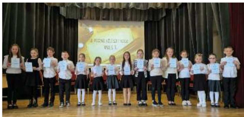
Az 1-2. osztályos versmondók