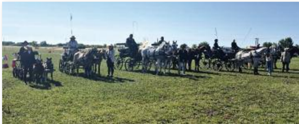
Megyei pontszerző és OB kvalifikáló forduló a CAN-C kategóriás hajtók részére

Köszönjük az alapító tagok és a régi tagok önzetlen munkáját, valamint köszönjük támogatásukat a felajánlásokat, támogatásokat!