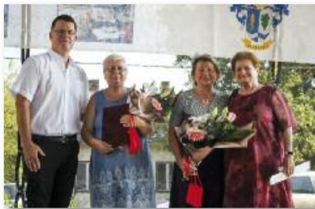
A "Jászágó Községért" kitüntetettek