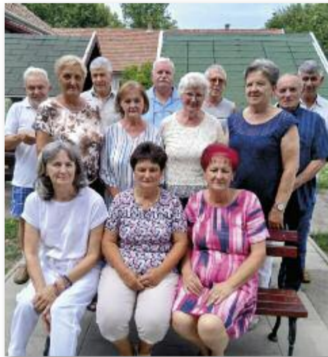
Egy jó hangulatú, egész napos osztálytalálkozó résztvevői

Az ebéd előtt készült csoportkép emlékeztetni fog mind a tizenhármunkat a találkozó élményére, hangulatára. Egy rövid köszöntő után név szerint, gyertyagyújtással emlékeztünk meg azokról az osztálytársainkról, akik már nem lehetnek velünk. Két