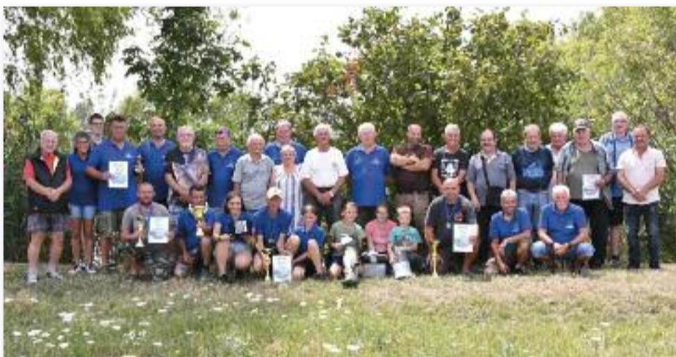
Csoportkép az 50 éves horgászverseny résztvevőivel