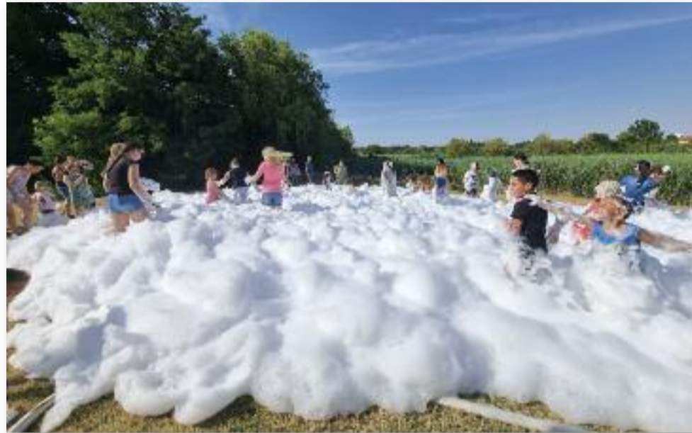
Gyerekek és felnőttek örömmel merültek el a habokban

Az érdeklődők közül pedig többen érkeznek Jászáro-