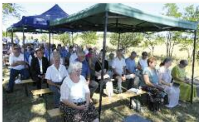
A búcsú résztvevői

az utókor a lerombolt iskolakápolna emlékére, nem hagyjuk, hogy feledésbe menjen.