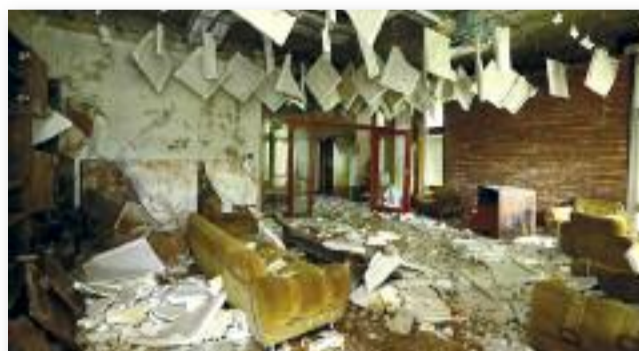
A Kádár nyaraló belülről

Kádár villája körülbelül 50 méterre található a Balatontól. Ma a korábbi pártüdülő nagy részét már elbontották, de a Castro, illetve a Kádár-villa még mind a mai napig áll.