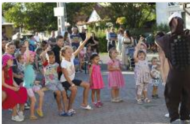
A gyermekek örömmel csatlakoztak az interaktív előadáshoz

8 órától a Triász együttes tagjai uralták a színpadot és teremtettek nagyszerű han-