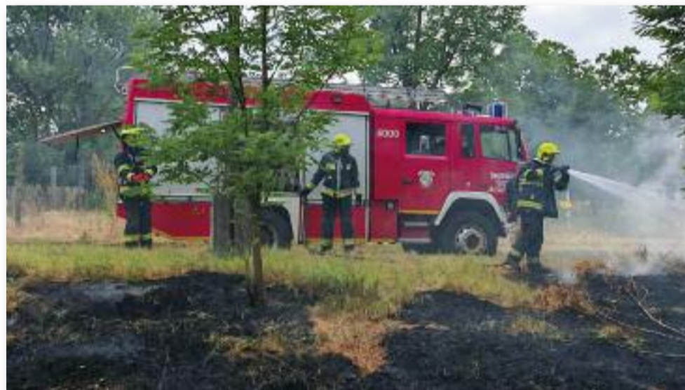
Egy jászberényi tanyán 3 hektáron égett a tarló

TÁJÉKOZTATJUK ÖNÖKET, HOGY TÉRSÉGÜNKBEN - A CIKK ÍRÁSAKOR - TŰZGYÚJTÁSI TILALOM VAN ÉRVÉNYBEN. AZ AKTUÁLIS TŰZGYÚJTÁSI TILALOMRÓL ÉS SZABÁLYOKRÓL A WWW.KATASZTROFAVEDELEM.HU OLDALON LEHET OLVASNI.