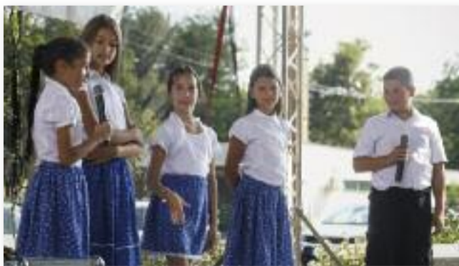
A jászágói iskolások műsora

hogyan a falunap keretében kerül átadásra a Jászágó Község Önkormányzata által adományozott „Jászágó községért” kitün-