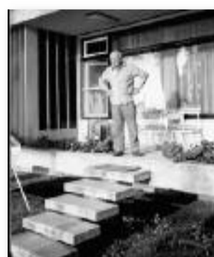
Kádár János a pártüdülőben

Kádár egyébként a nyaralásai alatt nem fogadott egyetlen egy pártvezetőt sem, kivéve Aczél Györgyöt, aki a kultúrpolitikáért volt felelős a Kádár-korszakban. Őt csak azért fogadta, mert vele tudott Kádár szórakozni, és egymás mellett volt a nyaralójuk - az övé volt az V. számú.