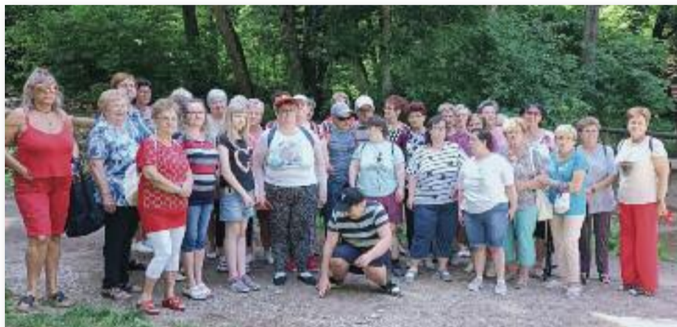
A csodaszép Szalajka-völgyben

ebéd – húsleves, rántott hús sült krumplival, rizszel és savanyúsággal – követte, illetve aki akart, még fagyizhatott is a közeli fagyizóban. Délután élményekkel telve tértünk haza Jászárokszállásra.