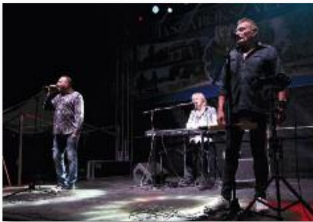
A Triász együttes koncertje

Az ünnepség végén a megszentelt kenyerek a Szent Erzsébet Karitás Csoport segítségével kerültek kiosztásra.