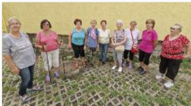
Friss levegő, mozgás, jó hangulat - erről szól a gyalogló klub

A reggeli gyaloglás után mindenki frissen és lendületesen távozik, és így vág neki az előtte álló napnak. Aki ismeri ezt az érzést, tudja, hogy ez milyen klassz. Ha felkeltette az érdeklődésed