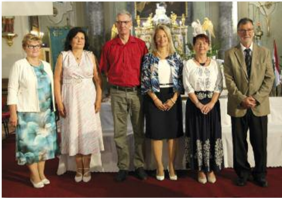
A Szent István király ünnepén kitüntetettek

A nyári hónapok alatt idén is több ezer látogatója volt a Jászárokszállási Strand- és Termálfürdőnek. A Strandok Éjszakájának nagy sikere után, augusztus 16-án egy fergeteges hangulatú Nyár-búcsúztató party-ra várták a vendégeket. Egész éjjel volt lehetőség a fürdőzésre, miközben DJ Guba és a