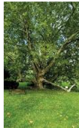
A százéves platánfa

Mi megfogadjuk ezt a tanácsot és valóban, mindenki köszön mindenkinek. A táj csodálatos, a lemenő nappal a levegő kezd frissülni. A Zempléni-hegység vulkanikus eredetű, andezit, andezittufa, riolit és riolittufa felépítésű hegység. Változatos, fajgazdag élőhelyekkel (cseres, gyertyános, tölgyes, bükkös, tőzegmohás lápok)