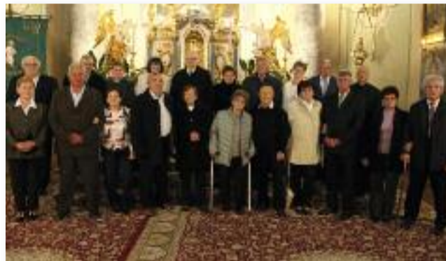
Az 50 éves jubiláló házaspárok