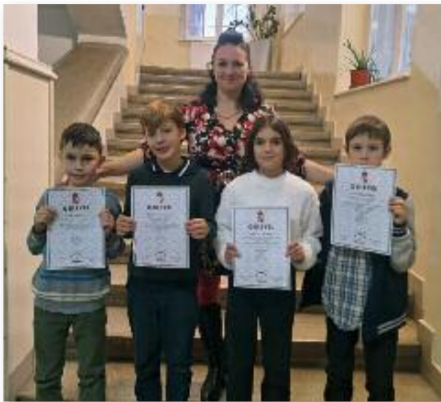
A Hős Matekosok és felkészítőjük