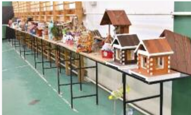
77 alsó tagozatos diák készített ötletes madáretetőt

25 év sok vagy kevés, az nézőpont kérdése, de úgy gondolom, amit a 25 év alatt elértünk, amiatt nem kell szégyenkezni. A fenti idő alatt a semmiből egy (sokak által állított) jól működő egyesületet sikerült kovácsolni, mely saját kiállítási ketreccparkkal, dekorációs kellékekkel ren-