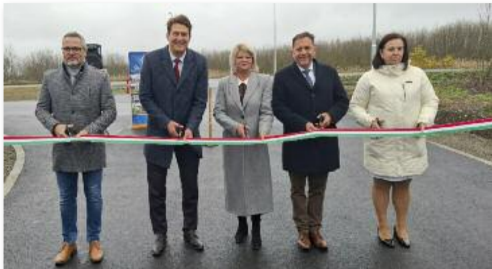
Az Ároki út megépítése fontos lépés a település Ipari parkjának fejlesztése érdekében