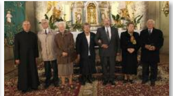
A 60 éves jubiláló házaspárok