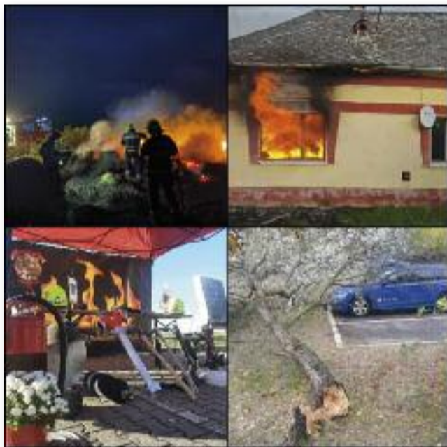
A káresemények elhárítása mellett több rendezvényen is részt vett a tűzoltóság

Javában zajlik a fűtési szezon. A fűtőberendezések, kémények használata ezeken a hűvös napokon, éjszakákon főszerepet tölt be a háztartásokban, ebből adódóan érdemes ezek felülvizsgálatát elvégezni. A kéményseprő szolgáltatás természetes személyeknek ingyenes – azonban NEM automatikusan történik, időpontot kell foglalni a szolgáltatásra: 1818-as telefonszám, majd 9-es és 1-es gomb megnyomásával. A szén-monoxid-érzékelők és a füstérzékelők pedig igen hasznos eszközök a megelőzésre – tény, hogy ezek pénzbe kerülnek, azonban nem megfizethetetlenek! Viszont az ezekért kifizetett pénz nem öszszehasonlítható az emberi élet értékével! „HA BAJ VAN, SEGÍTÜNK!” Azonban a megelőzés Önökön is múlik!