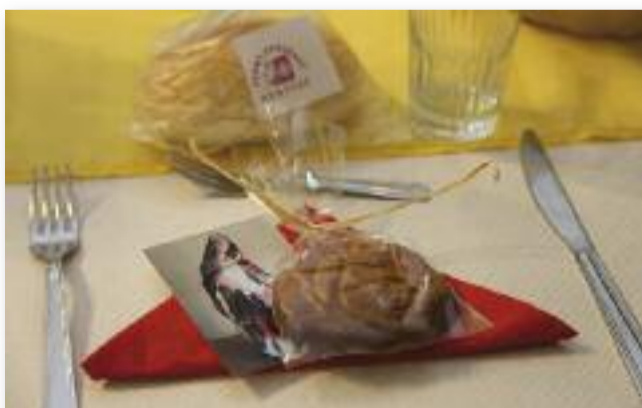
A vendégeket apró ajándék várta

Nagyon köszönjük a Magyar Labdarúgó Szövetségnek, hogy támogatták munkánkat és az egyesületet.