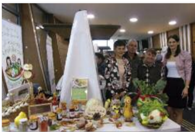
Termékeink új formában

SZERETEM A KERTÉSZKEDÉST - EZ EGY HELY, AHOL MEGTALÁL- HATOM ÖNMAGAM. /ALICE SEBOLD/