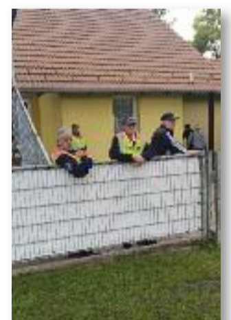
A hazai focimeccsek biztonságos lebonyolításában is segít a Polgárőr Egyesület

A Jászárokszállási Városi Sportegyesület kérésére minden hazai labdarúgó mérkőzésen ott vagyunk és segítjük a mérkőzések biztonságos lebonyolítását. A tavalyi évben a Magyar Labdarúgó Szövetség úgy gondolta, hogy a megyében több polgárőr egyesületet támogat és megköszöni munkáját. Jászárokszállás Város Polgárőr Egyesületét az elmúlt évben és az idén is kiválasztották erre az elismerésre. A