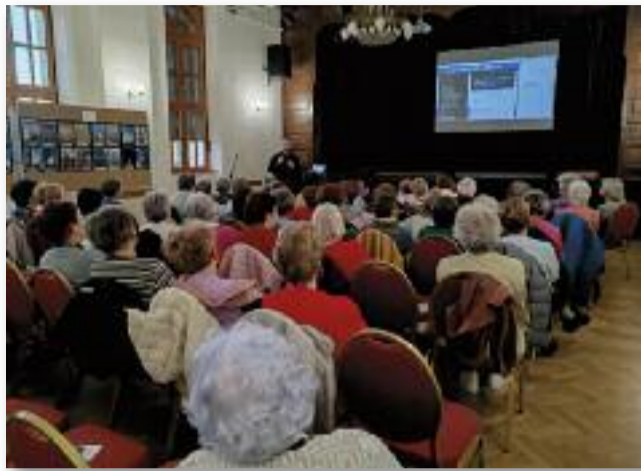
A Jászberényi Rendőrkapitányság bűnmegelőzési előadása

Úgy gondoltuk, hogy manapság a gyerekek és az