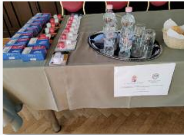
A rendezvényen kerékpárlámpák, nyitászérzők és belépésszelők is kiosztásra kerültek

tuk, hogy egy szakmai napot tartunk a Jászárokszálláson élő idős embereknek „Biztonságban, idős korban” címmel a Jászberényi Rendőrkapitánysággal közösen.