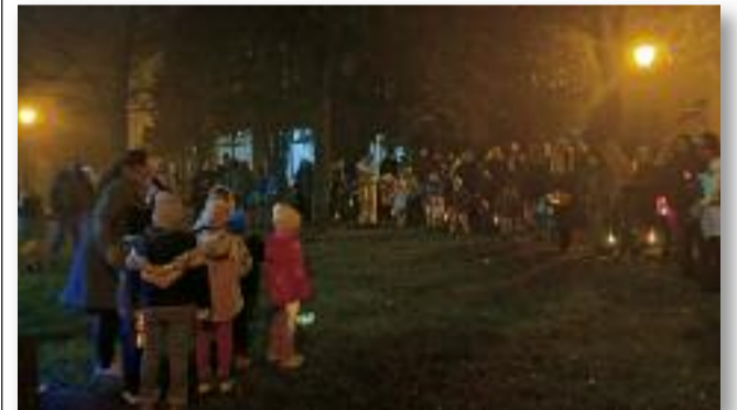
Márton-napi lámpás felvonulás

Ezt követően kerekasztal beszélgetés volt. A program közösségépítő és hagyományörző jellegének köszönhetően