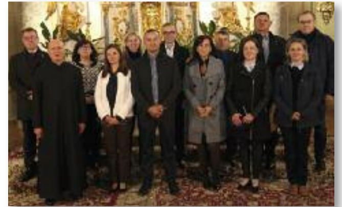
A 25 éves jubiláló házaspárok

A SZERETET NEM FÉLTÉKENY, NEM KÉRKEDIK, NEM GÓGÖSKÖDIK. NEM TAPINTATLAN, NEM KERESI A MAGÁÉT, HARAGRA NEM GERJED, A ROSSZAT FÖL NEM RÓJA. NEM ÖRÜL A GONOSZSÁGNAK, DE EGYÜTT ÖRÜL AZ IGAZSÁGGAL. MINDENT ELTŰR, MINDENT ELHISZ, MINDENT REMÉL, MINDENT ELVISEL...” (IKOR 13, 4-7)