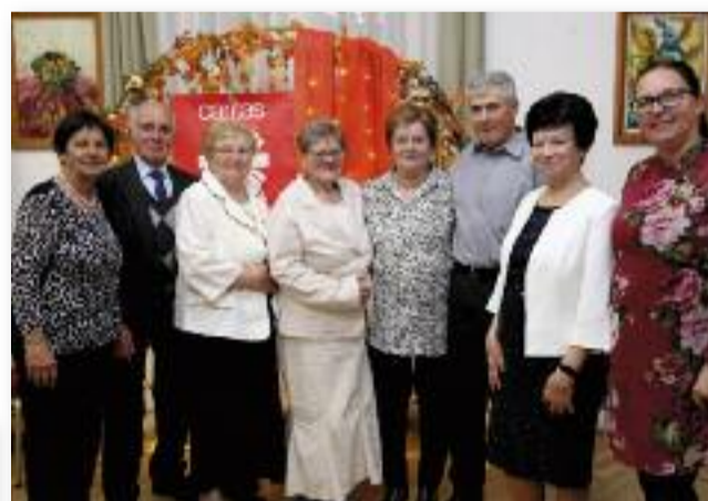
A 2025-ös Erzsébet bál is baráti hangulatban telt