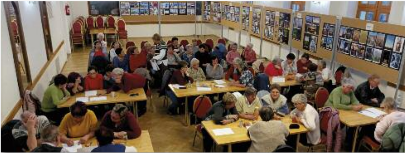
Munkában a csapatok és a közönség