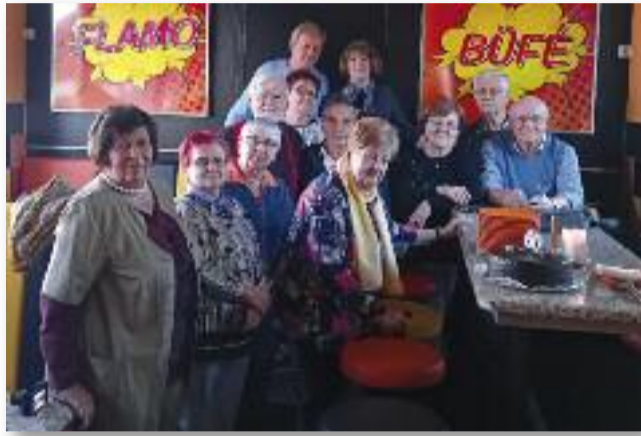
A hatvanéves osztálytalálkozó résztvevői