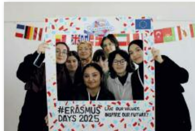
Az Erasmus+ 'Democrateens in Action' pályázat törökországi útja

A program keretein belül barátságokra, élményekre és hasznos tudásra tettünk szert, mint például a demokrácia közelebbi megismerése, a kultúránk közti különbségek felfedezése. A 2026. február 9-vel kezdődő héten ismét alkalmunk lesz találkozni vendéglátóinkkal a nálunk megrendezésre kerülő záró találkozón. Nagyon várjuk!