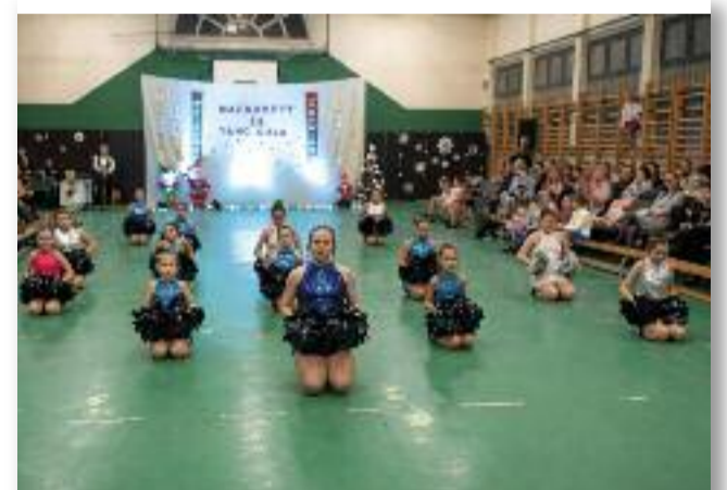
Vidám hangulatú pom-pom koreográfia