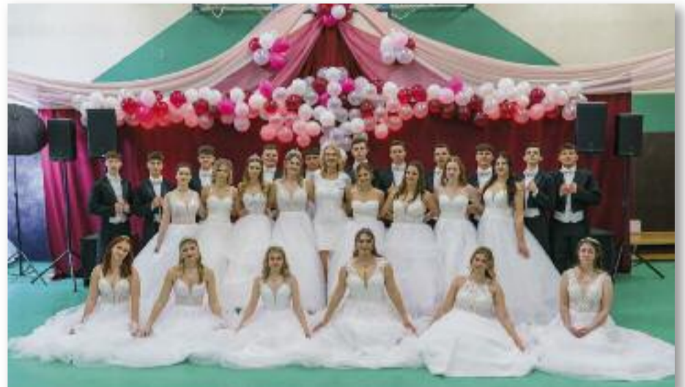
A végzős 12. B osztály