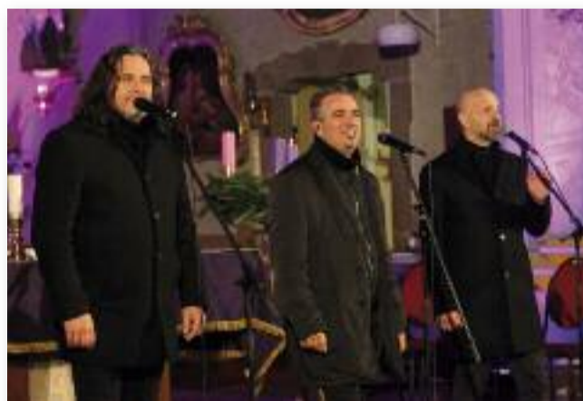
A formáció három év után ismét lélekiemelő koncertet adott templomunkban