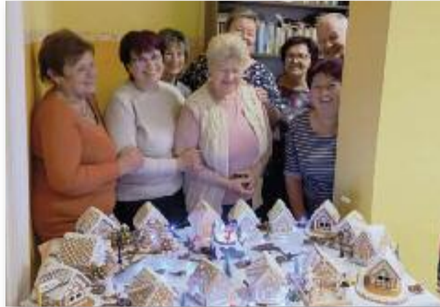
A mézeskalács házikók és készítőik

Mivel az adventi időszakban sokan látogatják a művelődési házat, így ott kértünk he-