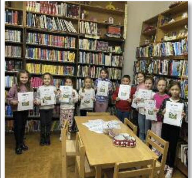
Az Olvasó Nagykövetek

Már a plakát és a felhívás is kíváncsivá tett és egyben nagyon örültem neki, hiszen sokszor halljuk, nem olvasnak eleget vagy egyáltalán nem is olvasnak a mai gyerekek. Minden alkalmat, fórumot, lehetőséget meg kell ragadni, hogy