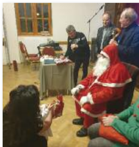
A Mikulás sok-sok csomaggal kedveske- dett a gyerekeknek