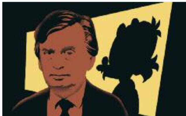
Antall József és Dagobert bácsi egy karikatúrán

ber 12-én, délután 5 óra után elhunyt. Ekkor a Magyar Televízióban 1991 óta már szokás szerint, vasárnap délután a Walt Disney bemutatja című, Disney rajzfilmeket tartalmazó műsor ment. A gyász hírt a Magyar Televízió egyik csatornáján