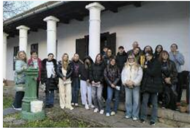
Olasz és magyar diákok a Jász-Ház előtt

jelenthet, főleg, ha vendéget fogadunk. Mindezek ellenére ezek a tapasztalatok rendkívül értékesek, és sokat tanítanak alkalmazkodásról, nyitottságról és a