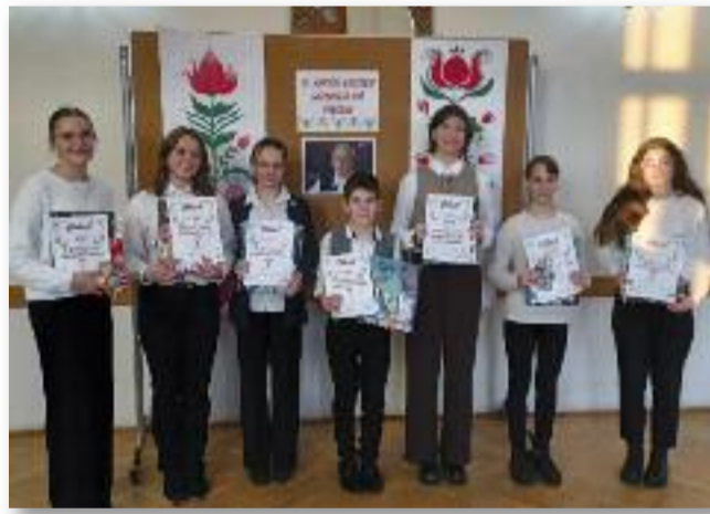
A III. és IV. korcsoport győztesei és különdíjasa

A legkisebbek az Érik a szőlő vagy a Még azt mondják... című kötelező énekek közül választhattak. A kötelező énekek után az általuk választott népdalok csendültek fel. Hallhattunk a béres-