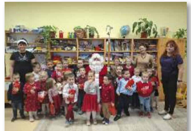
A Dobó utcai óvoda Halacska csoportja a Mikulás bácsival

A Jászvidék decemberi lapzártája után, az elkövet- kező két hétben sok ese- mény vár majd ránk: dec- ember 9-én, 10-én a Lehel utcai óvodában a szülőkkel és a gyermekekkel együtt nézzük meg a Katica cso- port karácsonyi műsorát, akik majd az Apartmanház