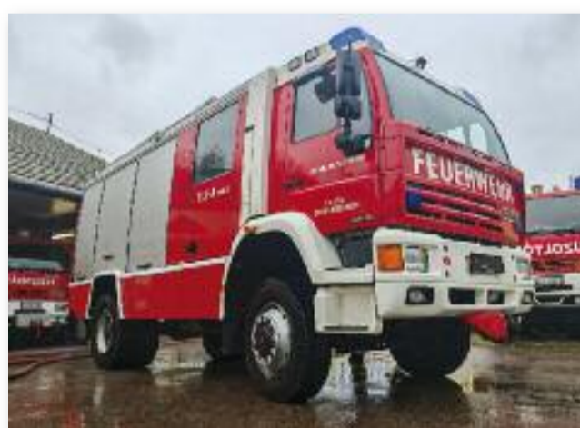
A tűzoltó-laktanya új "lakója"

ból nem tudtuk megvalósítani a beszerzését, ezért összefogásra volt szükségünk: önrészre, vállalkozói támogatásra és lakossági hozzájárulásra.