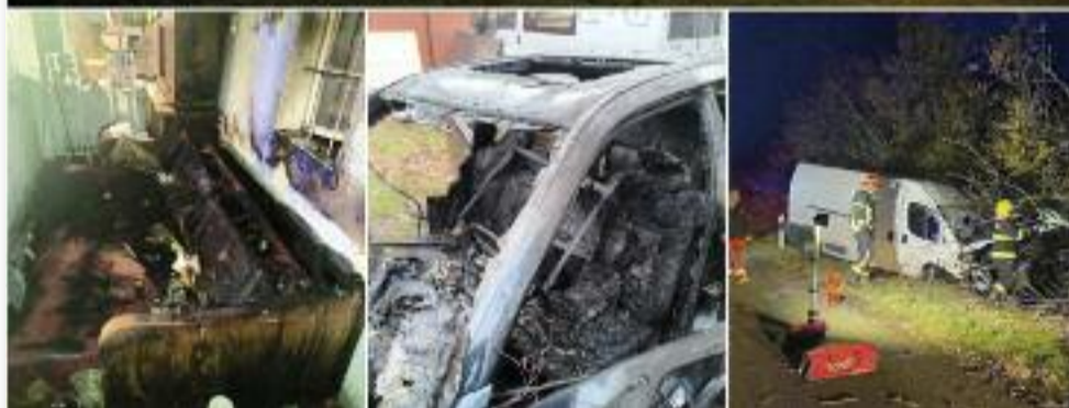
Az adventi időszakot több baleset, lakástűz előzte meg