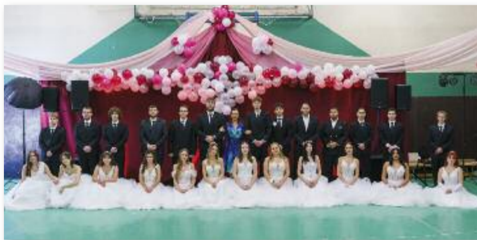
A végzős 12. A osztály

A leglátványosabb díszítőelemek a léggömbök voltak. A csapat egyik része kompresszorral fújta őket, valakinek minden második kipukkant, mások pedig kreatív formákba próbálták csomagolni őket, így mindenkinek volt valami feladata. A