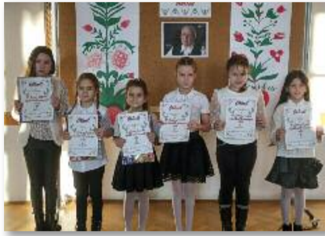
Az I. és II. korcsoport győztesei

A versenyen négy kategóriában csillogtatta meg énektudását 29 diák. Rutinosak és kezdők, bátrak és félénkek sorra léptek a zsűri és a közönség elé. Szívet melegengető volt hallani minden egyes fellépőt, amit a produkciókat követő taps is bizonyított. Így a gyerekek számára ez egy újabb sikerélmény volt, és azok sem mentek haza csalódottan,