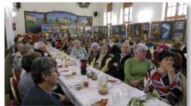
Az óévbúcsúztató vacsora résztvevői

A Kertbarát Kör Egyesülete nevében minden kertbarát tagnak, családjának és a város összes lakójának boldog új évet kívánok!