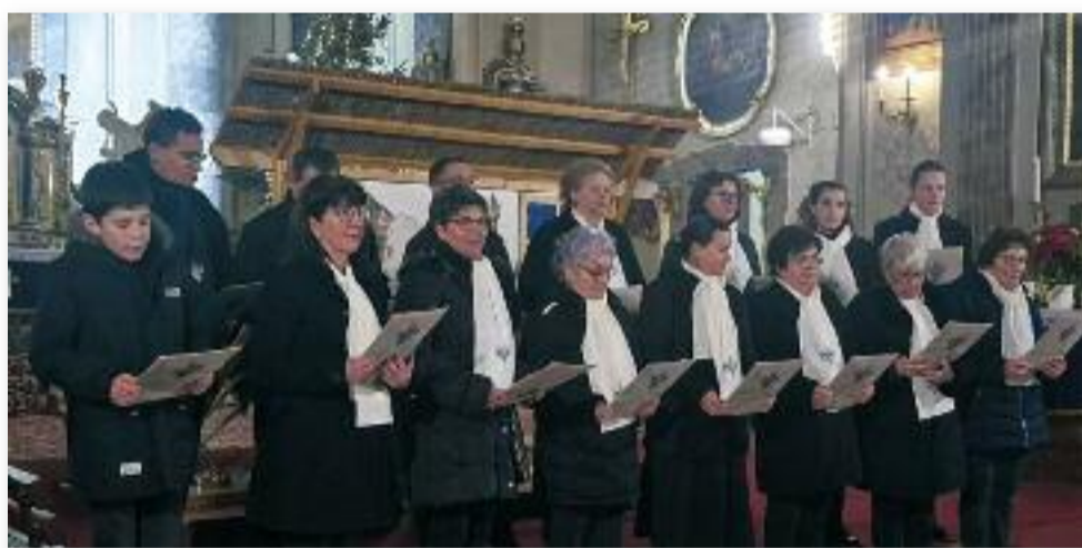
Közös éneklés, 2025. december 15.