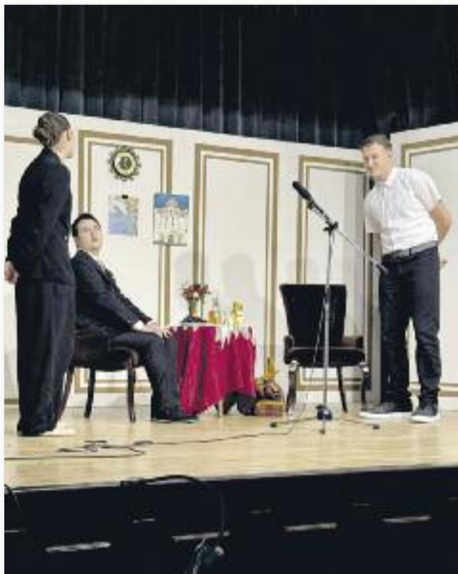
Botrány a Strand Hotelban a 11. A előadásában

Reméljük, hogy előadásunkkal némi örömet tudtunk szerezni a nézőknek ebben az ünnep előtti meghitt várakozásban, és esetleg felkeltettük valakinek az érdeklődését az amatőr színjátszás vagy az iskolai rendezvényeken való részvétel iránt.