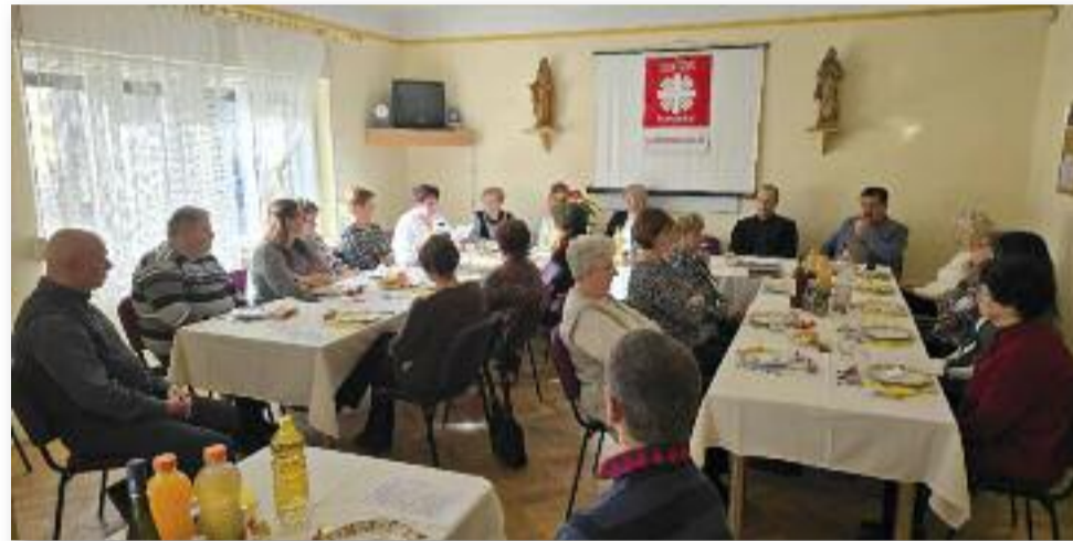
Adventi gyűlés a karitászt csoportnál

Kívánok mindenkinek egészséges, békés, boldog új évet a Szent Erzsébet Karitászt Csoport tagjai nevében!