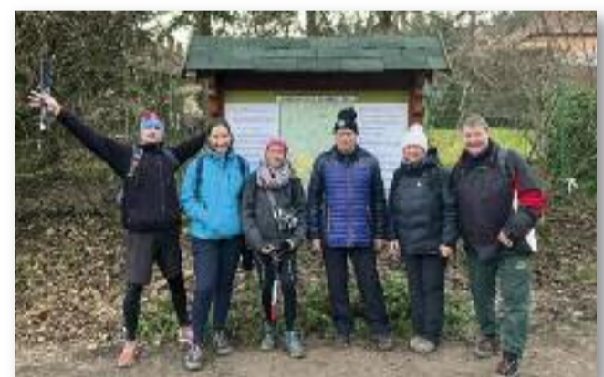
A Mátra újabb meghódítása

Összegezve a tavalyi évet: minden túra egy csoda volt és remélem, hogy 2026-ban is ilyen élményekben lesz részem, részünk!