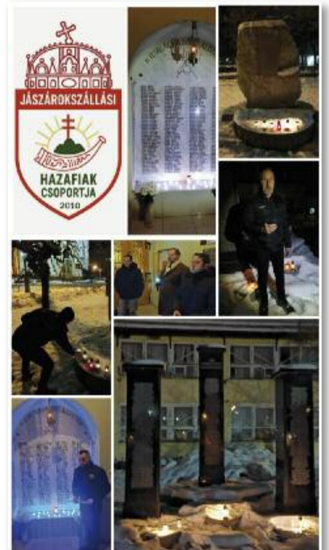
A Jászárokszállási Hazafiak Csoportjának megemlékezése

Ahogy nézzük a lassan fogyó gyertya fényét, rájövünk: a hősök nem tűntek el örökre. A lángban tovább élnek. Minden fellebbbanásban emlékeztetnek arra, hogy a bátorságuk nem hangozik, melldöngető, az áldozatuk nem kér jutalmat, csak megbecsülést, emlékeztet. A mécses lassan fogy és amikor a láng végül kialszik, nem csak a sötétség marad utána... Odafentről talán büszkén néznek le ránk a hősök és szelíd mosollyal nyugtázzák, áldozatuk mégis örök fényként ragyog!