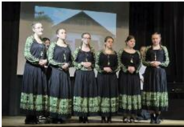
A Délibáb Népzenei Műhely műsora

Január 22-én, csütörtökön a művelődési házban 17 órától köszönetet mondtunk mindazoknak, akik hozzájárulnak kulturális örökségünk ápolásához és továbbörökítéséhez: az íróknak, költőknek, művészeknek, kulturális szakembereknek, pedagógusoknak, azoknak, akik szívüket-lelküket beleteszik abba, hogy