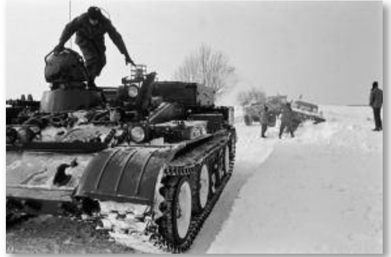
Elakadt járművek, tankok 1987 januárjából.

Ezen a napon különösen leesett a hőmérséklet, napközben országszerte -10 és -18 fok között alakult a hőmérséklet, de a következő éjszaka volt a rendkívüli időszak alatt a leghidegebb, ugyanis a leg-