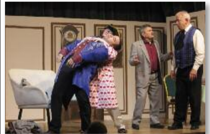
Ki is volt a hálósobában?