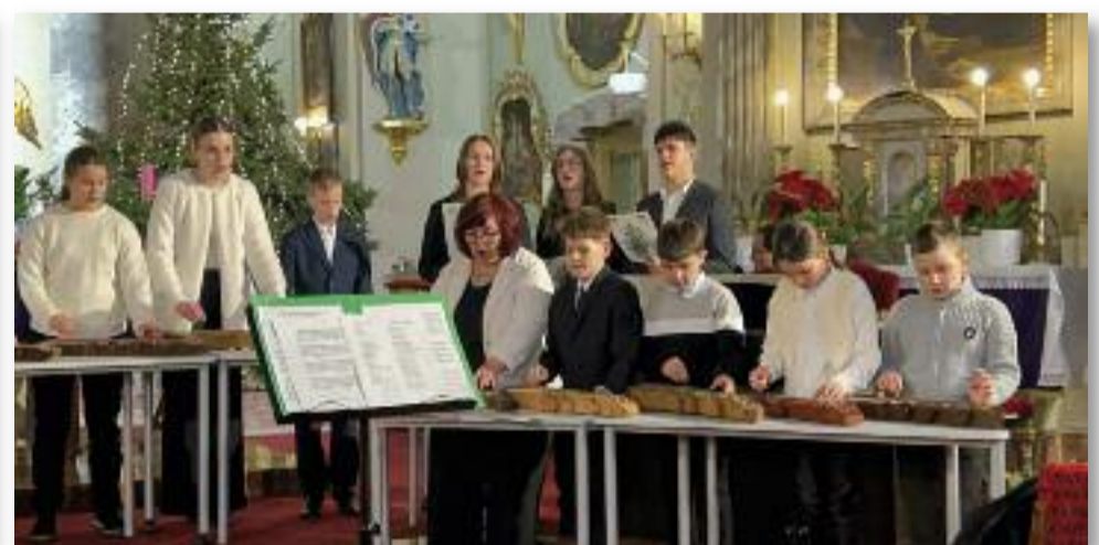
Széchenyi István Általános Iskola és Alapfokú Művészeti Iskola adventi hangverseny, 2025. december 18.