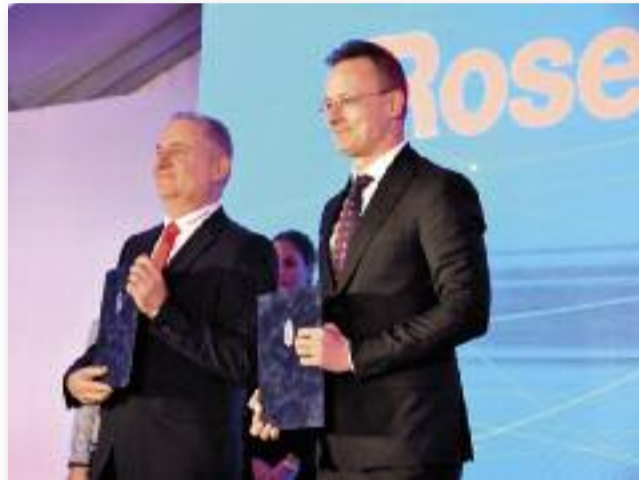
Szijjártó Péter külgazdasági és külügyminiszter és Czákó Tibor ügyvezető igazgató az Együttműködési megállapodás aláírása után

2026. február 10-én jöjjenek el a művelődési házban tartandó közmeghallgatásra, a képviselő-testülettel tisztelettel várjuk Önöket. Bemutatására kerül Jászárokszállás Város Önkormányzatának 2026. évi költségvetés-tervezete. A közmeghallgatáson le-