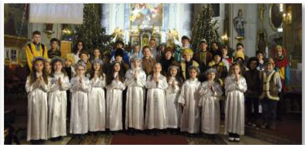
Pásztorjáték, 2025. december 24.