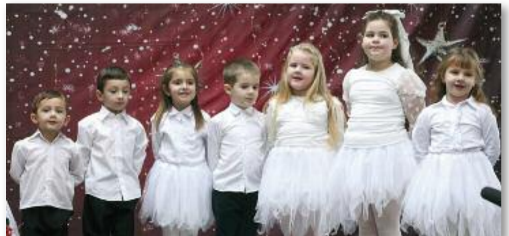
Az Őzike csoport műsora

SZÖVEG: NAGY KINGA