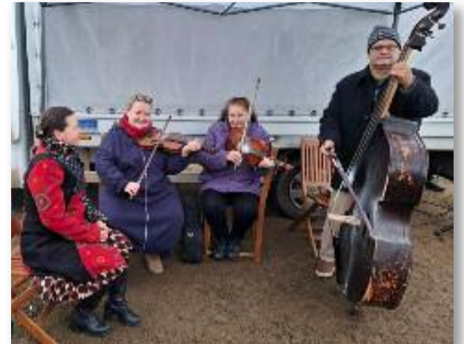
Meglepetés program is várta a vásárra kilátogatókat

A januárban megrendezésre kerülő vásáron sem maradt el a meglepetés program.