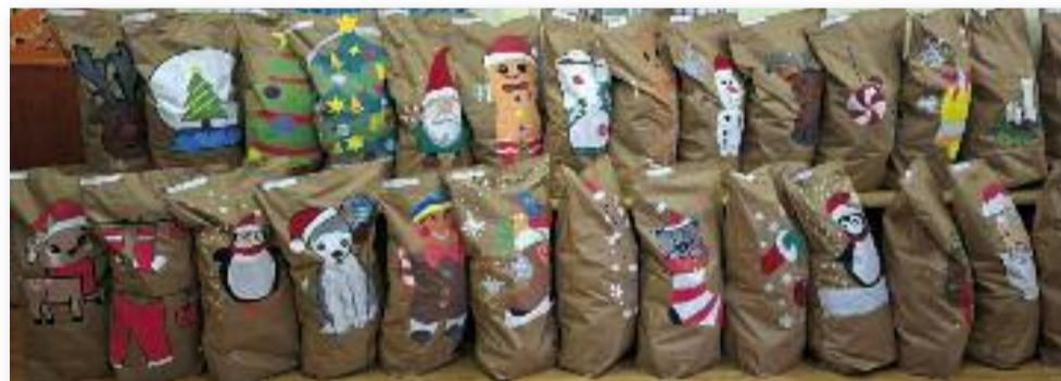
40 jászárokszállási és környékbeli hátrányos helyzetű család megajándékozására került sor