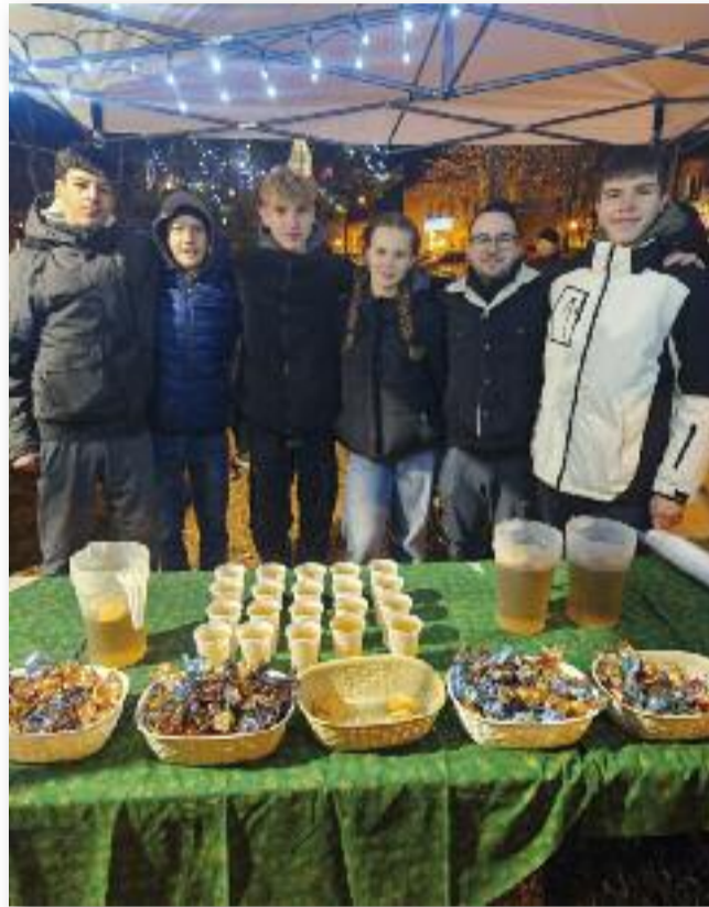
Az Ifjúsági Tanács tagjai mellett diákok is segítették a szervezést

A karácsonyi estét meghitté tette a HangSzépitők Zenei Tanoda koncertje, amely emlékeztetett a