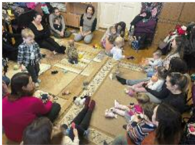
Egy klub, ahol a babák és mamák is jól érezhetik magukat

létre, hogy a kisgyermekes édesanyák és gyermekeik olyan közösségre találjanak, ahol támogatásra, megértésre és igazi kapcsolódásra lelhetnek. Foglalkozásainkon lehetőség nyílik közös játékokra, éneklésre, ismerkedésre és olyan szakmai beszélgetésekre, amelyek segítik a mindennapi anyaságot. Fontos számunkra, hogy mindenki otthon érezze magát – akár első gyermekes anyuka, akár már tapasztalt szülő. A klub egy hely, ahol meg lehet állni egy kicsit, elfogyasztani egy teát, beszélgetni, feltöltődni, és közben a babák