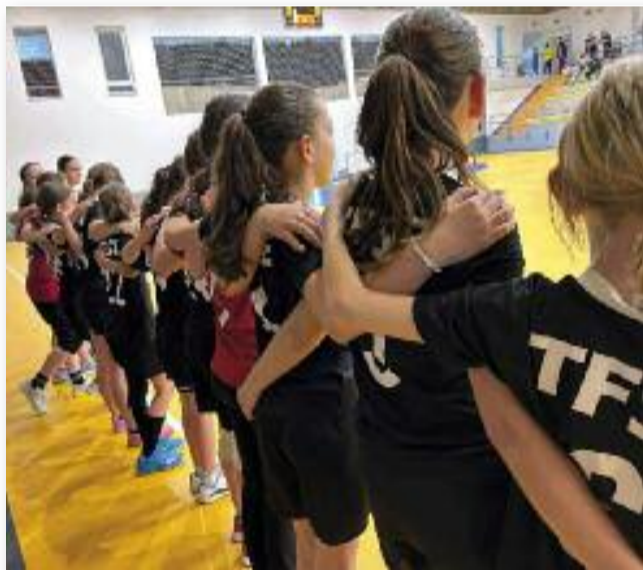
Meccs előtti pillanatok

A TFSE utánpótlás szakosztálya várja a fiatalok (lányok és fiúk) jelentkezését egészen 6 éves kortól. Az edzések családias hangulatban zajlanak, ahol nem az eredményorientáltság a meghatározó, hanem a játék öröme.