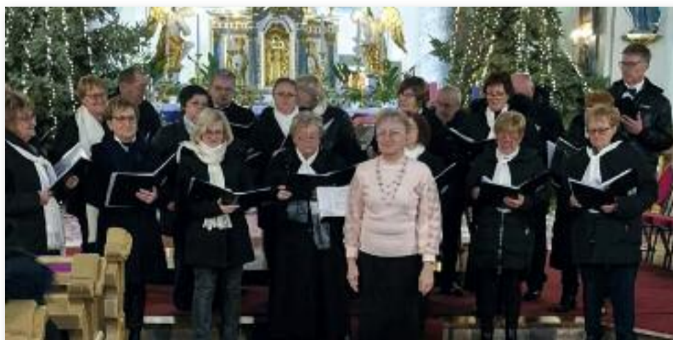
Déryné Vegyeskar adventi koncert, 2025. december 21.