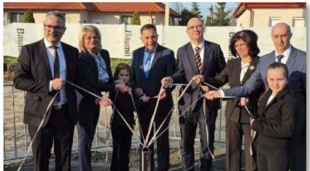
Az időkapozsula elhelyezése

Ez a nap nemcsak egy építkezés kezdete, attól sokkal több, egy közös jövő alapjainak lerakása. Az iskola nem csupán falakból, termekből