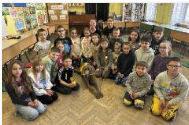
Aramisz jelenléte képes megnyugtatni, motiválni és fejleszteni a tanulókat

Az egyesületben jelenleg 14 aktív páros dolgozik (ebből 1 személyi segítő és 1 diabétesz jelző+terápiás), valamint több felkészülő páros is van.