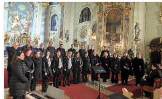
A Nagyböjti koncert első állomásán

A koncert második részében Kodály-feldolgozásokat, Rossini kórusművet és barokk stílusú passiómeditációt hallhattunk, melynek címe: A mi Jézusunk testrészei. Záró műsorszámként ismét egy reneszánsz dal, a Salve Regina következett.