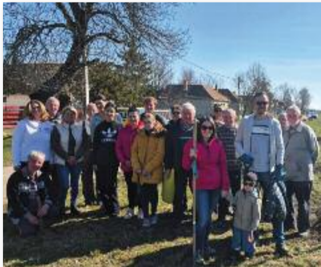
Fiatalok és idősebbek együtt tettek környezetünkért

Az ilyen alkalmak egyben erősítik a közösséget is, és rámutatnak arra, hogy már kisebb lépésekkel is jelentős eredményeket érhetünk el. Köszönet illeti mindazokat, akik részt vettek az ak-