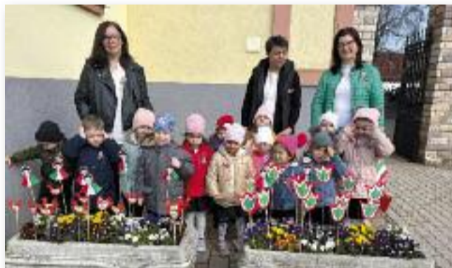
Pillangó kiscsoportunk a Városháza előtt

Február végén a Jászárokszállási Városi Óvoda életében már érezhető a közelgő tavasz hangulata. Az óvodai csoportokban ilyenkor sok beszélgetés és játék kapcsolódik a tél búcsúztatásához és a tavaszvárásához. A gyerekekkel közösen készülnek vidám deko-