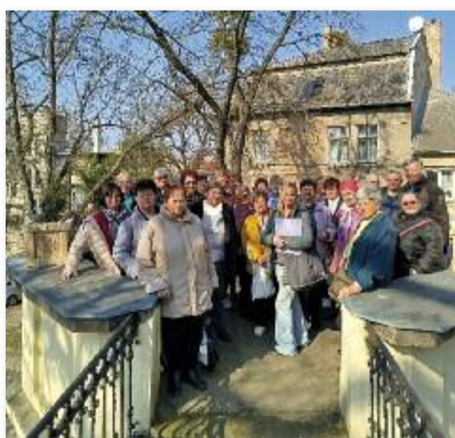
A Püspöki Palota Vác egyik legszebb látványossága

Sok élménnyel és kissé fáradtan értünk haza.