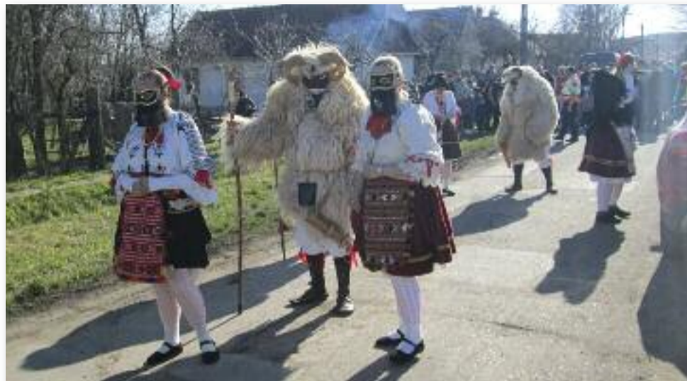
A mohácsi busók és sokac lányok hatodik alkalommal látogattak el az ÁllatbarátkoZoo-ba

A felvonulást követően a tömeg visszatért az ÁllatbarátkoZoo-ba, ahol már finom illatok vártak mindenkit. A babból, kolbászból, füstölt húsból és zöldségekből készült étel elkészültére már nem kellett sokat várni, de addig is a programot a sokac lányok táncháza, busó-eszközök kiállítása színesítette. A mozgástól megfáradt vendégek pedig az előzetesen