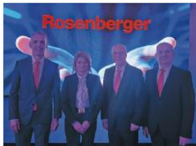
Az új beruházással tovább erősödik Jászárokszállás versenyképessége

Ezzel a beruházással, fejlesztéssel, városunk, Jászárokszállás versenyképessége tovább erősödik, na-