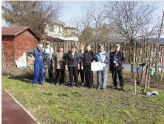
Megkezdődtek a tavaszi munkák

gyűlés is lesz - április 1-jén, délután 4 órakor tartjuk a szokott helyen, a Petőfi Művelődési Házban. A napirend fontosságára való tekintettel kérjük a tagság időben történő megjelenését!