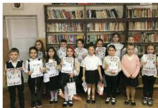
A mesemondó résztvevői és helyezettjei

A mesék világa egy varázslatos birodalom, ahol bármi megtörténhet. Itt az állatok beszélnek, a legkisebb királyfi legyőzi a hétfejű sárkányt és a szegény legényből akár király is lehet.