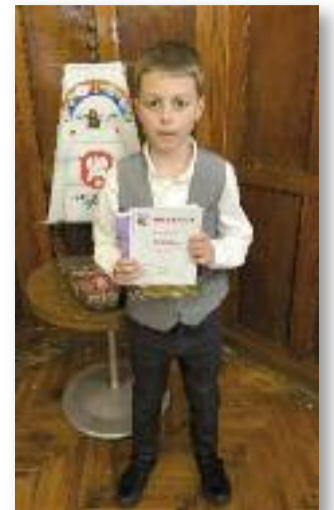
A Zrínyi Matematika Verseny legeredményesebb tanulója