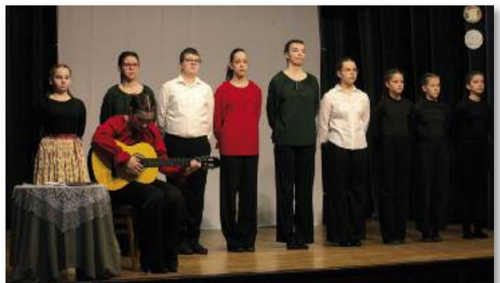
Jelenet az ünnepi műsorból

Az ünnepség első felének zárásaként az önkormányzatok, pártok, civil szervezetek helyezték el a megemlékezés koszorúit a Mátreaaljai Ván-