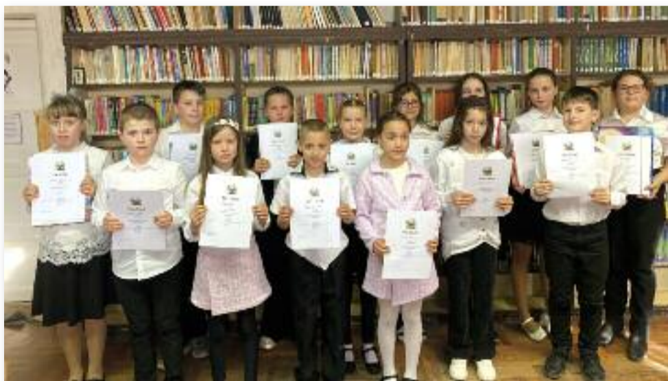
Az Aranyszáj Szépolvasó Verseny résztvevői és győztesei

A verseny két részből állt. Először mindenki az általa választott szöveget olvasta fel a zsűri és a társai, a tanító néni előtt.