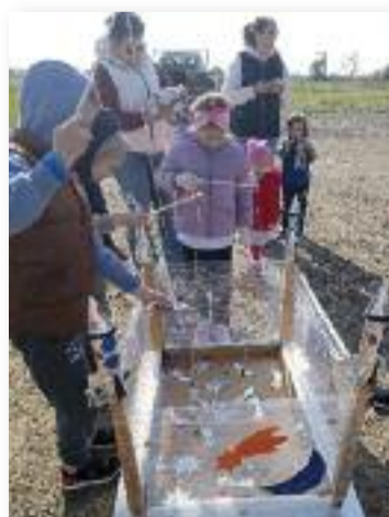
Az áprilisi vásár témája az űrhajózás volt

Érdemes hát megjegyezni: minden hónap második vasárnapja vásárnap városunkban!