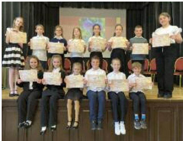
3. és 4. osztályos versmondók

tésével Weöres Sándor: Bóbita című, megzenésített versére vidám, mozgásos, énekes táncjal zártak. A vers adta játékos, varázslatos világot idézték meg, ahol minden mozdulat, minden ritmus életre kelt, mert a vers