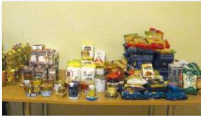
A lakosság felajánlása

ládok nevében, általuk tudtuk a családokat megajándékozni a húsvéti ünnepekre.