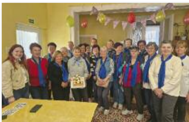
Több száz kilométer egy év alatt

Ezután is mindenkit szeretettel várunk hétfő délután, 14:00 órakor a Gondozási Központ udvarán. Tegyük, lépünk együtt egészségünkért és továbbra is figyeljünk egymásra!