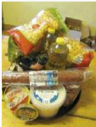
Adományból vásárolt élelmiszerek

vevők számára ingyenes ruhaosztást is rendeztünk. Köszönjük a támogatók adományait a rászorult csa-