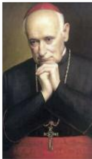
Mindszenty bíboros egy festményen ábrázolva

Több alkalommal is felvetődött, hogy önként távozzon a követségről. Először 1958 októberében: XII. Piusz pápa halálát követően a kérdés az volt, hogy Mind-