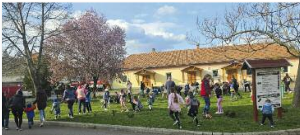
Idén tavasszal is folytatódott a tojáskeresés hagyománya

SZÖVEG: ZENTAI VIVIEN ZÓRA POLGÁRMESTERI KABINETTITKÁR