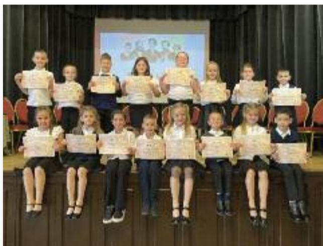
1. és 2. osztályos versmondók