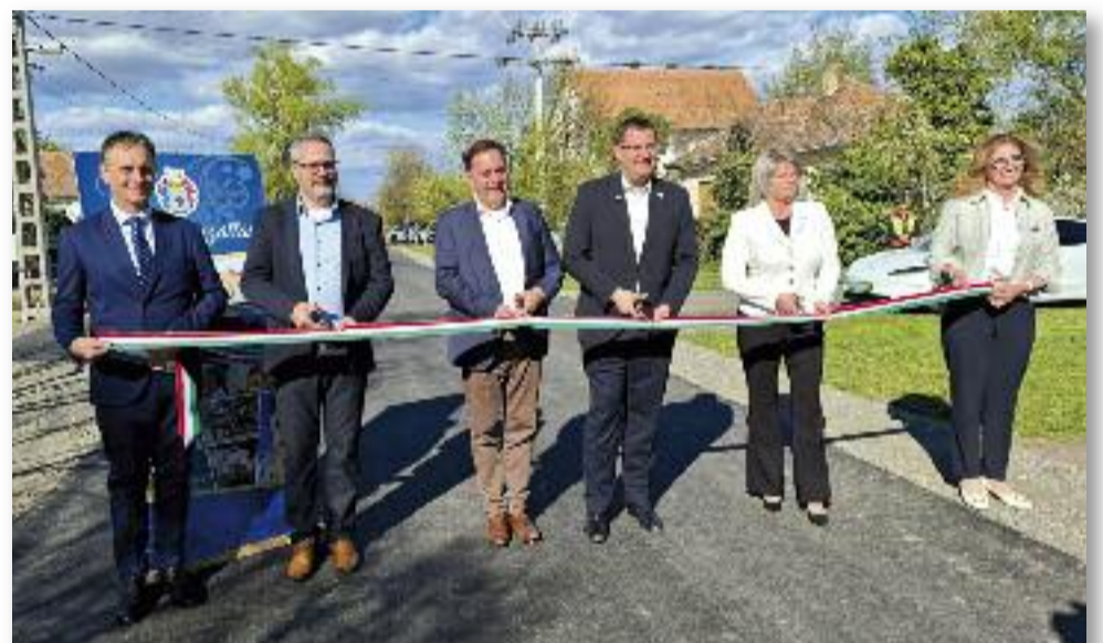
A program első ütemében a Deák Ferenc és a Mátyás király utcák több szakasza újult meg

Deák Ferenc utca közötti szakasza) megromlott burkolatú szakaszainak felújítása 318 méter hosszban valósult meg.