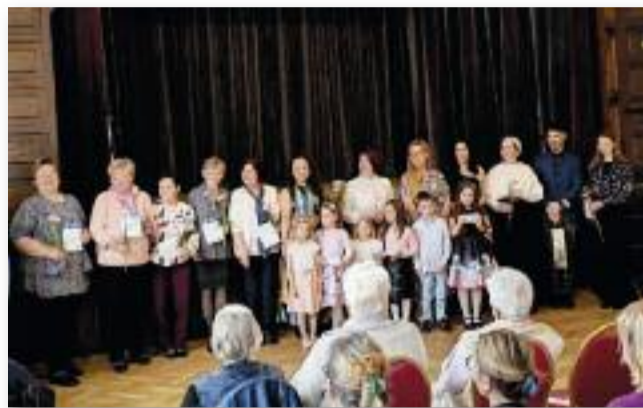
Költészet napi fellépők