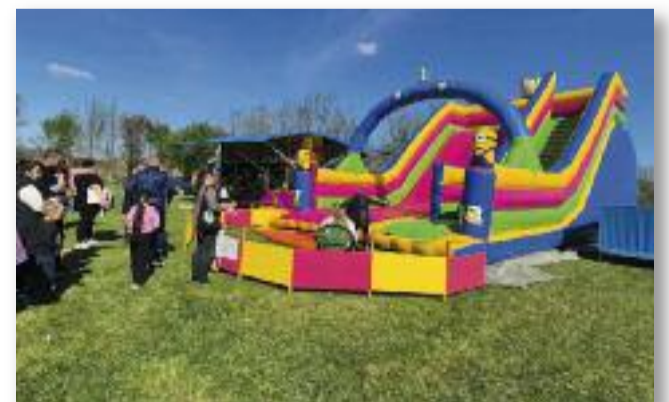
Ugrálóvár, arcfestés, versenyek várták a gyerekeket