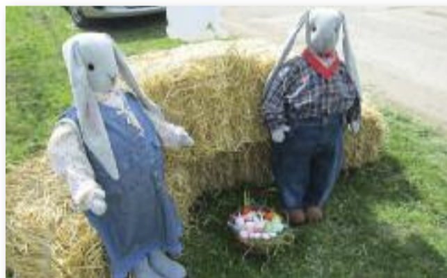
Ügyességi feladatok, tojáskeresés és buborékház is várta a kicsiket

A jó időben szívesen vettek részt az ügyességi feladatok-