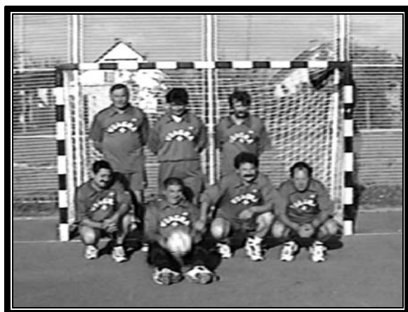
A tavaszi listavezető Viagra „+” csapata

Kérem a csapatkapitányokat, hogy a csapatok tagjainak névsorát egyeztetés miatt az új igazolásokkal együtt augusztus 10-ig adják le!!!!