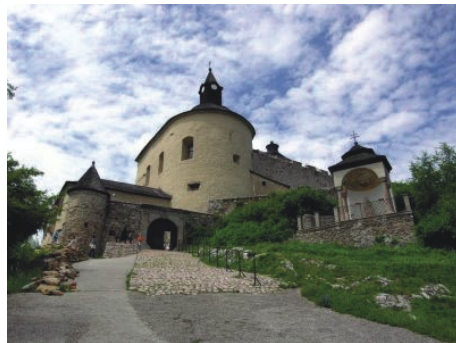
Kassa, Krasznahorka, Dobsinai

Így nem kerülve a nagygyűlést, egy kis csemegézési lehetőség az idei kínálatból.