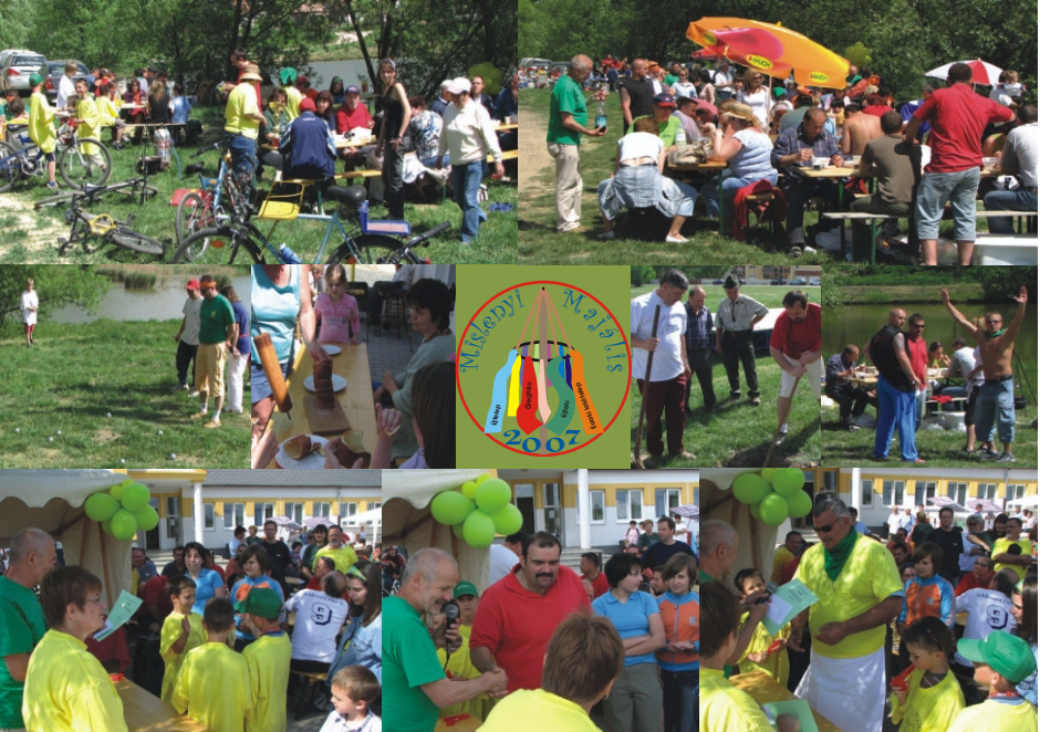
A helyismereti verseny győztese

Raktár: 7622 Pécs, Verseny u. 23. Tel: 72/213-625, 72/216-143, Mobil: 06-30/636-2971, 06-20/913-5680, Nyitva: Hétfő - Péntek 8 00 - 16 00 e-mail: zmpakk@zmpakk.hu , internet: www.zmpakk.hu