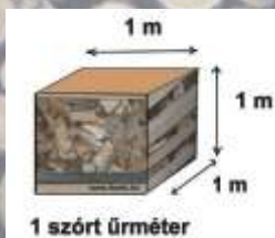
1 szórt ürméter