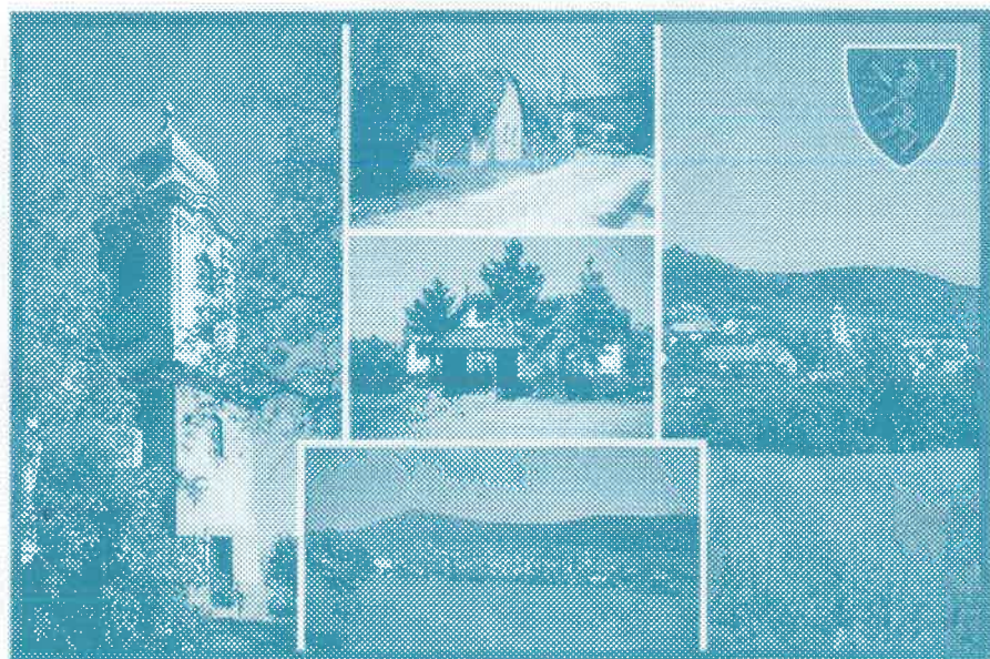
PILISBOROSJENŐ • Weindorf

Képeslap Pilisborosjenőről. Kapható a Polgármesteri Hivatal pénztárában.