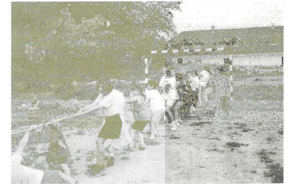
Kötélhúzás, amelyen a lányok bizonyultak erősebbnek.