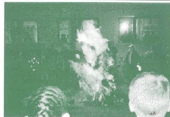
Kisze bábú égetés