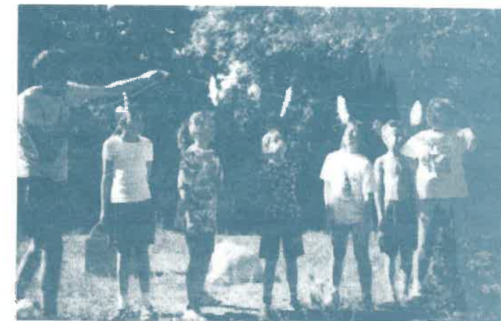
Lepény evés a Kövesbérci-tisztáson