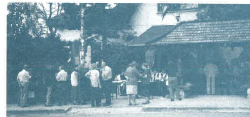
Majálisozók a Művelődési Ház előtt