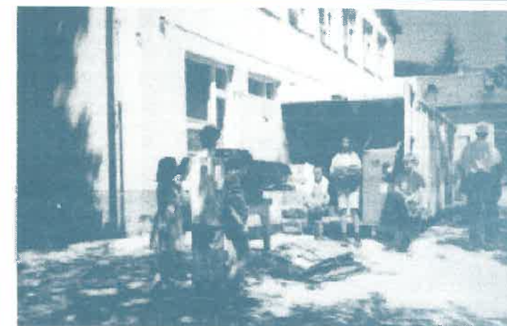
Tavaszi papírgyűjtés az iskolában, melyen ismét nagy mennyiségű újsággal teltették az udvaron felállított konténeret.