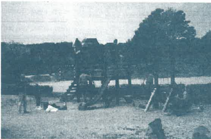
A játszótér felújítói