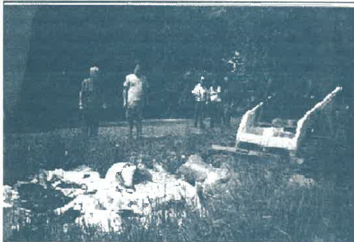
A Budai úti munkálatok

Külön köszönjük a POLGÁRÖRSÉG által hozott üdítő italokat!