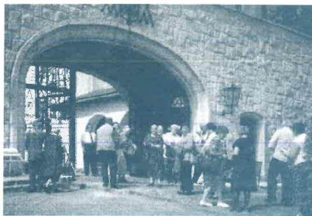
Pannonhalmi kirándulás a Karitas szervezésében