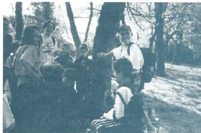
Már hagyomány az iskolában a Föld napján megrendezett vetélkedő, melynek első állomásán virágpalántákkal díszítették a tanuló az udvart és az épület környékét.