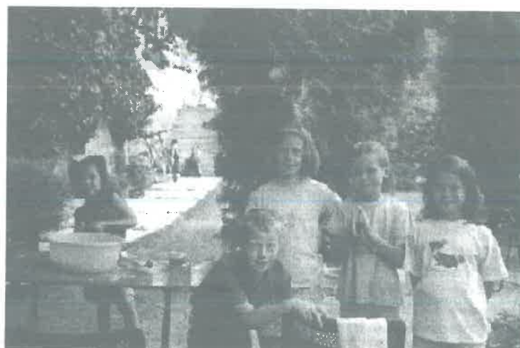
Nemezelés: labdák, babák, tarisznyák gyapjúból