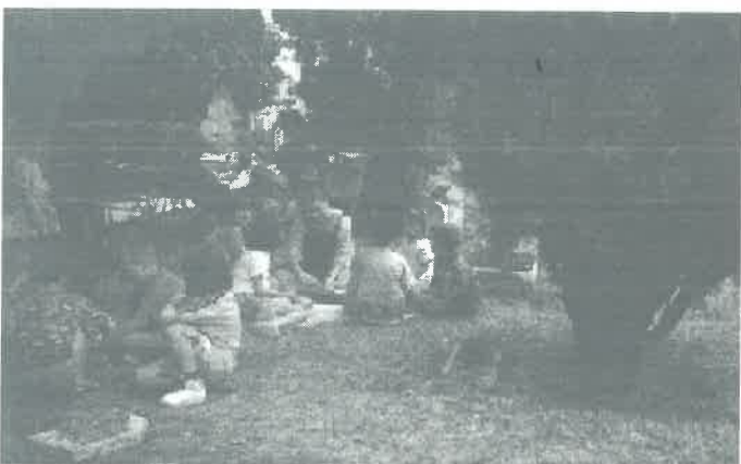
Ebéd után szól a citeraszó