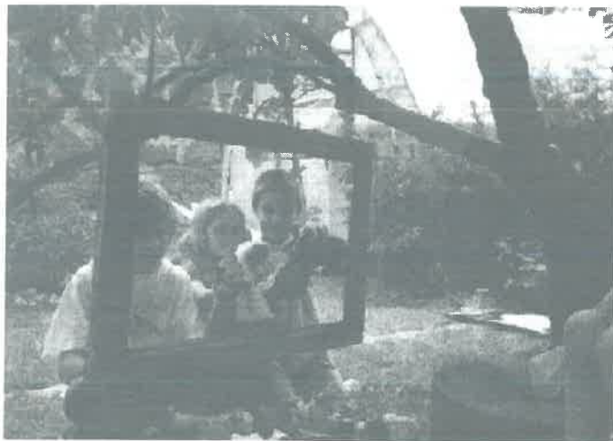
Amikor a bábok életre kelnek

A gyerekeken túl meséljenek az alábbi képek: