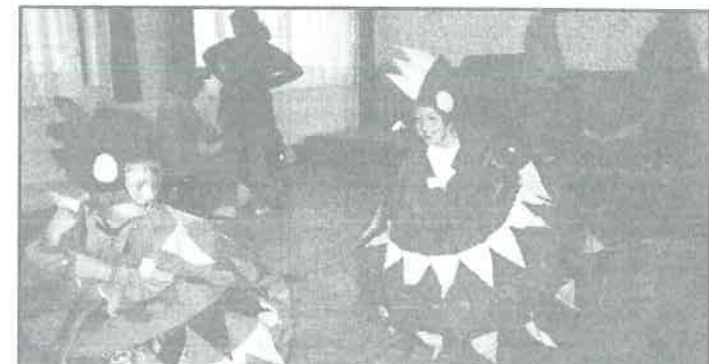
Nyár búcsúztató, amelynek a megrendezését a kitarító esőzés sem tudta elmosni.