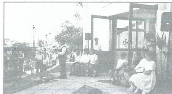
Tanévkezdés az iskolában, melyen 4 új tanterem átadására is sor került.