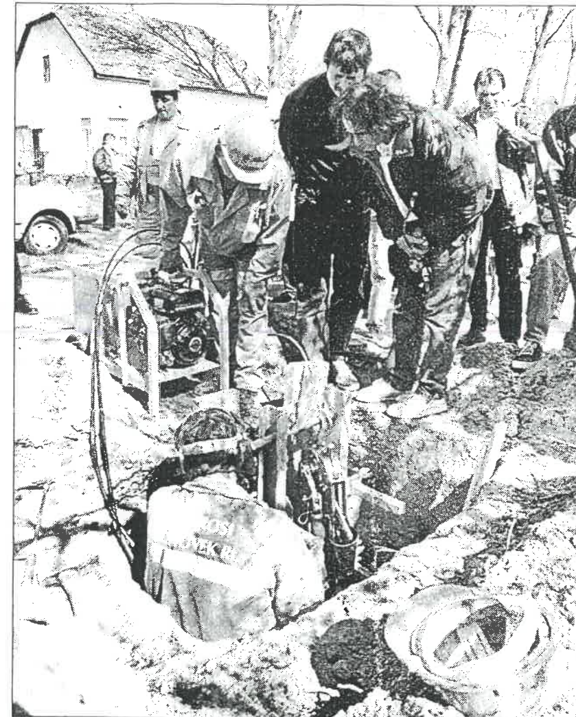
A vízművek a bekötés elkészítését is vállalja

oron kívüli hizerint nő, a leg- rint. rendelkező in- negosztására is zett mellékme- nyiben a mel- lítőttől kéri a mellékmérők n leír módon ket szakgépész t a jogosult n. Számlázási zükséges a fő- z ingatlanulaj- z utóbbi a tár- g képviselété- i, osztatlan kö- zes tulajdonos