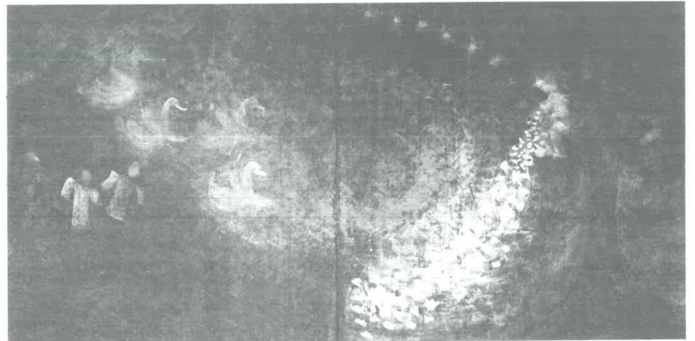
A har hattyú