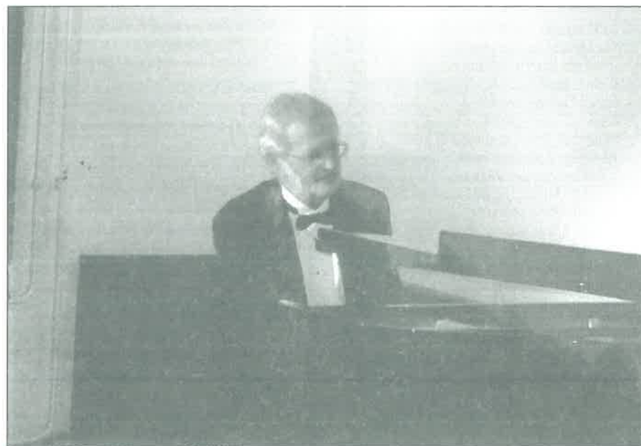
A zongorát Jandó Jenő Kossuth és Liszt díjas művész avatta fel felejthetetlen játékával