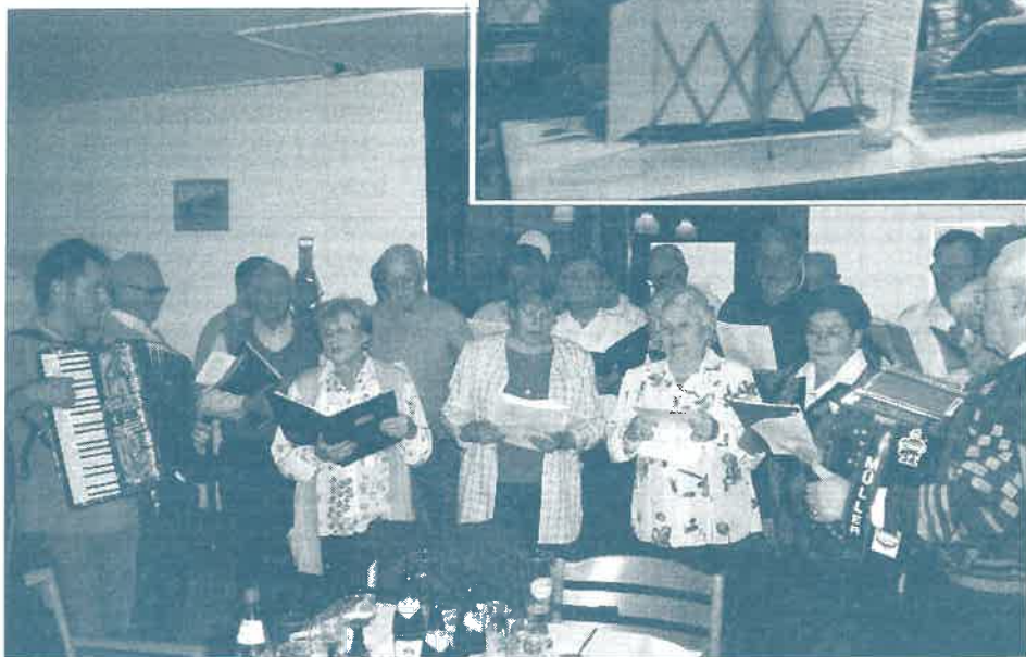
A Német Nemzetiségi Dalkör, a Singkreis