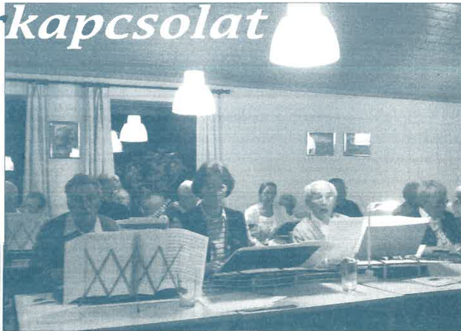
A Bavaria Zittern stájer citera együttes

A meghívó a Bavaria Zittern stájer citera együttes volt.