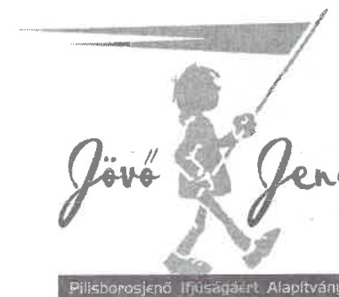
Pilisborosjenő Ifúságáért Alapítvány

Nyitva tartásunk: Minden nap 16-18 óráig, a gyermekek igényei szerint időnként tovább maradunk.