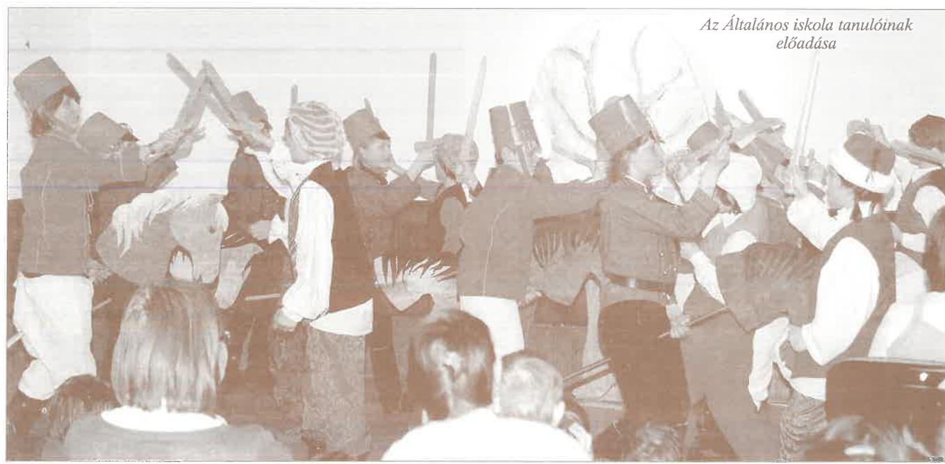
Az Általános iskola tanulóinak előadása