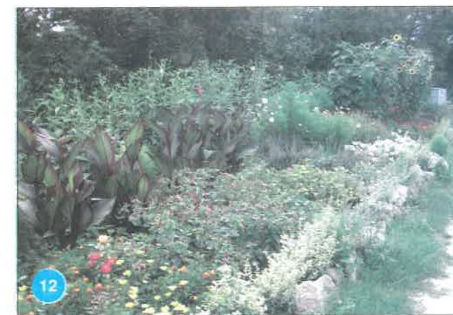
12. kép. Virágsziget Pilisborosjenőn