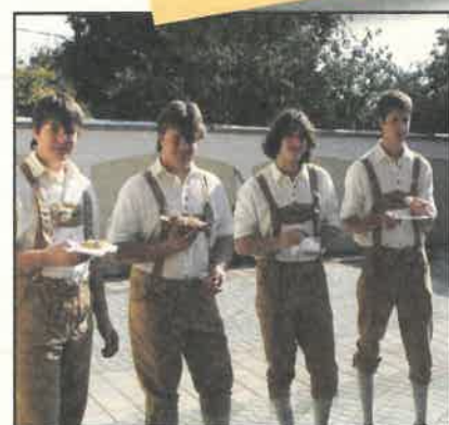
ZENÉL A MINI SRAMLI