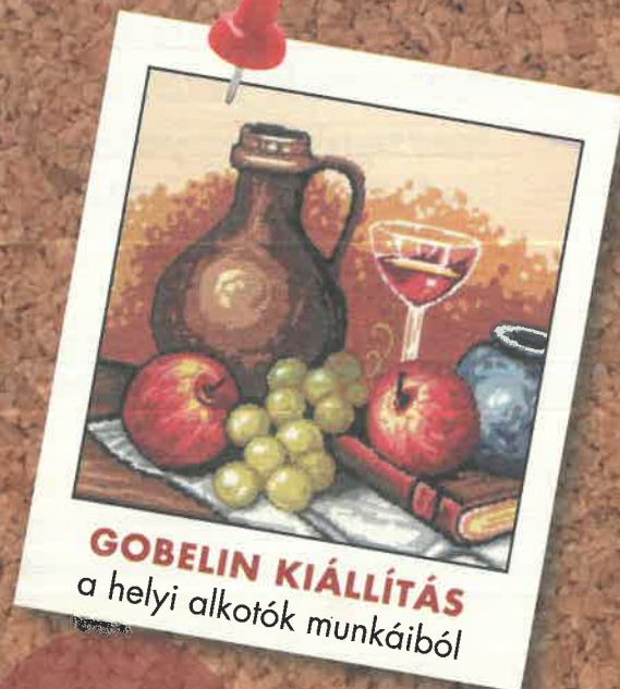
GOBELIN KIÁLLÍTÁS a helyi alkotók munkáiból

Július 11- 15. 9-16 óráig: Kézműves foglalkozások Minden nap 2-2 órás kézműves foglalkozás a kisteremben, népi kismesterségeket oktató népművészek vezetésével. Nagyteremben népi játékok, dalok, mondókák és sportjátékokkal tarkított szabadfoglalkozások. Ebéd után mesehallgatás, kis csendes pihenő!