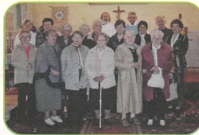
A jubileumi szentmise után

Nagyon fontos, hogy az ember úgy közelítse a társaságot, hogy „első az egyenlők között”, és végtelen megértés, alázat és szeretet legyen benne, ami az egész közösségre érvényes. Elfogadó-befogadó közösség szeretnénk lenni, nem egy bezárkózó társaság, kifelé is nyitunk.