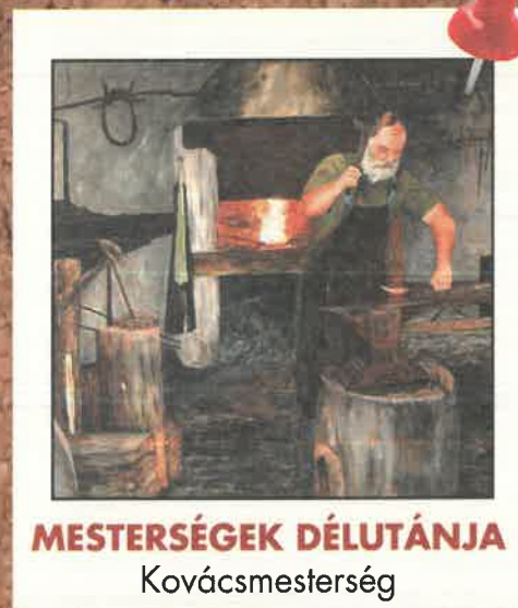
MESTERSÉGEK DÉLUTÁNJA Kovácsmesterség