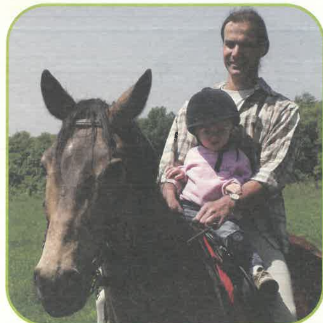
Lilla lányuk lóra kéredezkedett.

te adsz neki egy jelet, amire ő reagál, és kialakul egy harmonikus kapcsolat: ez teszi élménnyé az egészet. Jelenleg szakosztályunk pártoló tagok segítségével fejlesztésbe fogott, gyarapítva a lovak létszámát és az infrastruktúrát. Tevékenységünk nonprofit. Várjuk még újabb pártoló tagok jelentkezését, hogy lehetősége nyíljon az egyesületnek fenntartania magát, és bővíteni eszközeit, így egyéb tevékenységeinknek is hódolhatnánk, mint a cserkészlet és természetbúvárkodás. Reményeink szerint a nyár végére az egyesület már fenntartja önmagát és eléri célját: gyermekeinknek ismét utat törni a rég elfeledett ösvényeken a természetbe.