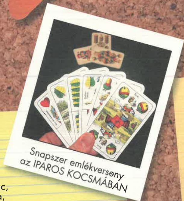
Snapszer emlékverseny az IPAROS KOCSMÁBAN