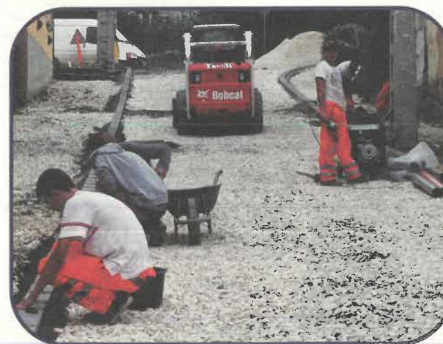
Útépítés a Mester utcában

Amint azt Önök közül sokan tapasztalták, elkezdtek Pilisborosjenő úthálózatának megújítását: építési munkák folynak a Mester utcában.