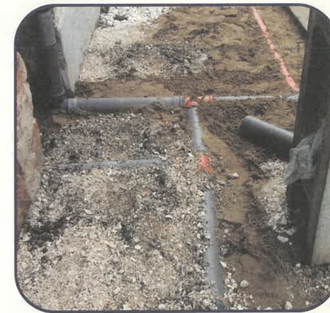
Szakcsiszó csapadékvíz elvezetés

A Mester utca az egyik legalacsonyabban fekvő utca, amelynek a terhelése nagyon nagy a hegy felől érkező csapadékvíz miatt. A tervek készítésénél és a kivitelezés során ezeket a szempontokat szem előtt tartva aszfaltszőnyegezés kétoldali szegélyezéssel, járda és kocsis beállók kialakítása történik meg.