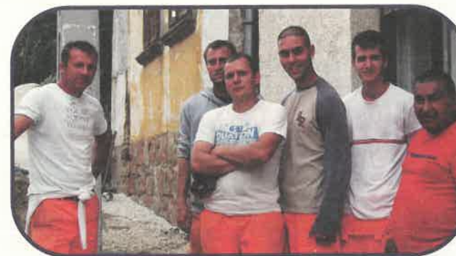
A kivitelező csapat

A település úthálózata rendkívül elhanyagolt, a kármentések, a karbantartási munkák nagy erőfeszítéseket igényelnek. Eltökélt szándékunk, hogy a falu úthálózatát megújítsuk, és csapadékvíz elvezetését megoldjuk, amivel hosszú távon költséget tudunk megtakarítani. Ugyanis, ha jó minőségben, hosszú élettartamra tervezett utakat építünk, akkor nem visz el évente több millió forintot az utak karbantartása. Ehhez az kell, hogy a legalacsonyabban fekvő utcákból kiindulva a vízvezetést szem előtt tartva komplett útépítéseket végezzünk. Az ideai költségvetésben biztosított útfelújítási keretet a Fő út iskola előtti szakaszának felújítása és az év eleji karbantartások felemésztették, ezért más megoldást kerestünk, hogyan lehetne utat építeni.