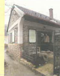
2097 Pbj., Templom út 2.

Új építésű ikerházak kis kerttel Pilisborosjenő központjában, Kántor utcában, 2012. I. negyedév végi átadással, változatos elrendezéssel, igényes, kulcsra kész kivitelezéssel eladók. Árak: 1 szintes, 2 szobás garázsos: 27 mFt, 2 szintes, 107 m 2 -es, nappali+4 háló 36 mFt Extrák: 20 cm hőszigetelés, rendkívül takarékos fűtés: léghőszivattyú + kombinált fal és padlófűtés, panoráma. Telek mérete : 376 m 2 / ikerház fél.