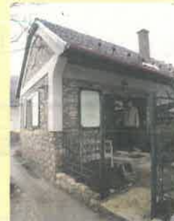
Pilisborosjenő Templom út 2.

Kiemelt ajánlataink. Válság idejére, alacsony fenntartási költséggel: