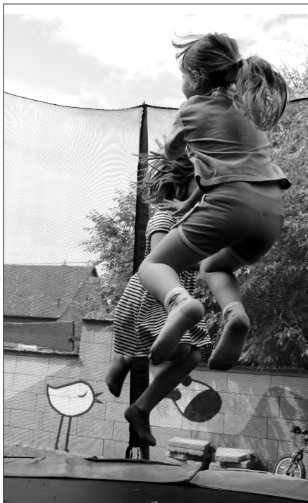
Lábakat a levegőbe!

Ezután kezdetét vette a mulatság. Minden csoport más helyszínről indult, mi a Mókus csoporttal a trambulint vettük birtokunkba elsőként. Itt mindenki próbára tehetette izmait.