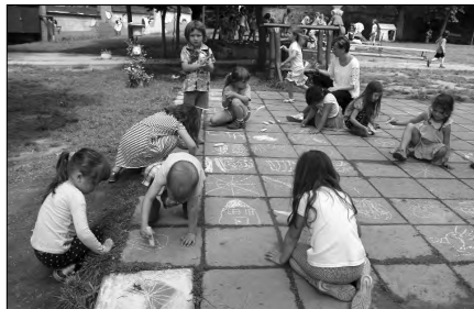
A motorpályát aszfalkrétával varázsoltuk tarkává, csodás rajzokat kanyarítottak az ügyes kis kezecskék.