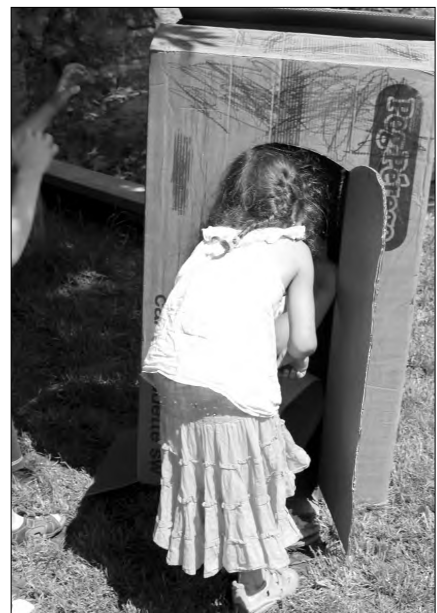
Az előző nap színesre festett dobozokból épített dobozvárosban ment a bújócska.