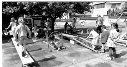
A tornapályán egyensúlyozhattak, lépegethettek, bújhattak és mászhattak kicsik és nagyok,