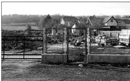
Évekig ezt a képet láthatta a falunkba érkező