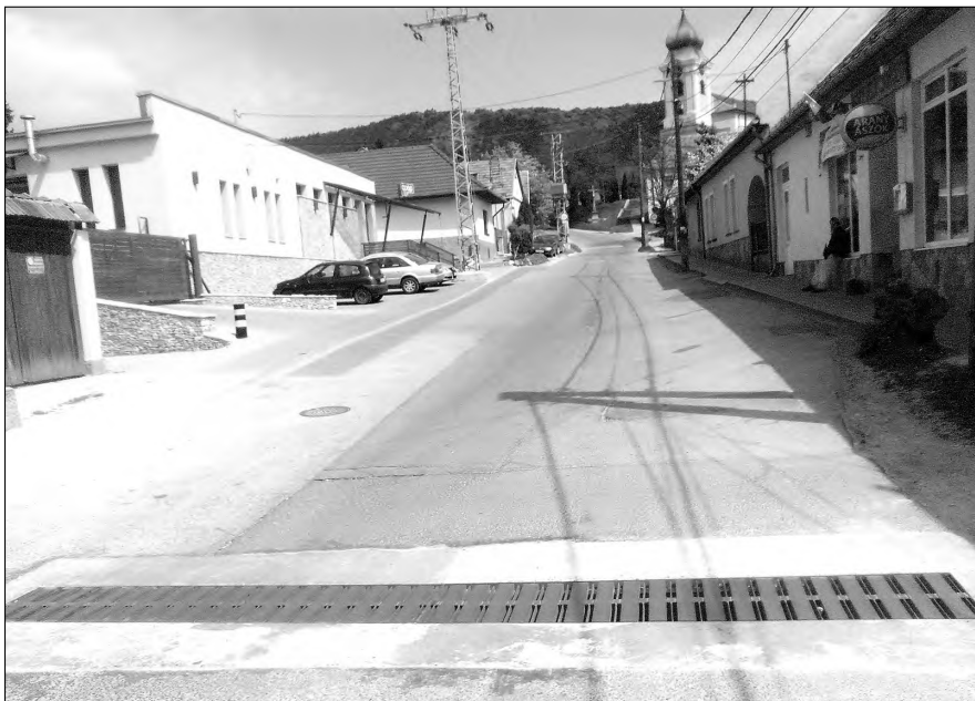
Kijavította az önkormányzat a Templom utca elején lévő vízátereszt.

Folyik a Budai úton lévő régi Tüzép telep nagytakarítása. Az évekig itt tárolt építési és egyéb törmeléket végre elszállítják innen és a felszabadult telket az önkormányzat más, hasznos célra fogja használni.