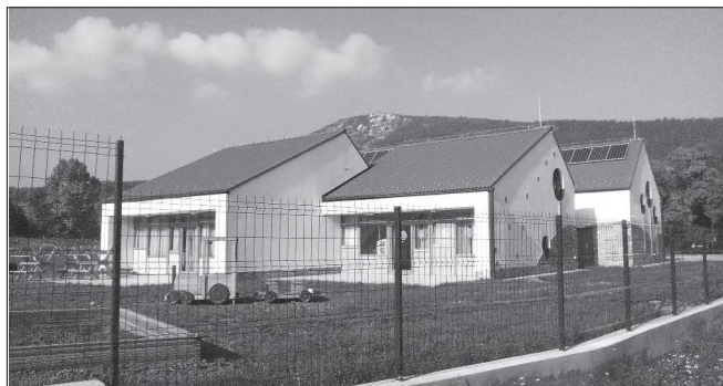
Az új óvoda őszi napfényben

Délutánra a függönyök is a helyükre kerültek, így másnap, szeptember 1-jén egy jól felszerelt óvoda várta új lakóit.