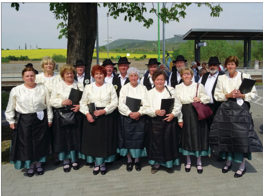
A rendezvényen fellépett a pilisborosjenői Német Nemzetiségi Dalkör