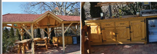
Egyedi, különleges kerti pavilon és szekrény.

Külső,- és beltéri lépcső, kerítés, kocs beálló, előtető, be- épített szekrény, konyhabútor készítése, lamináltpadló-lerakás