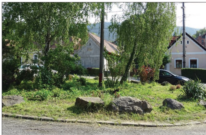
Az önkormányzat munkásai rendbe tették a Kossuth tér közepén található „zöldszigetet”. Köszönjük!