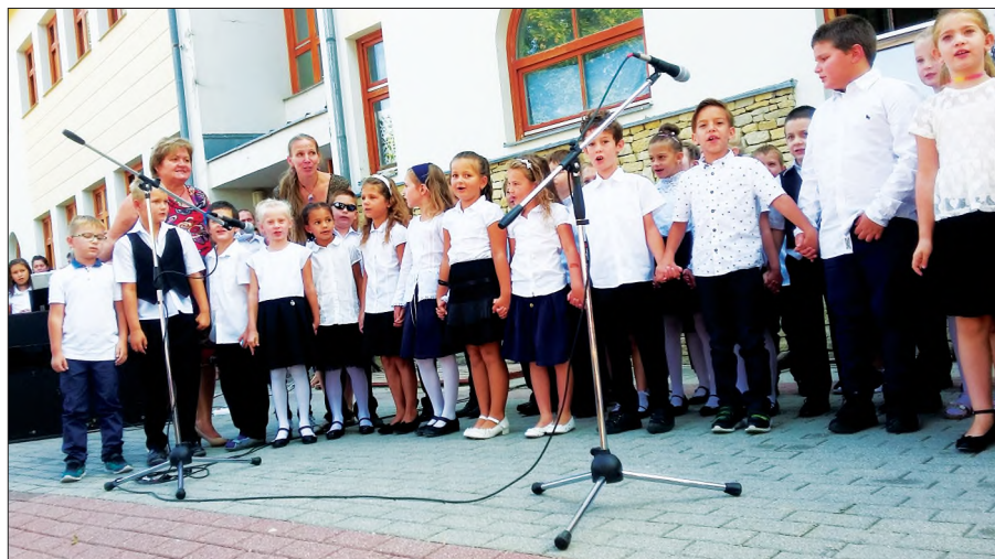
Új lakók az iskolában