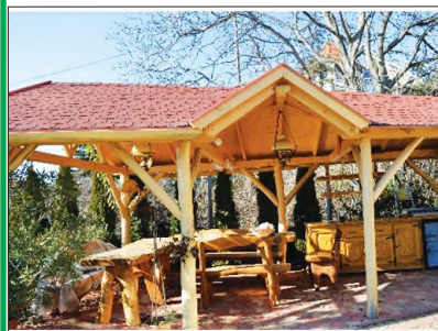
Egyedi, különleges kerti pavilon

Külső,- és beltéri lépcső, kerítés, kocsik beálló, elötető, beépített szekrény, konyhabútor készítése, lamináltpadló-lerakás