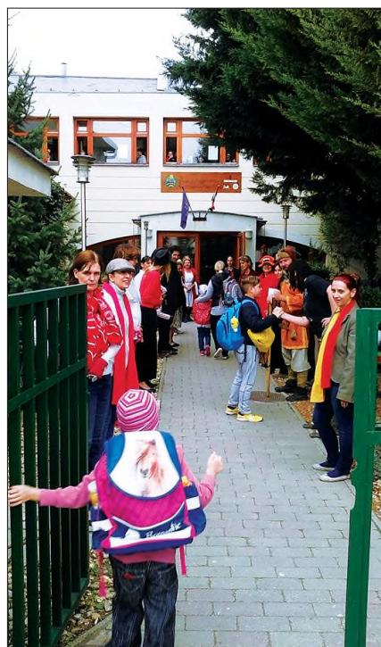
Nyelvek Európai Napja

Szeptember 26-án az Nyelvek Európai Napja alkalmából sok színes programmal vártuk a gyerekeket. Már reggel, iskolába érkezésükkor idegen nyelven köszöntöttük őket, majd a falakon kiplakátolt érde-