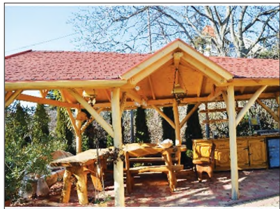
Egyedi, különleges kerti pavilon

Külső- és beltéri lépcső, kerítés, kocsik beálló, előtető, beépített szekrény, konyhabútor készítése, laminálpadló-lerakás