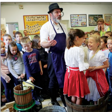
Hagyományörzés az iskolában