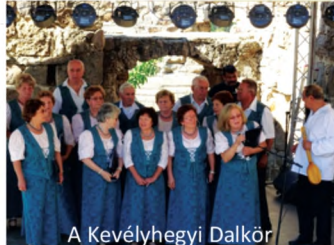
A Kevélyhegyi Dalkör