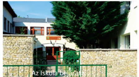
Az Iskola bejárata