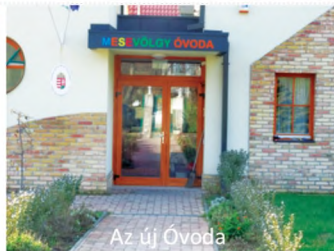
Az új Óvoda