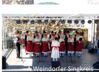
A Weindorfer Singkreis