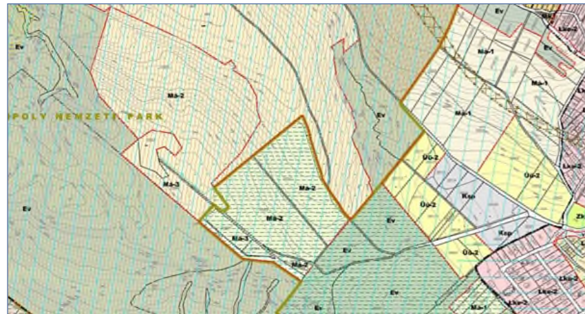
SZABÁLYOZÁSI TERV kivágat

A kérdés tehát hogy a jelenlegi 0%-os beépíthetőséget maradjon kártérítés fizetési kötelezettség mellett (ez esetben a nem választ tudja majd bejelölni), vagy pedig, hogy visszaállítsuk a korábban hatályos állapotot és ne kelljen ezáltal kártérítést fizetni. (igen választ kell ebben az esetben megjelölnie).