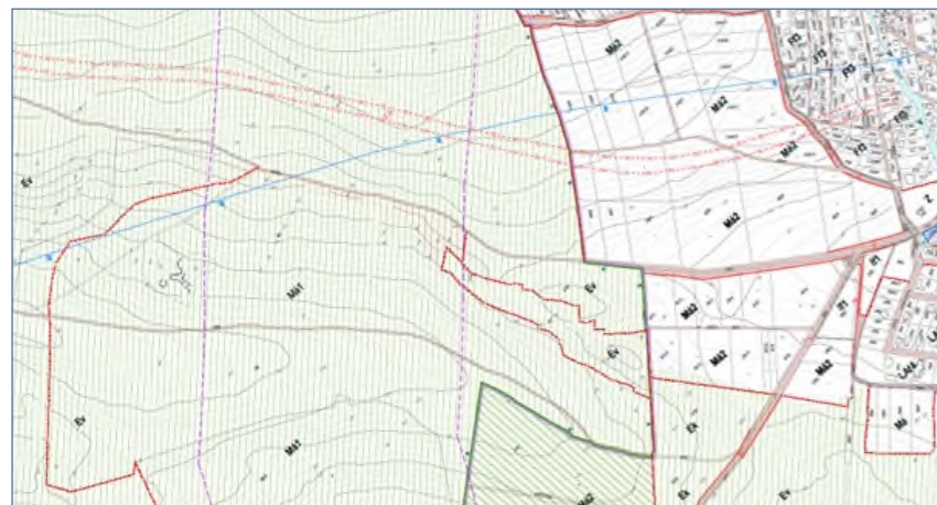
SZABÁLYOZÁSI TERV kivágat