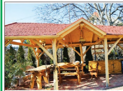
Egyedi, különleges kerti pavilon

Pontos tervezés, kivitelezés. Vállalunk: átalakítást és felújítást. Külső-, és beltéri lépcső, kerítés, kocsibeálló, előtető, beépített szekrény, konyhabútor készítése, laminátpadló-lerakás