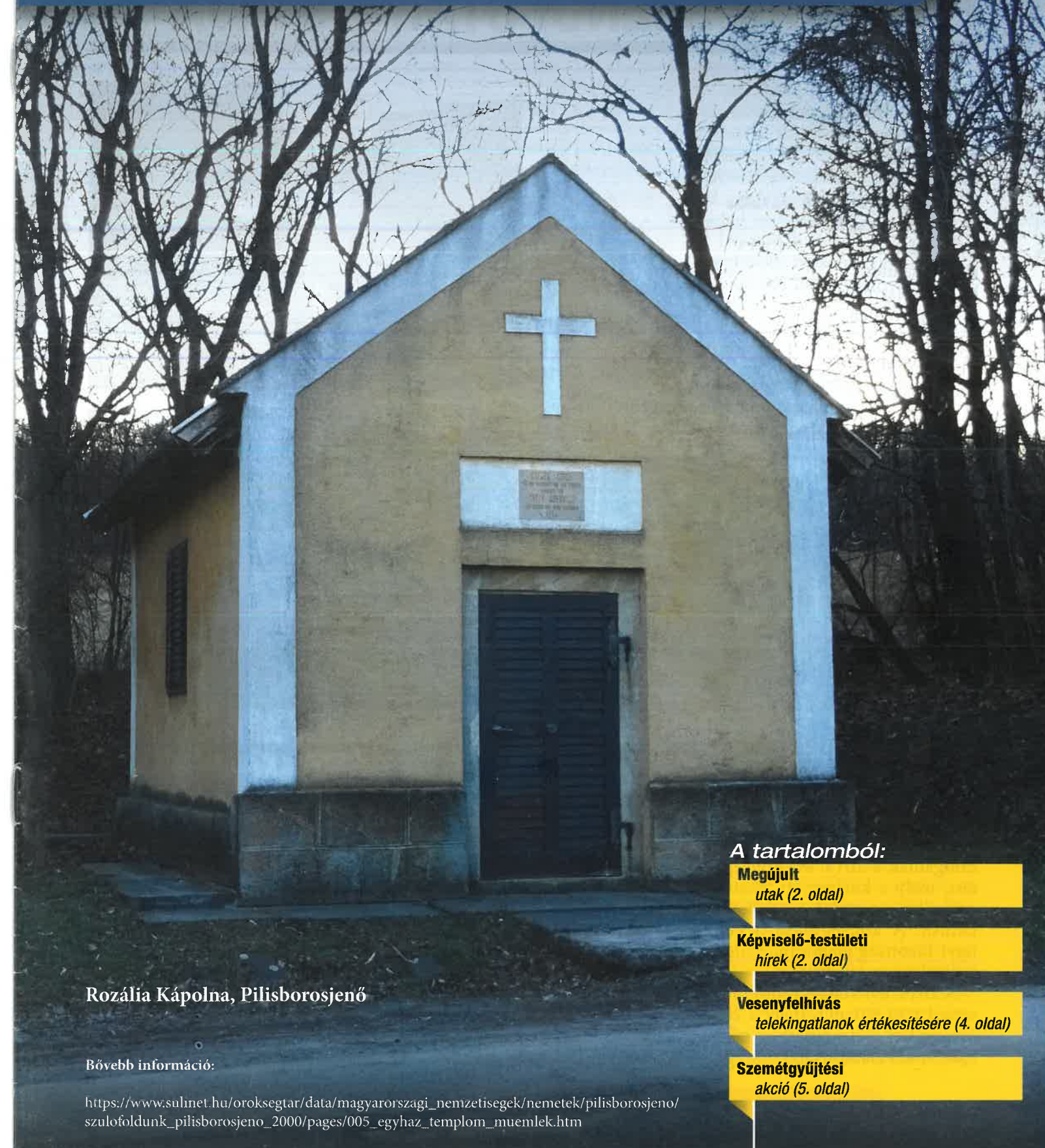
Rozália Kápolna, Pilisborosjenő