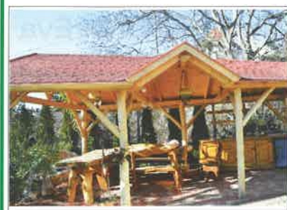
Egyedi, különleges kerti pavilon

Praktikus, igényes kialakítás házon kívül-belül az Ön elképzeléséhez igazodva. Egyedi méretekre gyártott termékek. Pontos tervezés, kivitelezés. Vállalunk: átalakítást és felújítást. Külső- és beltéri lépcső, kerítés, kocsibeálló, előtető, beépített szekrény, konyhabútor készítése, lamináltpadló-lerakás