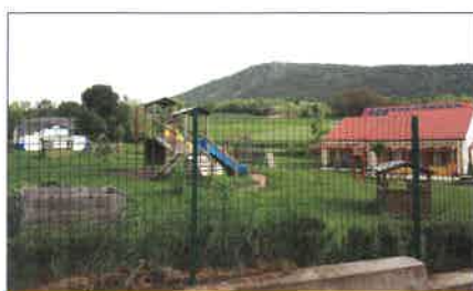
Amelynek színpompás természeti környezete és ZÖLD udvara van.