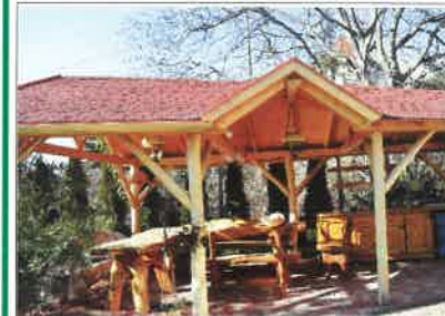
Egyedi, különleges kerti pavilon

Pontos tervezés, kivitelezés. Vállalunk: átalakítást és felújítást. Külső-, és beltéri lépcső, kerítés, kocsibeálló, előtető, beépített szekrény, konyhabútor készítése, lamináltpadló-lerakás