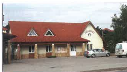
Van Egészségházunk is!