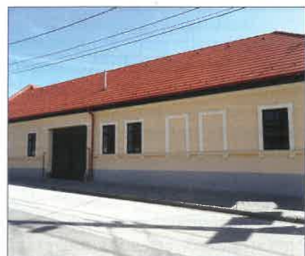
A felújított Német Nemzetiségi Tájház is szemet gyönyörködtető lett így, felújítva