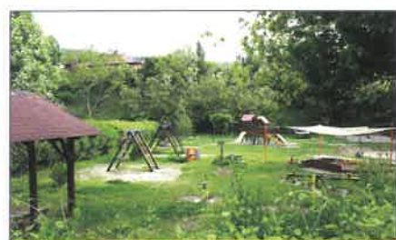
Sokan örülnének egy ilyen szép játszótérnek Budapesten!