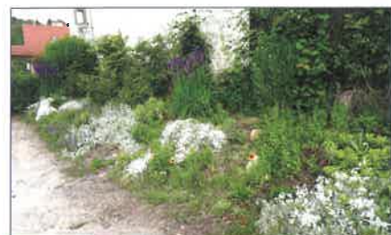
Vajon hol lehet ez a gyönyörű virágszegély? Falunkban, az Óvoda parkolójának szélén.