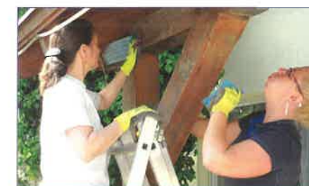
Művelődési Ház épületének előtetőjét megszabadították a rátelepedett mohától, kosztól