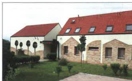
Ahogy csodás Óvodánk is!