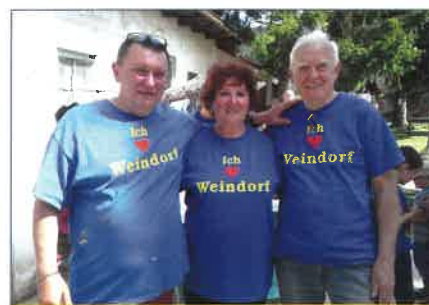
Beszélgető partnereim a Sublótón

A Sublót a garázsvasárkók alapján működik. Előzetes asztalfoglalás után mindenki árulhatja régi megunt dolgait, a bevétel 30%-át felajánlja a Tájház felújításra, vagy csak fogyaszt valamit a büfében (sváb gombapaprikás, rétesek stb.) s már ezzel is tud támogatni.