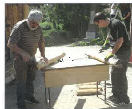
A kissé elhasználódott megálló megszépülve várja majd utasait

Rövid videó itt tekinthető meg: https://youtu.be/83JKj3QAUiU