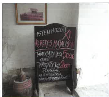
A Tájház kapualjában lévő fogadótábla invitálta a betérni szándékozókat

2019. május 18-án rendezték a szokásos pilisborosjenői tavaszi rendezvényt, a Kerekes Majálist Pilisborosjenőn. Az iskola átköltözése miatt most a Tájház adott lehetőséget a rendezvény lebonyolítására a szokásos belterületi iskola udvara helyett.