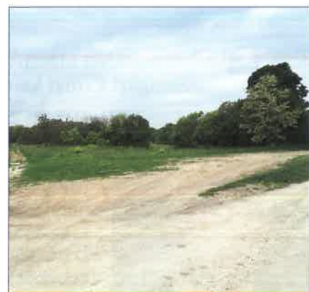
Ezen a területen lesz az Óvodabővítés és a Bölcsőde.