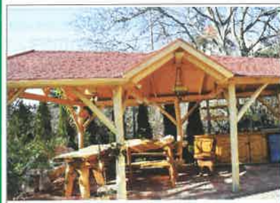
Egyedi, különleges kerti pavilon

Külső- és beltéri lépcső, kerítés, kocsi beálló, előtető, beépített szekrény, konyhabútor készítése, laminátpadló-lerakás