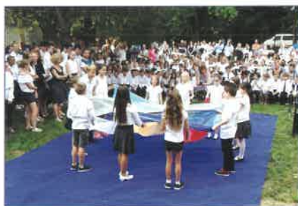
A 3. b osztály tanuló a Szivárványtánc című produkciójukkal kedveskedtek a jelenlévőknek.