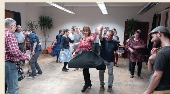
Január 6. Kerekes Táncház