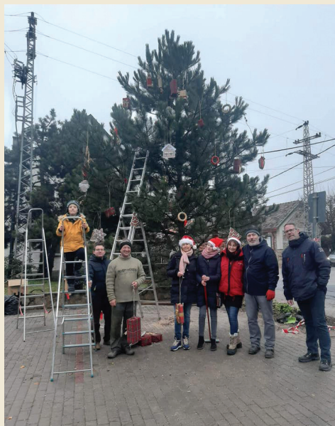
Karácsonyfa díszítők csapata