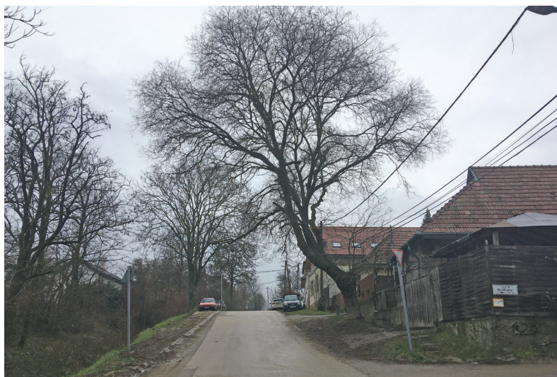
A Fő utca 83. szám előtti japánakác veszélyes állapotba került, sajnos ki kell vágni

részét képezi. Február során az elhalt, valamint a veszélyessé vált egyedek kivágása kerül napirendre, de haladunk az invazív fajok, kiváltképp bálványfa gyérítésével is, mely természetvédelmi szempontból kiemelt fontosságú. Kérem, tájékozódjanak