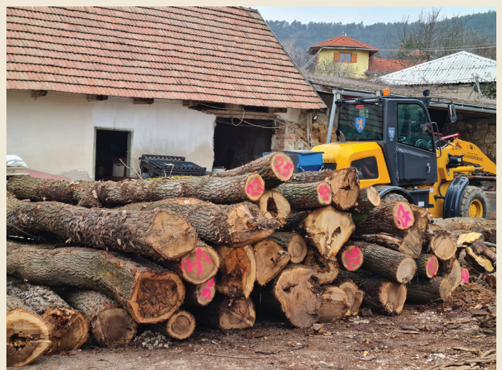
Megérkezett a régóta várt szociális tűzifa utolsó adagja, a megnövekedett lakossági igények és a kedvezőtlen időjárás miatt most tudta kiszállítani a Pilisi Parkerdő, a gondnokság munkatársai igyekeznek mielőbb eljuttatni a lakosokhoz.