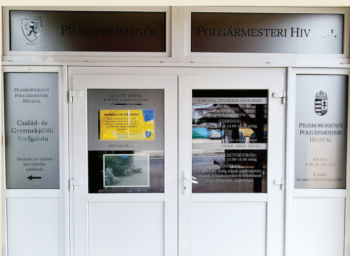
Információs matricákkal újult meg a Polgármesteri Hivatal bejárata

Mindannyian hozzájárulunk településünk működéséhez!