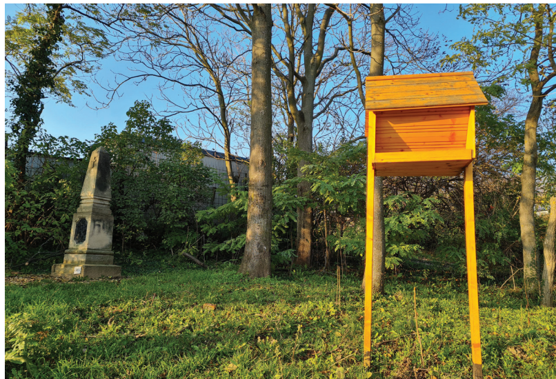
A DINPI kérte, hogy a falu határán állítsuk meg a természet felé terjedő invazív fajokat

Lombtalan állapotban jó alkalom kínálkozik a kerttulajdonosok számára, hogy felmérjék a tulajdonukban álló