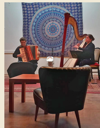
Zenezsoba, Duo Concordia koncertje