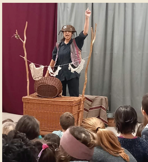
Jenői Advent, Viadal, avagy a kakas, acsászár és a gyémánt félkrajcár, Ládafta Bábszínház