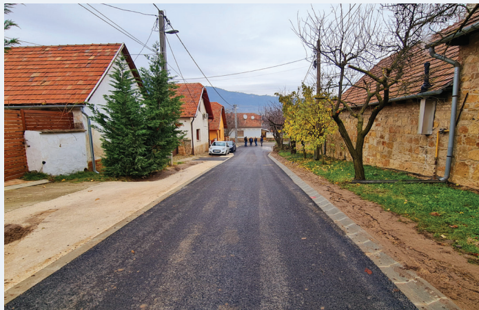
A megújult Steinheim utca

A település régi utcája nemcsak neve miatt ikonikus, hanem szép házai miatt is. Régióta aktuális volt útfelületének megújítása, mely végül pályázati pénzből tudott megvalósulni. Reméljük, hogy minden lakos meglelégedéssel fogja tudni használni.