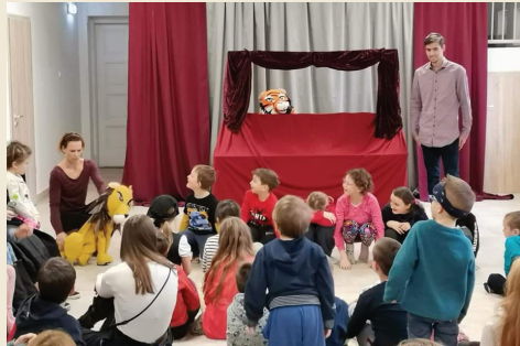
Cirkuszi Mulatság a Magyar Kultúra Napján a Babos Társulattal copy