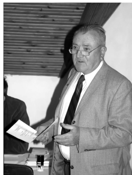
Fotók: Windisch László - Akikre büszkék lehetünk c. film (YouTube)