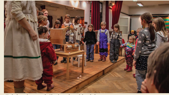
Falukarácsony, bábtáncoltató betlehemes