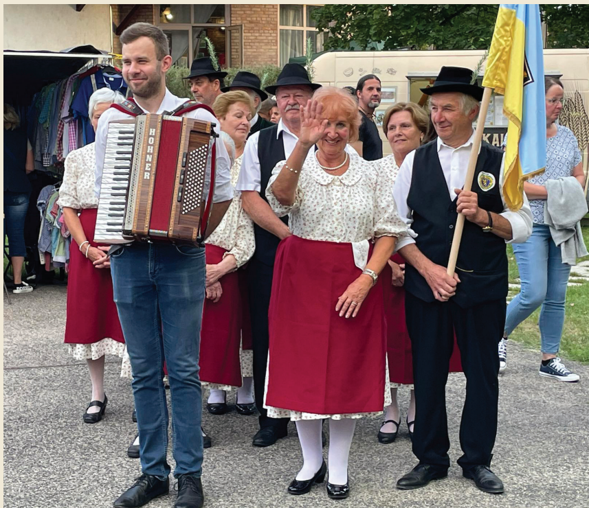
2023. szeptember elsején dalkörünk, a Deutschklub Weindorfer Singkreis remek műsorral lépett fel a Budakalászon immár hagyományosan megrendezett VII. Sörfesztiválon.