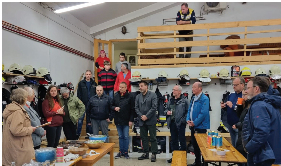
Látogatás az önkéntes tűzoltóknál

tozott bennünket Steinheim am Albuch polgármestere, három alpolgármestere, a település két választott képviselője, illetve a hivatalvezető és helyettese. Nagyon nagy dologként értékeltük, mert az utolsó csereprogram a két település között 2006-ban volt, a legutolsó személyes találkozó pedig 2013-ban, amikor egy Steinheim által meghirdetett fotópályázaton két pilisborosjenői diák és tanárunk járt a baden-württembergi díjátadón. Szóval, volt miért izgulni, hiszen az elmúlt 20 évben minimálisra csökkent a két település között a viszony, amit nagyon szerettünk volna újraéleszteni. Ebben segítségünkre voltak azok közül néhányan, akik a korábbi szakaszokban aktívan szervezték a csereprogramokat és akár még mindig élő kapcsolatot tartanak fenn egy-egy ottani lakossal, családdal.