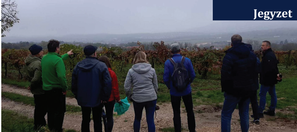
Borkóstolót követően a tájképvédelmi szőlőben is jártunk

Már az előkészítés során mutatkoztak arra jelek, hogy a falunk és változásai tényleg nagyon érdeklik az érkező delegációt: magas szinten képviseltették falujukat és nem akartak a környékbeli településekre, tájakra kirándulni vagy várost nézni, hanem csakis a falunkra voltak kíváncsiak. Örömmel raktunk össze egy elég sűrű kétnapos programot, melynek során megismerkedtek képviselőkkel és bizottsági tagokkal, a német nemzetiségi önkormányzat vezetőivel és hagyományörzőivel, voltak mindkét falubeli iskolában, bejárták az óvodát és megnézték a bölcsődét is. Részt vettek Márton-napi lámpás felvonuláson és Szent Márton-ünnepen, helyi borkóstolón, tájházbemutatón, jártak az ürömi és a pilisborosjenői templomban,