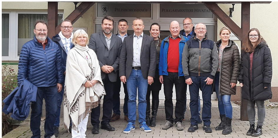
A steinheimi delegáció a polgármesteri hivatal előtt az óvoda és a bölcsőde megtekintését követően

Már közvetlenül a 2019 őszi önkormányzati választások után terveztük Steinheim am Albuchal a sváb lakosság kitelepítése óta meglévő, formálisan 1980-ban kötött testvértelepülési kapcsolat újraélesztését. Az utóbbi évtized(ek)ben ugyanis érezhetően csökkent a kapcsolat aktivitása. 2019-ben csak a kapcsolatfélévelre futotta, ami elgondolkodtató és sikeresnek mondható volt. Az új steinheimi polgármester ugyanis azt válaszolta kezdeményező levelünkre, hogy akkor látja értelmét a kapcsolat újrafelvitelének, ha ez nem csak két polgármester vagy két képviselő-testület formális kapcsolata lesz, hanem a társadalom széles rétegei kezdeményezik és lesznek hasznélvezői a két település kapcsolatának. Teljesen egyetérttünk ebben a németországi Baden-Württemberg tartományban, messés természeti környezetben fekvő, 8800 fős település új polgármesterével, Holger