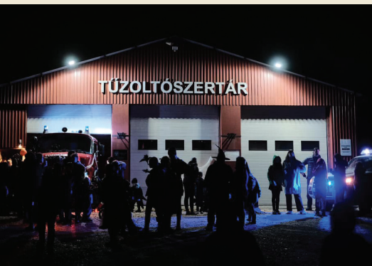
Halloween partit szerveztünk az udvarunkon

Tisztelt lakosok, támogatóink! Lassan kezdetét veszi az ünnepi készülődés. Sokasodnak a kályha körül eltöltött esték, és mint sokan, mi is számot vetünk az idei év történéseiről. A számadás azonban még várhat és nem is kiabálnánk el ideje korán, de kiemelt eseményről ebben a lapszámban sem kell beszámolnunk. Ami viszont az eseménymentes napokat jelenti, ez soha sem egyenlő a tétlenséggel, annál is inkább, mert tudásunk fenntartására ilyenkor kiemelt figyelmet fordítunk. Az elmúlt hónapokban több különböző gyakorlatot sikerült megszerveznünk és végrehajtanunk. Ezen felül, megérkezett az őszi pályázati dömping is, amibe ismételten nagy reményekkel vágtunk bele és remélem, hamarosan jó hírekkel szolgálhatunk. Szerencsére az év első felében már voltak pozitív elbírálás alá eső pályázataink, így gyarapodott egyesületünk - többek között - robbanó motoros magassági ágvgággóval és a légzőpalackjainkat védő tűzálló huzattal. Végezetül szeretnénk mindenkinek áldott, békés ünnepeket kívánni! Ha pedig segítségre van szükség, ne feledjék, mi mindig itt vagyunk, segítünk és őrizzük a lángot!